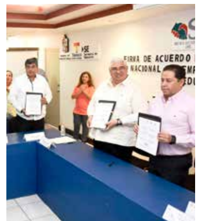
El acuerdo se firmó en la SETAB.