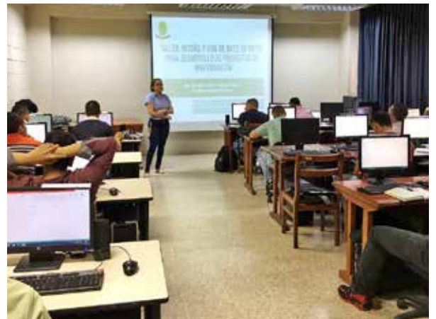
Taller Uso y Manejo de Datos en los Proyectos de Investigación.

Durante su estancia, la profesora también tuvo la oportunidad de concretar una visita e intercambio de experiencias en líneas de investigación agropecuarias en el Instituto Nacional de Investigaciones Agropecuarias (INIAP) Ecuador, con la posibilidad de movilidad de