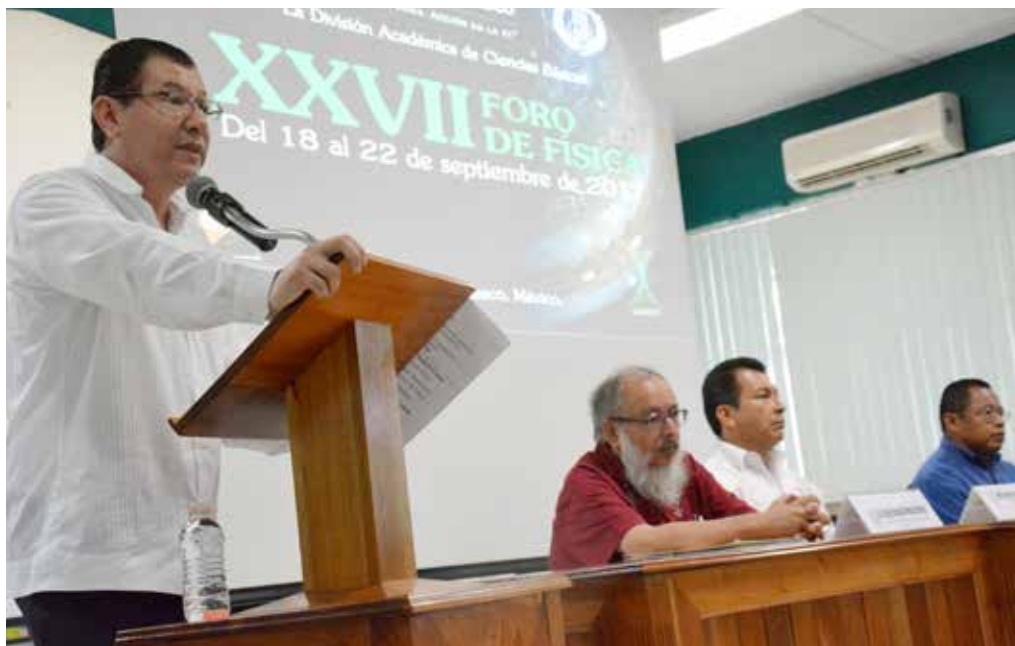
El Director de la DACB dio la bienvenida a los conferencistas de esta edición del Foro de Física.