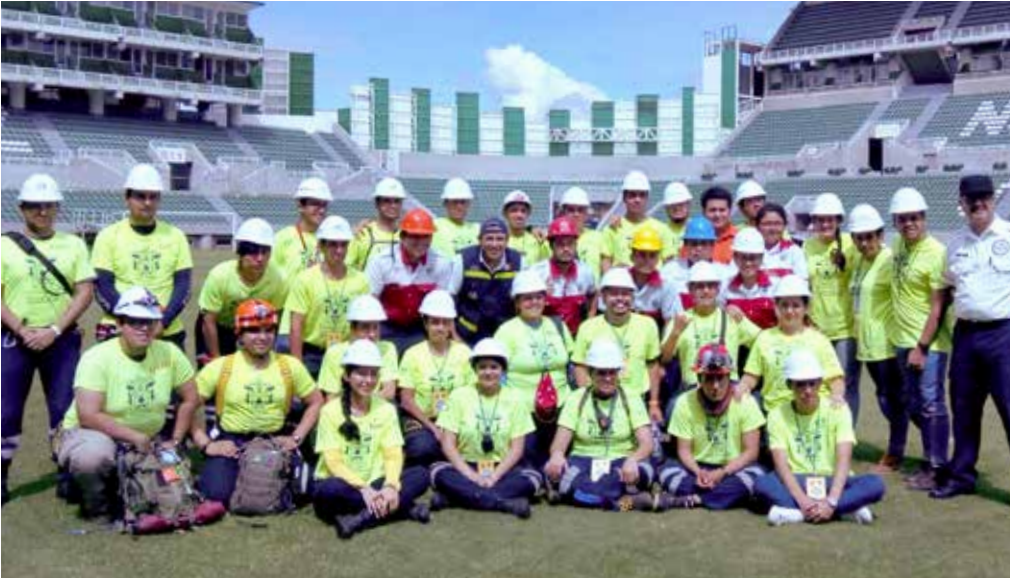
En el Estadio "Coruco Díaz" en Zacatepec, Morelos se concentraron diversos grupos de ayuda del país.