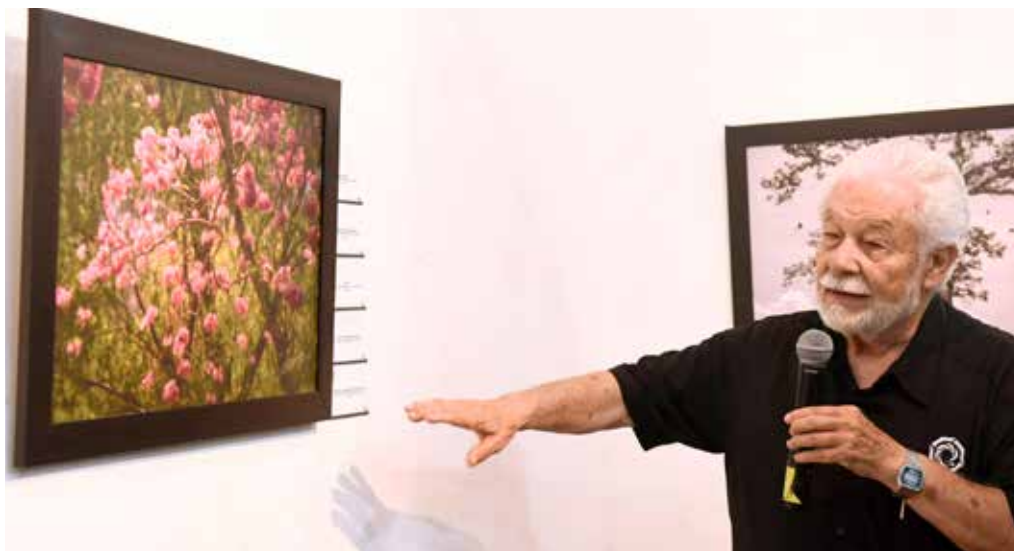
Granados fue calificado como uno de los creadores visuales más completos en Tabasco.

» La Galería de Arte del Instituto Juárez fue sede de la exposición fotográfica Miro... Luego existo.