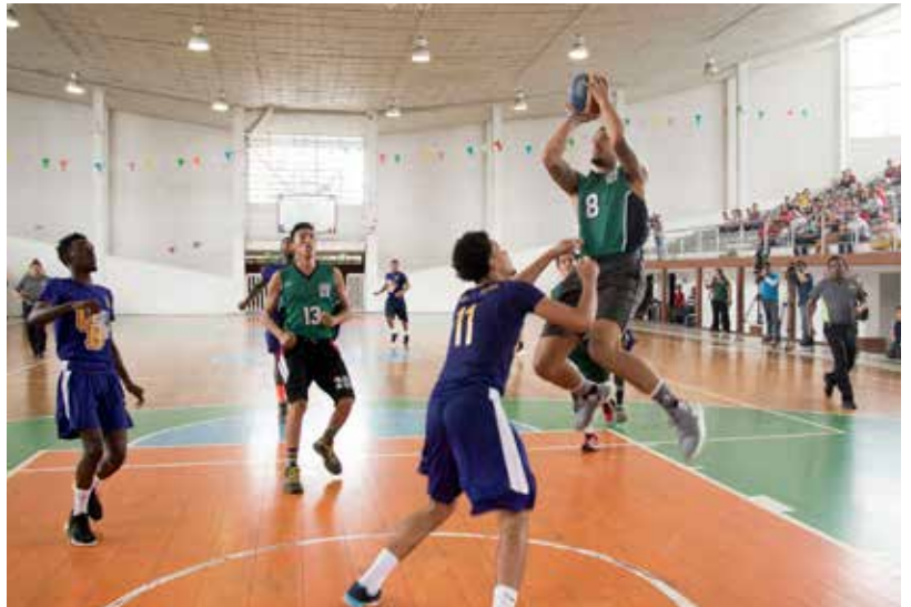
Las actividades del partido y las clínicas, se realizaron en el Palacio de los Deportes.

Con el apoyo de la afición que vivió con gran intensidad las acciones del partido y de las porras a cargo de "Juchimanes Elite", el equipo de la UJAT hizo su mayor esfuerzo en el cuarto y último pe-