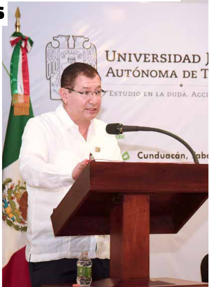
El informe se realizó en 7 de septiembre en el auditorio “Ing. Adolfo Palavicini Álvarez”.

ellos, lo hicieron en el ámbito internacional en universidades de Japón, Argentina y Colombia”.