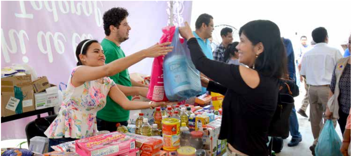
Los tabasqueños respondieron a la convocatoria para apoyar a damnificados por los sismos.