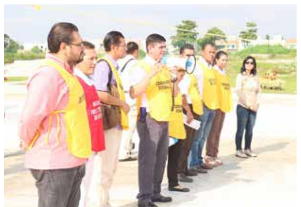
El Director de la DACEA dio los pormenores

+9 minutos duró la evacuación en el segundo punto