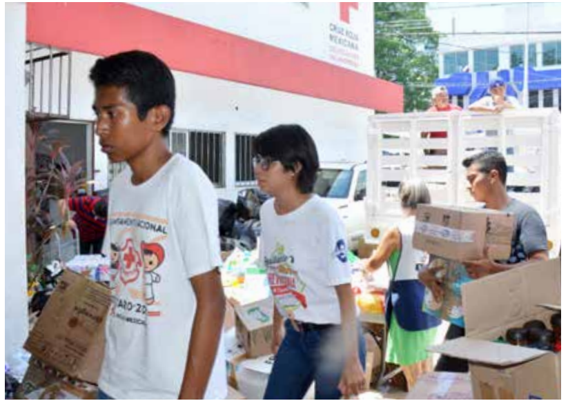
La ayuda fue entregada en las instalaciones de la Benemérita Cruz Roja delegación Tabasco.