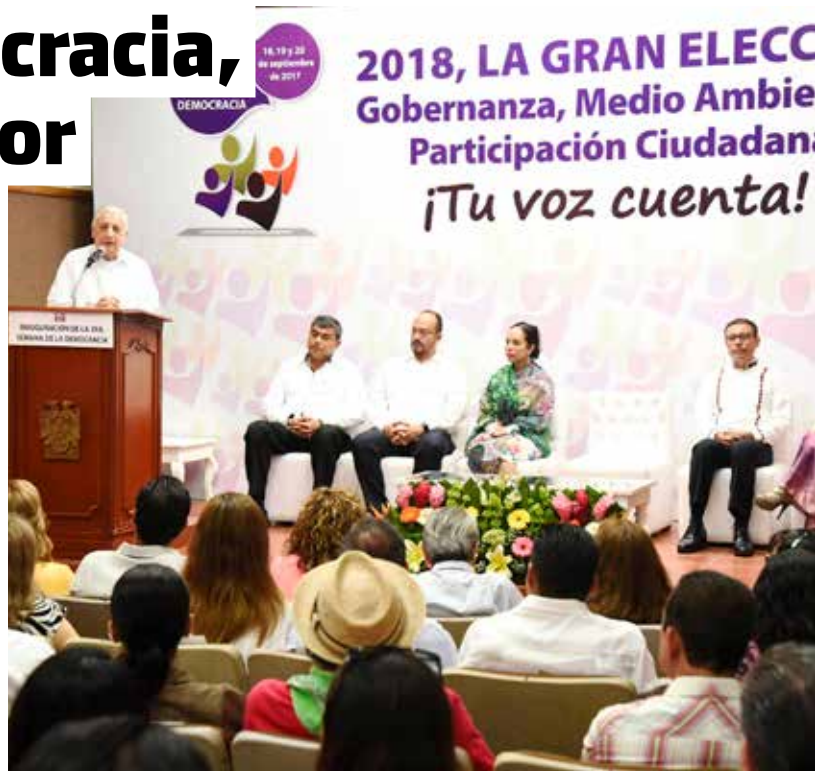
La Tercera Semana de la Democracia inició sus actividades en el Instituto Juárez.

que a lo largo de los años se han realizado innumerables reformas para relegitimar el sistema electoral mexicano (en alguna de las cuales él participó personalmente), y recordó que estas modificaciones iniciaron a partir de la crisis de legitimidad que se presentó después de la elección federal de 1988.