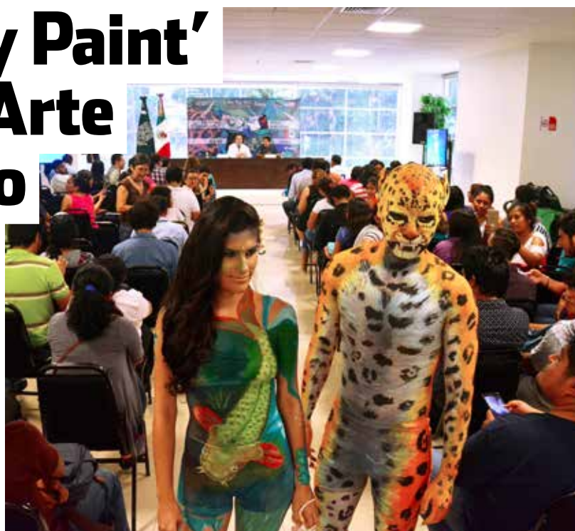
El vestíbulo del CIVE fue el escenario para la inauguración de esta Muestra.