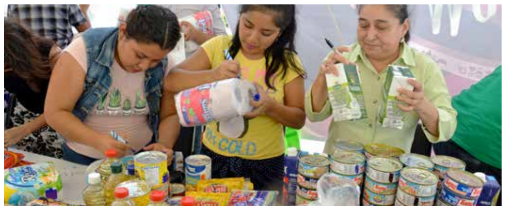
La solidaridad de los universitarios se puso de manifiesto ante la emergencia nacional.