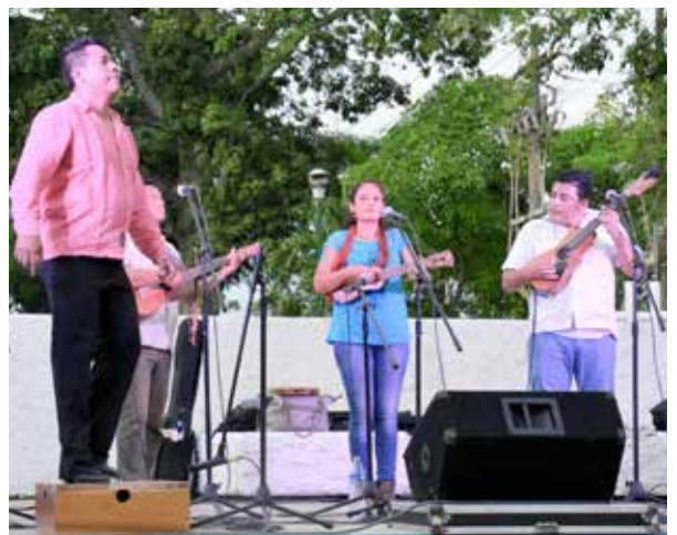
"La iguana" fue uno de los temas interpretados.

En su participación invitaron al público a seguir aportando su granito de arena entregando víveres de primera necesidad y artículos de higiene personal.