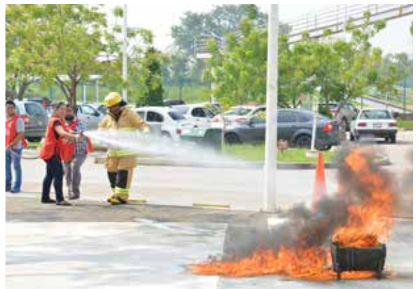
Se realizaron protocolos contra incendios.

Con apoyo de las brigadas de evacuación, y de búsqueda y rescate, se logró el desalojo del edificio A en un tiempo de 9 minutos con 20 segundos. Al respecto las autoridades universitarias señalaron que estos simulacros analizan la capacidad de respuesta de las brigadas y de los apoyos internos o externos, según sea la modalidad del simulacro, por lo que se pueden medir los tiempos y ajustar lo necesario, sobre todo mediante la capacitación y la incorporación de los estudiantes en las brigadas conformadas en las doce divisiones académicas.