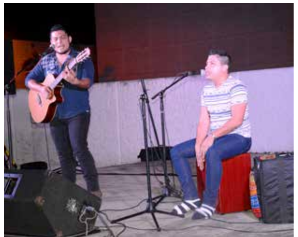
Acoustic Sound integrado por estudiantes del CEDA.