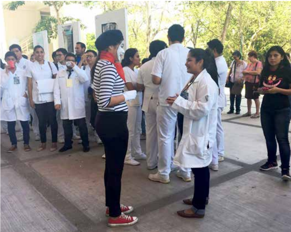
In the last school year, approximately 62 suicide risks were addressed.