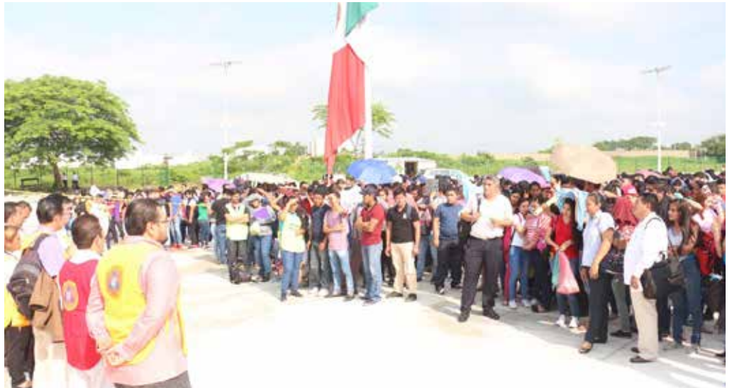
Las brigadas de evacuación, y de búsqueda y rescate participaron en el simulacro.

“Hemos visto en los últimos días una serie de fenómenos que están fuera del alcance de nuestras manos y ante ello, debemos