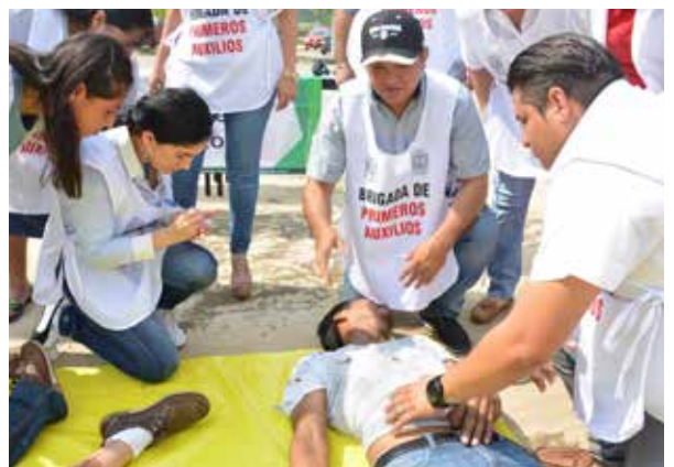
Los heridos fueron atendidos por la brigada de primeros auxilios.