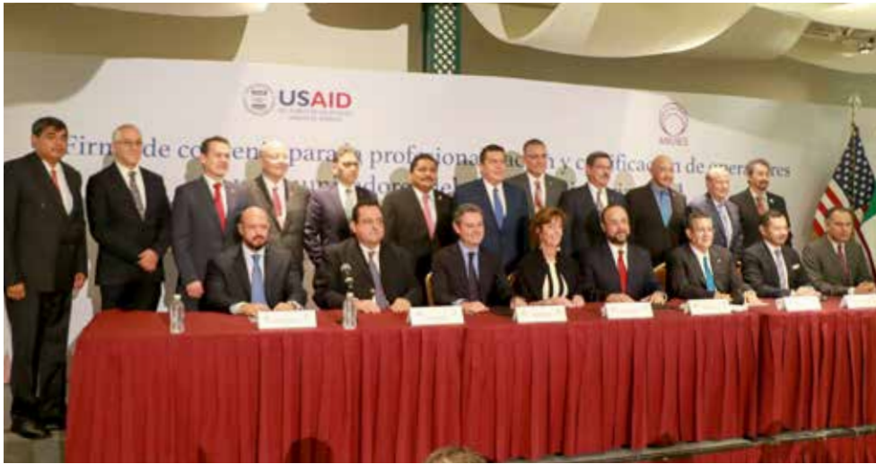
Participan 15 instituciones de educación superior del país, que impartirán 4 diplomados y 3 especialidades.