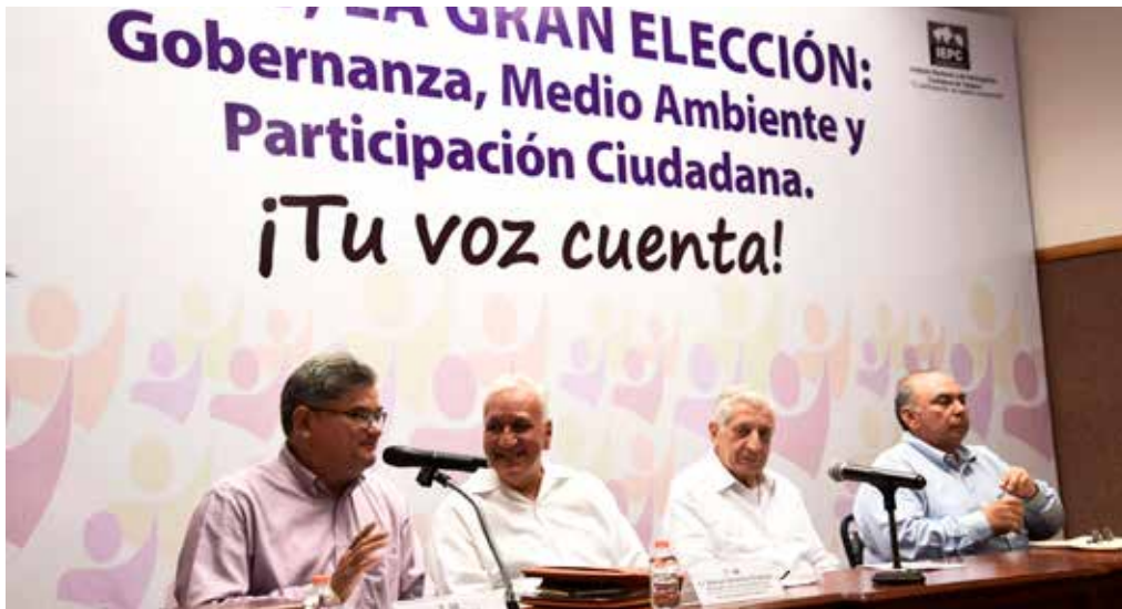
El federalismo en los estados es el único tema que se ha mantenido firme en el debate nacional.