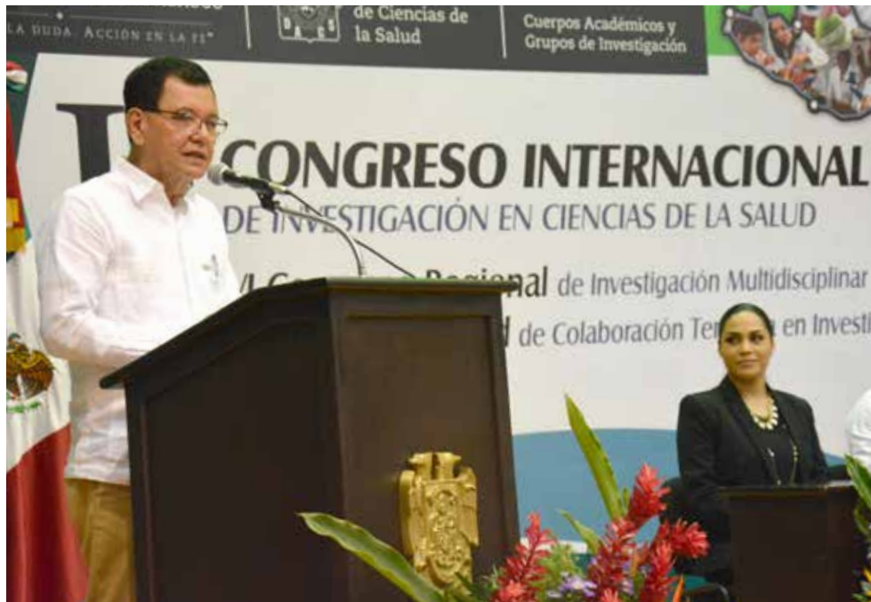
El Congreso representa una ventana de oportunidades mediante la difusión del conocimiento científico.