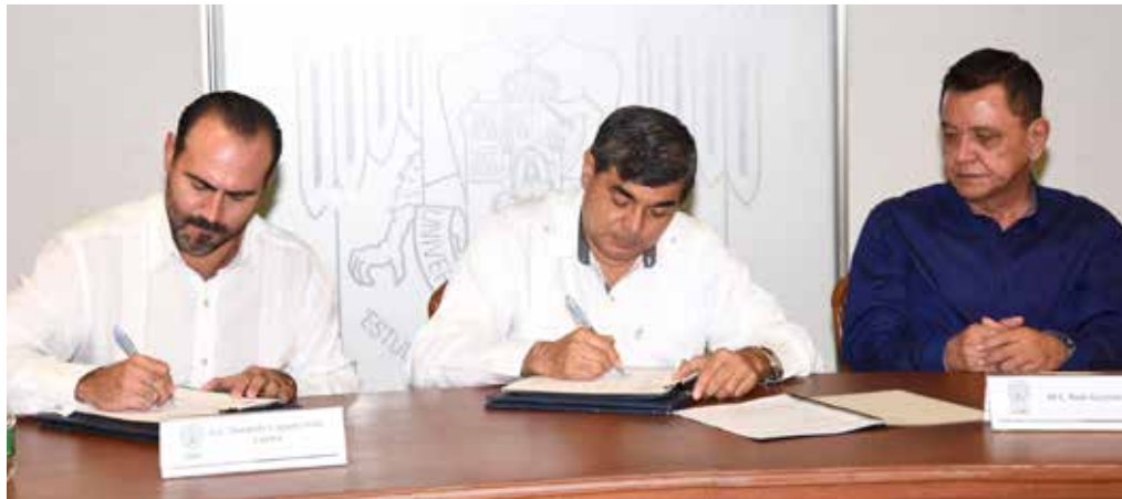
El Rector de la UJAT firmó el acuerdo con el Presidente del Club Campestre Villahermosa.

Se busca la innovación a la par de los programas de calidad en la UJAT.