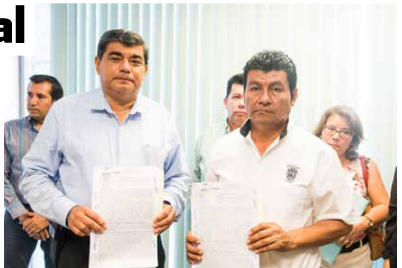
La firma se realizó el 15 de febrero en la Junta de Conciliación y Arbitraje.

Al respecto, el rector de la UJAT y el líder sindical, coincidieron en señalar la importancia de que estos acuerdos hayan