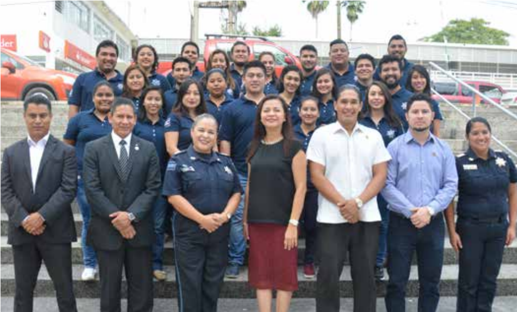
Los jóvenes universitarios participan en diversos esquemas de difusión en la cultura preventiva.