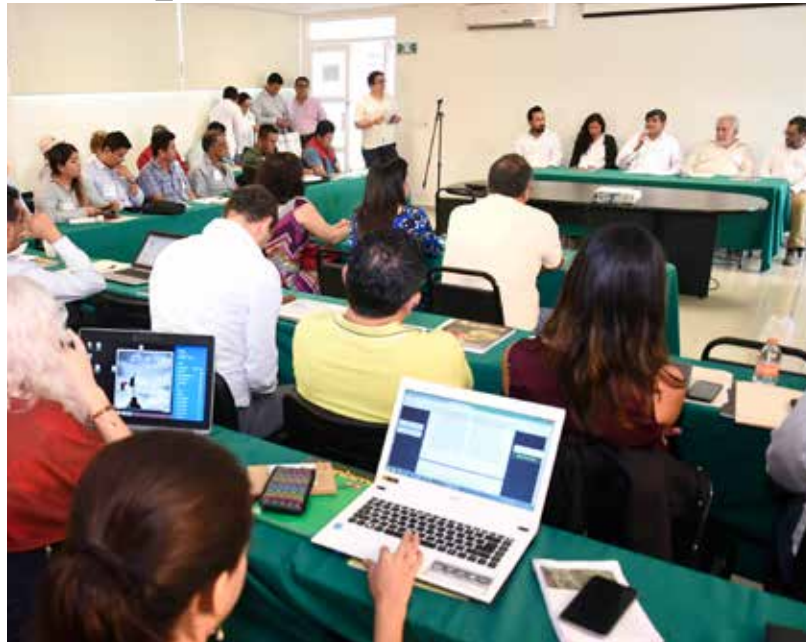
Los especialistas se dieron cita en la Sala de la Laguna, Zona de la Cultura.

En su mensaje, el Rector de la UJAT destacó el trabajo que aca-