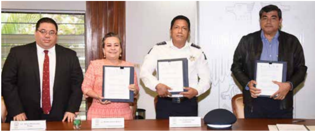
El convenio fue firmado el 11 de diciembre de 2017 en la Sala de Juntas de Rectoría de la UJAT.