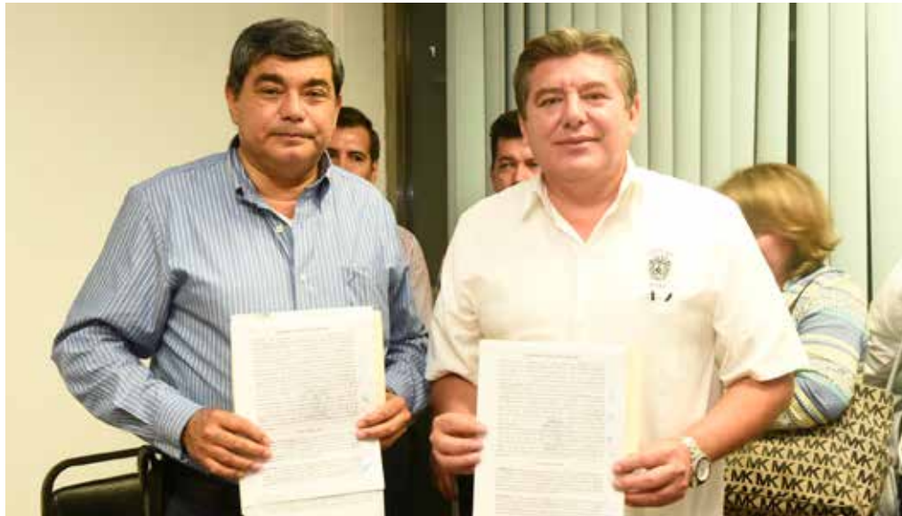
El Rector de la UJAT y el Secretario General del SPIUJAT firman el acuerdo.

» El Sindicato de Profesores e Investigadores de esta Casa de Estudios obtuvo un aumento del 3.4 por ciento directo al salario de los trabajadores.