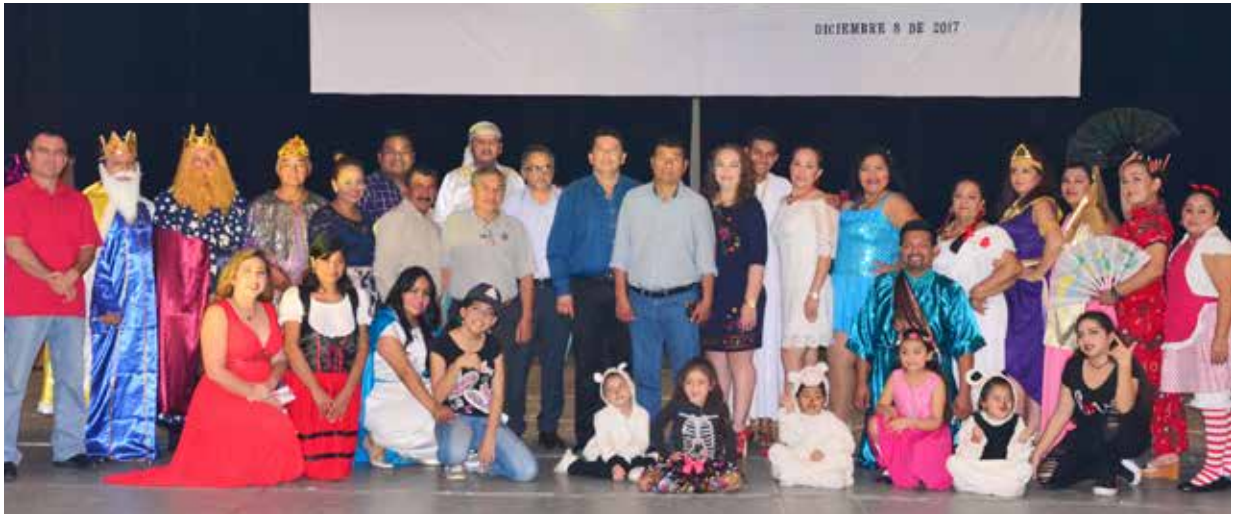
En este marco se presentó la ponencia "El sindicalismo universitario en Tabasco, visión actual".