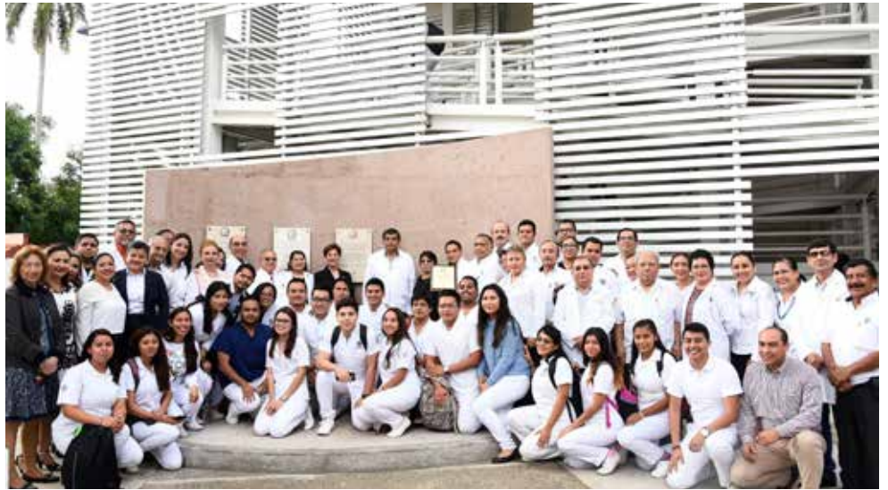
La ceremonia de entrega se realizó el 30 de noviembre en el auditorio "Dr. José Luis Martínez Ruíz".