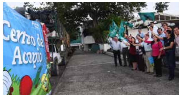
Se impulsaron programas de concientización social y ambiental.