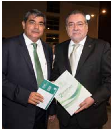
Representante de la ANUIES.