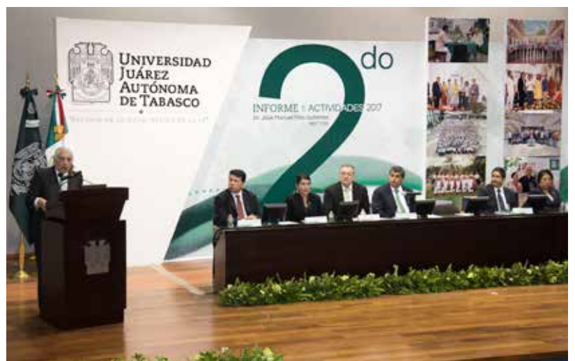
La UJAT avanza en su misión y le cumple plenamente a Tabasco, expresó el Gobernador.