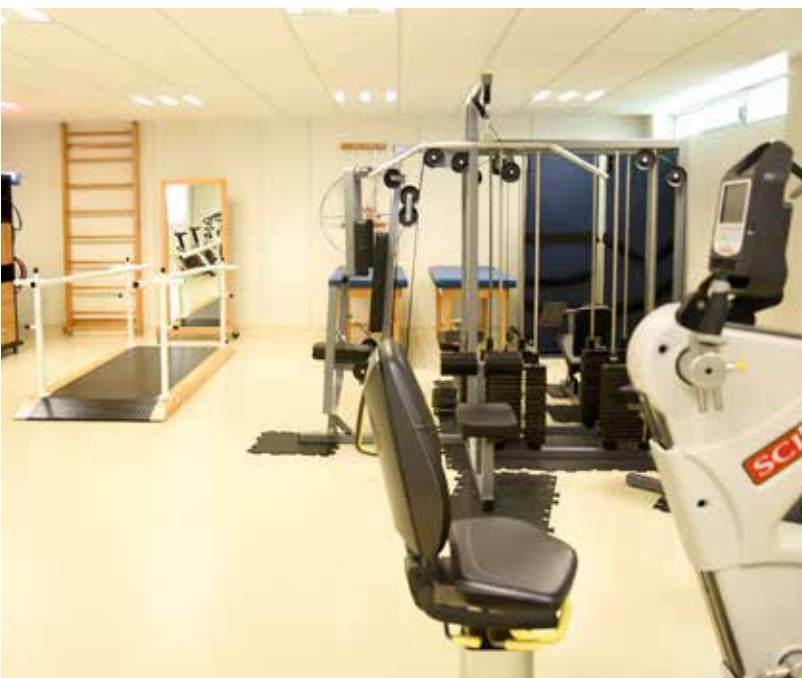
La Universidad enfoca sus esfuerzos en generar una masa crítica que guíe la investigación de alto impacto, que redunde en beneficios hacia la sociedad.