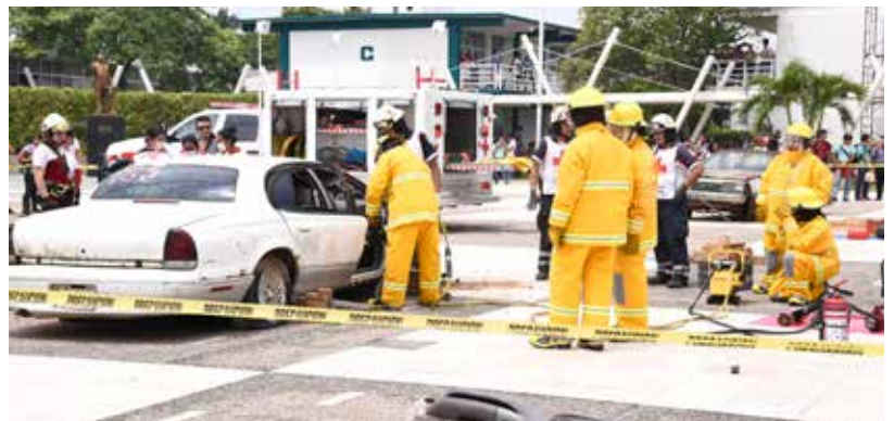
Se arraiga la cultura de la protección civil mediante simulacros de contingencias.