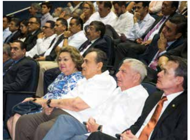
Destacó la presencia de ex rectores de la UJAT.

gramas de estudio y posgrados e hizo un llamado a la comunidad universitaria a seguir apoyando a la UJAT para superar los diversos escenarios por los que atraviesa actualmente y que requieren el apoyo de todos “desde aquí igual extendiendo un saludo por los 60 años de vida universitaria. Esperemos que sean los primeros de muchos de esta institución orgullo de Tabasco”.