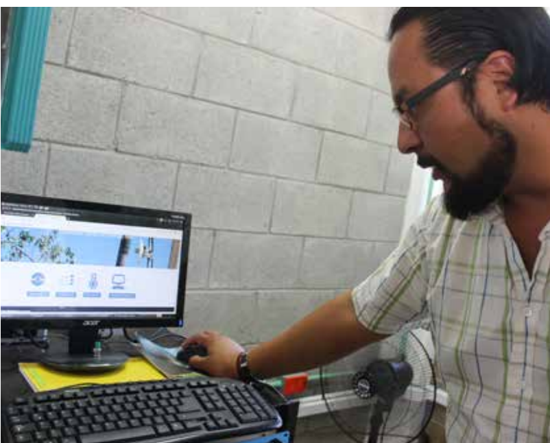
Se impulsó la creación de una red nacional de radio escaterómetros oceanográficos (denominados radares Doppler), para monitorear el Golfo de México.

resultado, el 79 por ciento de los cuerpos académicos están reconocidos por su excelencia de acuerdo con los criterios establecidos por la SEP.