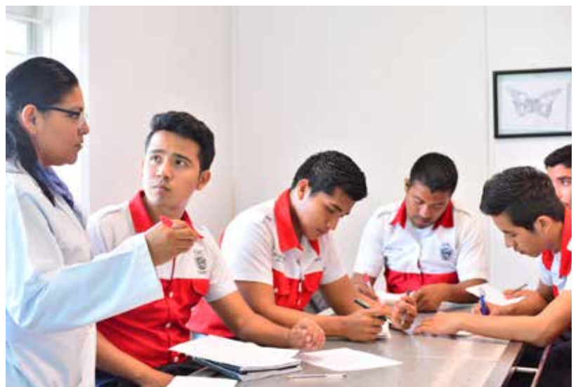
Actividades en la División Académica Multidisciplinaria de Comalcalco.

De igual manera, 13 mentores fueron galardonados con el premio al Mérito Académico, por la excelencia mostrada en el desempeño de sus funciones relativas a la enseñanza, la gestión y divulgación, durante un