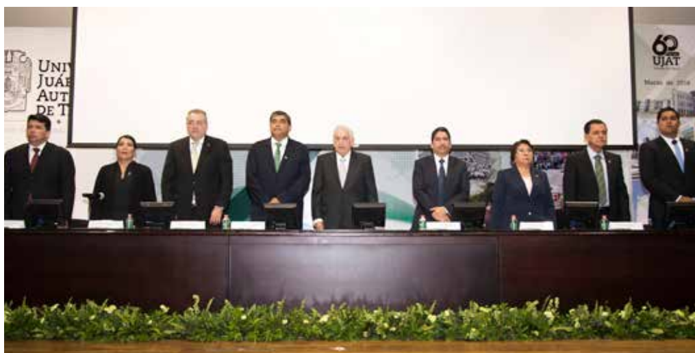
La UJAT ratificó su responsabilidad y compromiso con la transparencia y rendición de cuentas.

Además de las acreditaciones y reacreditaciones logradas ante organismos adscritos al COPAES, también se iniciaron procesos para evaluación de los programas por organismos de prestigio internacional.