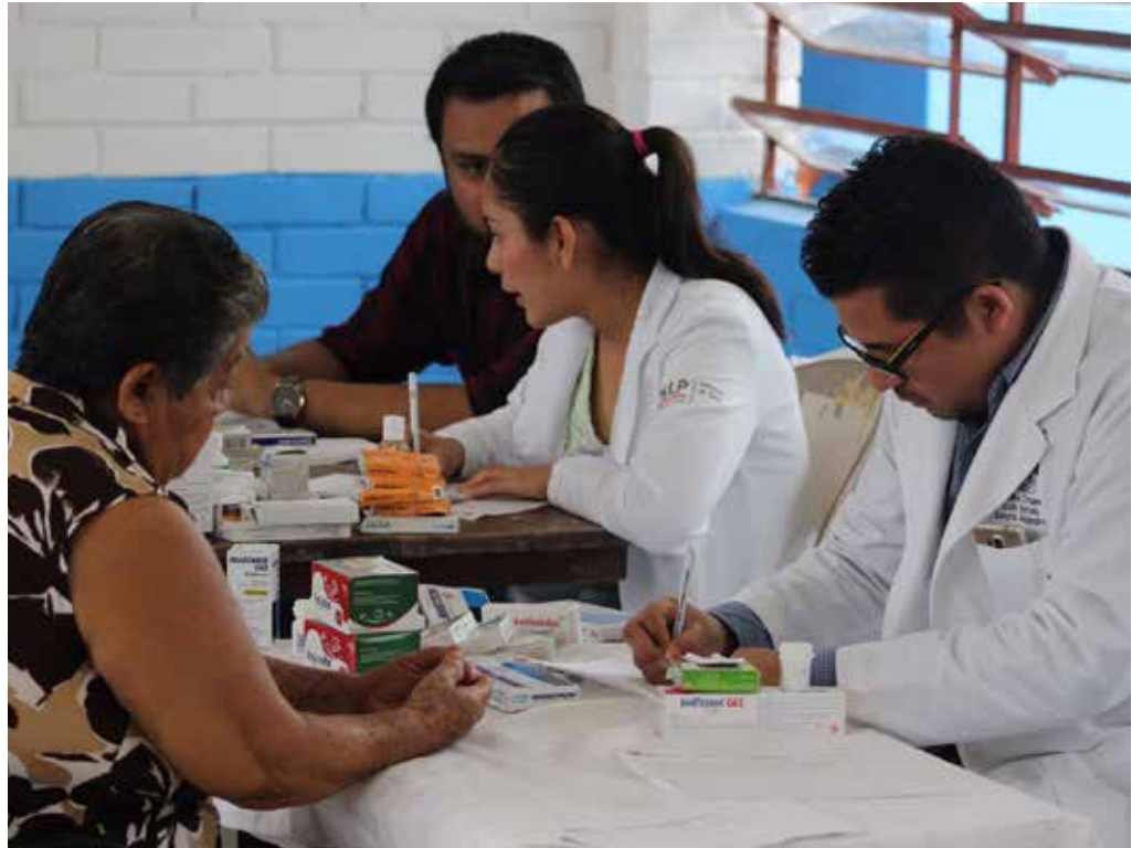
Los estudiantes de ciencias de la salud participan activamente en las estrategias del sector a nivel estatal.

Por lo otro lado, comprometidos con la salud pública, 362 estudiantes del programa educativo de Medicina Veterinaria de la División Académica de Ciencias Agropecuarias en coordinación con la Secretaría de Salud del estado, participaron activamente en la Primera Semana Nacional de Vacunación Canina y Felina del 27 al 31 de marzo del año que se informa, contribuyendo de esta manera a la interrupción de la transmisión del virus rábico en perros y gatos, y con ello, favorecer la condición de ausencia de rabia en estas especies, requisito indispensable en el proceso