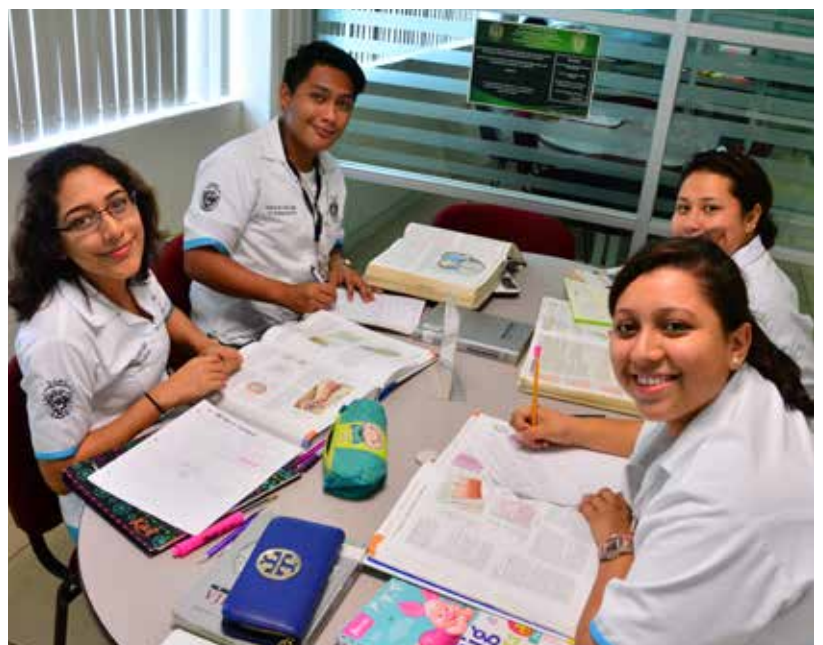
Jóvenes estudiantes de la Licenciatura en Médico Cirujano en la DAMC.