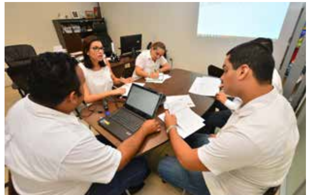
Las redes de colaboración permiten incrementar el conocimiento.