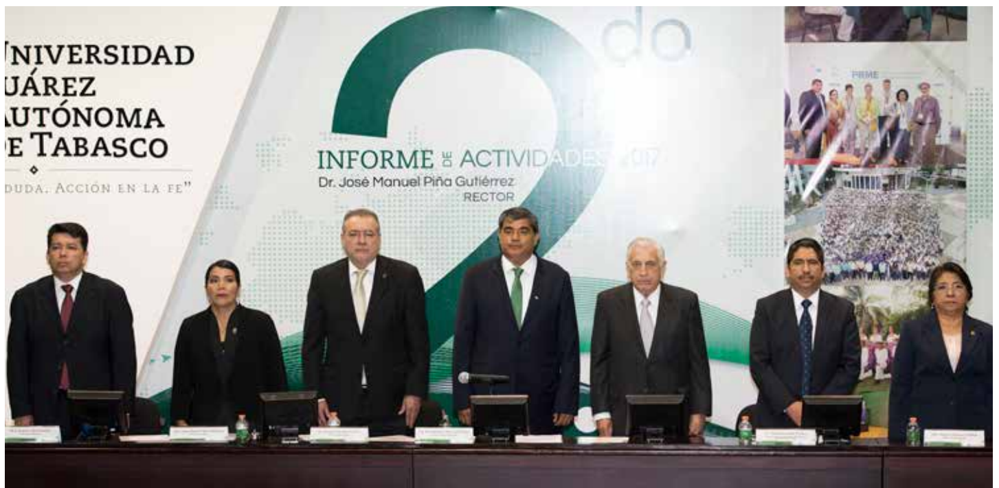
La Sesión del H. Consejo Universitario se realizó el 21 de marzo, en el auditorio "Lic. Eduardo Alday Hernández".