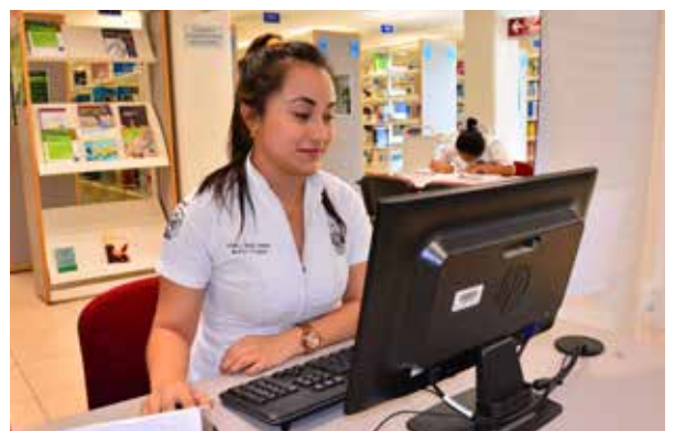
El apoyo con becas es fundamental para concluir sus estudios.

Es sabido que los países que más invierten en ciencia y tecnología son los que ofrecen una mejor calidad de vida a sus habitantes; por esa razón esta Casa de Estudios trabajó arduamente para que más jóvenes tuvieran una experiencia científica de gran valía para su formación profesional. En 2017, se apoyó a 1,170 alumnos que participaron en el XIII Verano de la Investigación Científica, asistiendo a instituciones nacionales y extranjeras donde han desarrollado proyectos que son pertinentes a su formación profesional y a las necesidades del entorno en el que se desenvolverán cuando egresen, incorporándose de manera exitosa en el mercado laboral.