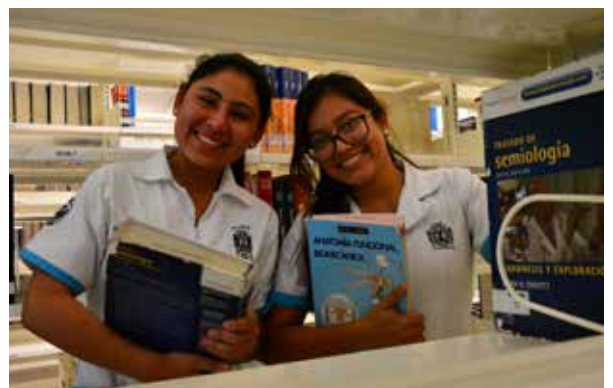
Los jóvenes participan en programas de movilidad estudiantil.