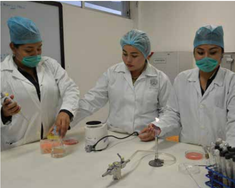
El 79 por ciento de los cuerpos académicos están reconocidos por su excelencia de acuerdo con los criterios establecidos por la Secretaría de Educación Pública.