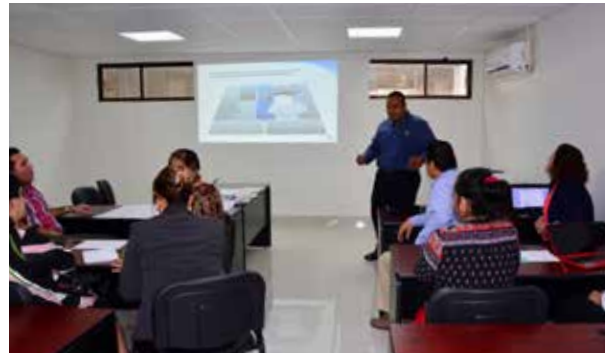
Centro Universitario de Negocios, en la DACEA.

En su calidad de formador de líderes actuales y futuros, la UJAT contribuye al desarrollo responsable de la sociedad, incluyendo en su quehacer la Agenda 2030 para el desarrollo sostenible y los 10 Principios del Pacto Mundial, implementados por la ONU.