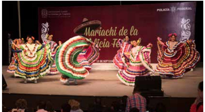
El Ballet Folklórico Universitario recibió diversas distinciones por su profesionalismo.

La Máxima Casa de Estudios recibió en sus instalaciones y participó en las Mesas de Diálogo para una Cultura Cívica, organizadas por el Instituto Nacional Electoral y el Instituto Electoral