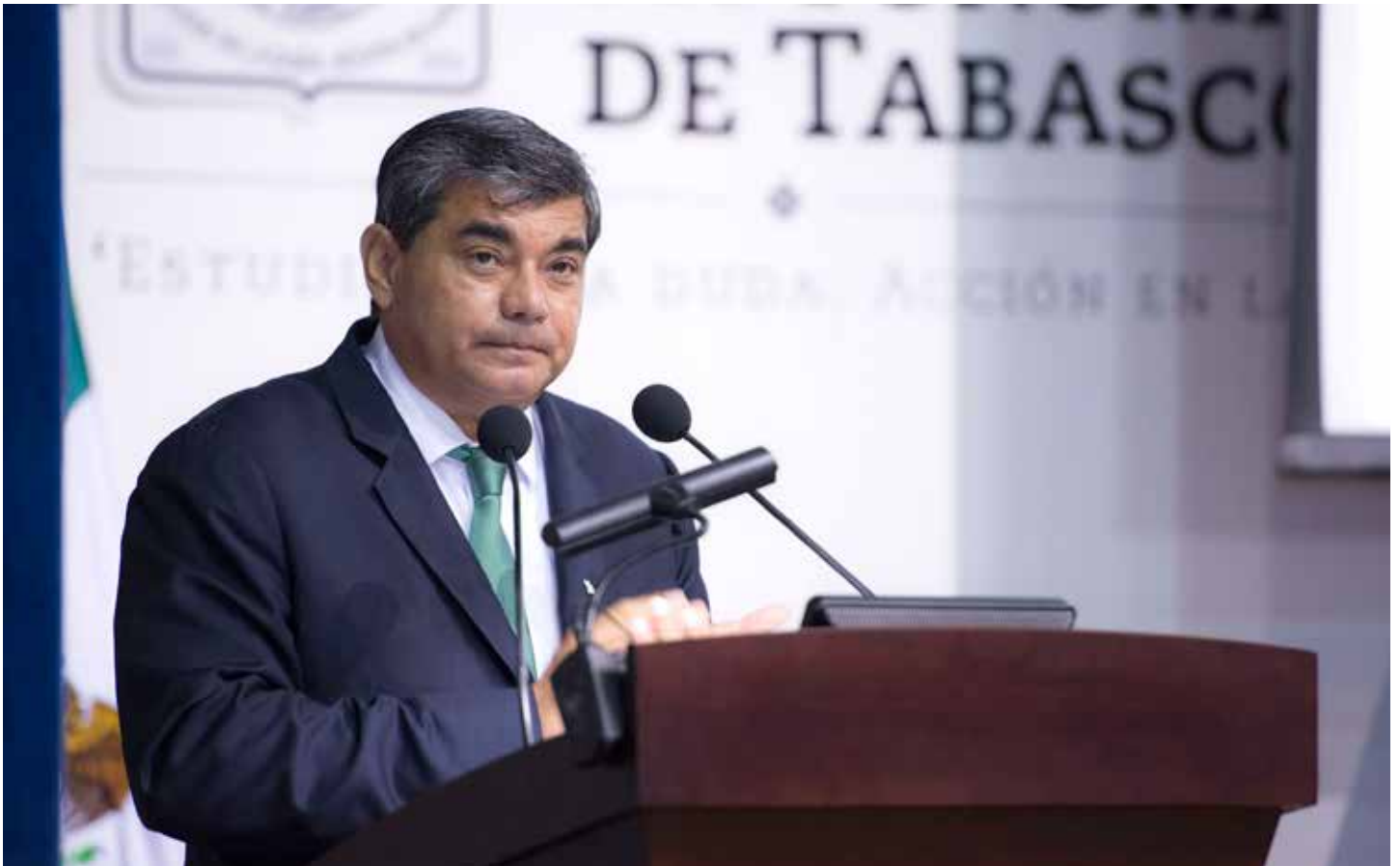
Actualmente 43 posgrados se encuentran incorporados en el Programa Nacional de Posgrados de Calidad del Conacyt, indicó el rector.