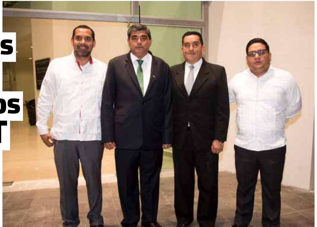
Cónsules y representantes de instituciones de los países centroamericanos.

Por su parte, el ex rector Fernando Rabelo Ruíz de la Peña, destacó el crecimiento de la institución en materia de nuevos pro-