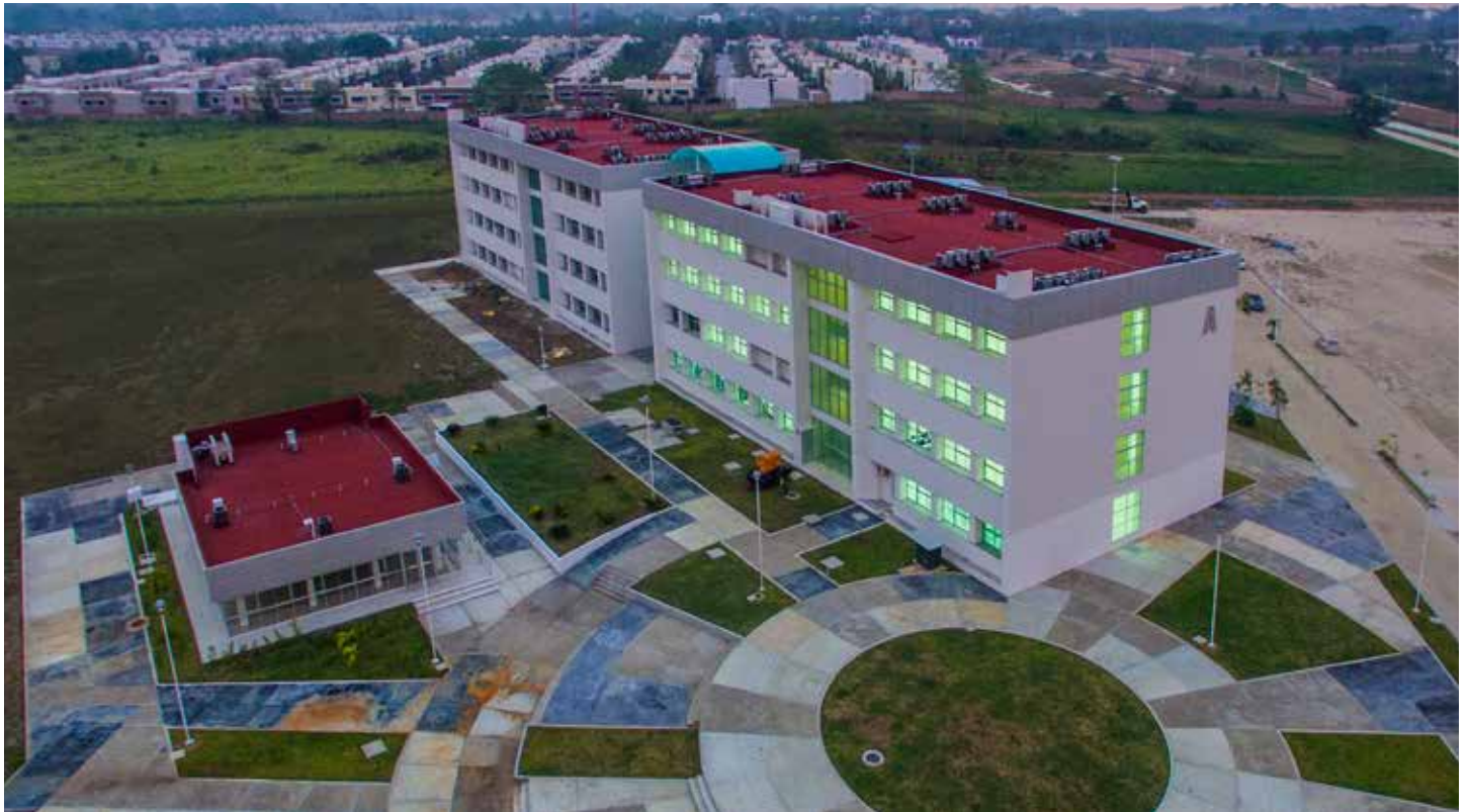
La Ciudad Universitaria del Conocimiento es un símbolo del continuo desarrollo y de la visión de crecimiento académico de la UJAT.