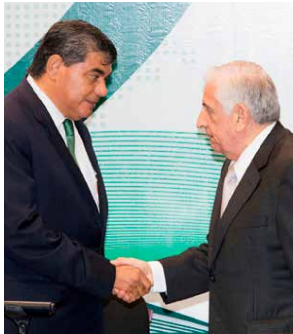
El Gobernador se congratuló con los logros.