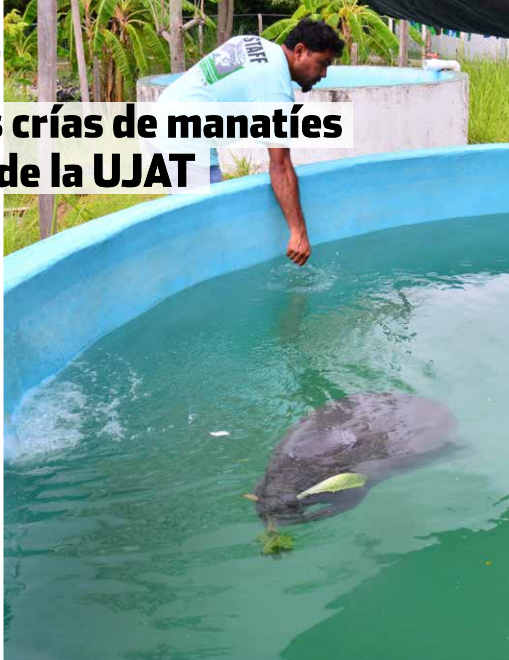
En la DACBiol reciben un cuidado especial con miras a reintegrarlos en el futuro a su hábitat.

Cabe señalar que junto con un ejemplar macho rescatado el 4 de julio y una hembra capturada el 29 de julio, ésta última como parte del Plan de Rescate y Res-