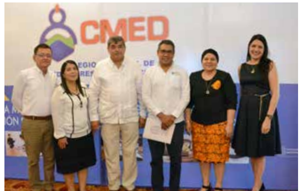
El Foro hizo énfasis en la comunidad empresarial.