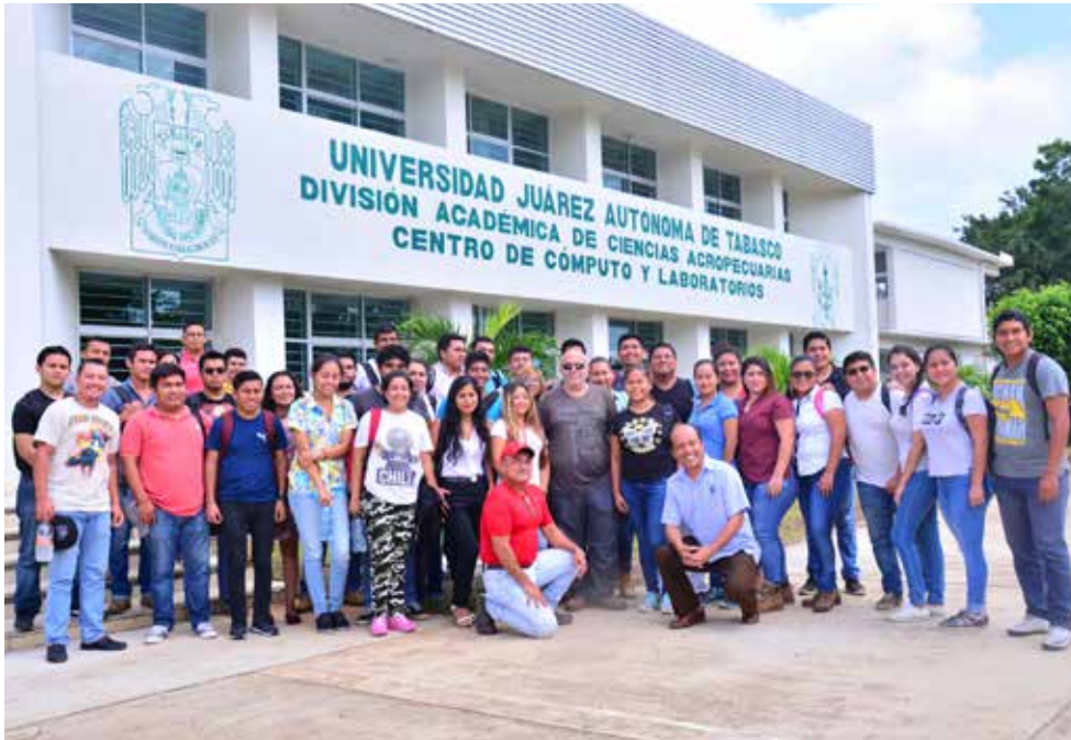
Tabasco tiene un clima parecido a Israel, por lo que las técnicas que se utilizan pueden ser compartidas.