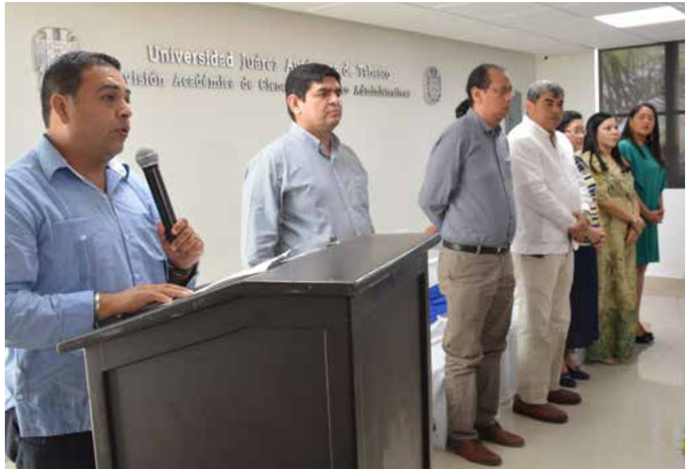
El objetivo es fortalecer organismos que se distinguen por atender problemas emergentes.