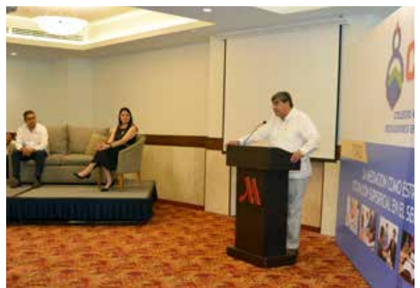
El Rector convocó a fortalecer los programas educativos.