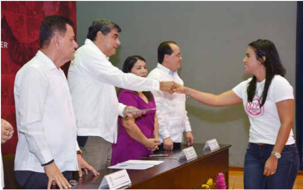
Algunas estancias se realizarán en el Centro de Investigaciones Regionales 'Dr. Hideyo Noguchi'.