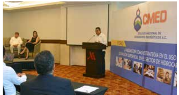
La UJAT cuenta con programas de formación especializados.