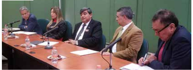
El acuerdo se firmó el 11 de julio en la sede del IMP.

Durante la firma del acuerdo efectuado el 11 de julio en la sede del IMP, el rector de la UJAT subrayó la valía del capital humano con que cuenta este organismo, “una de las cosas que aprendí cuando fui profesor de maestría es que el IMP es un diamante por la cantidad de master y doctorados que brinda, y estoy