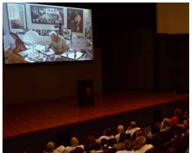
La obra de Enrique González Pedrero sigue siendo un referente.