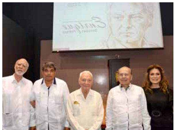
Estuvieron presentes distinguidas personalidades.