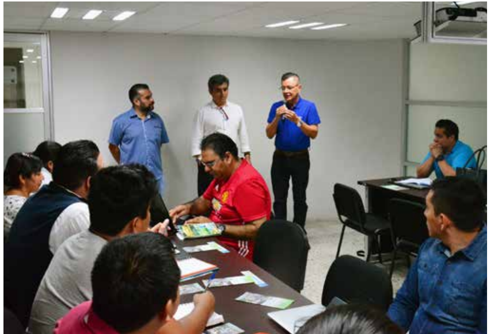
Un total de 36 profesores, personal administrativo y estudiantes participaron en el curso-taller.