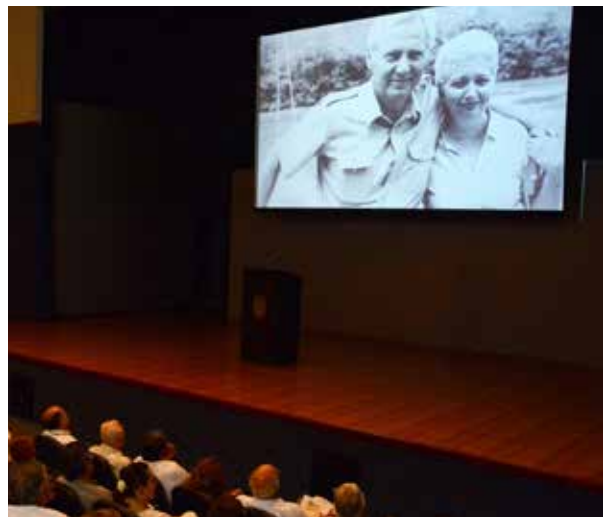
El documental se presentó en el Auditorio del CIVE.

06 años dirigió la Facultad de Ciencias Políticas