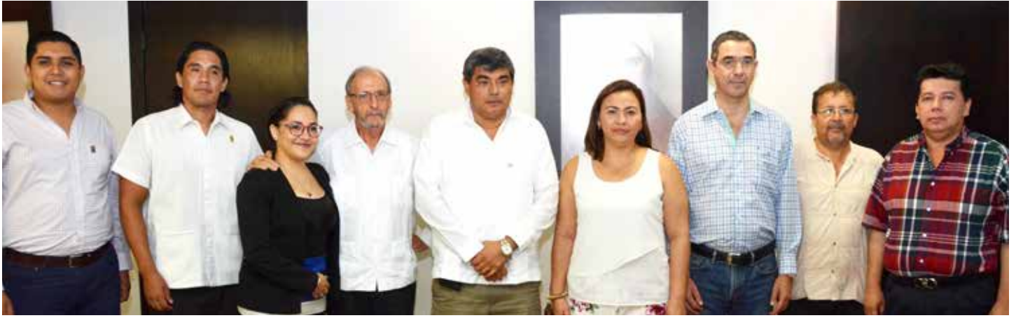
Estos apoyos se sumaron a los recolectados en el centro de acopio de la UJAT, explicó el presidente del CDEUT.