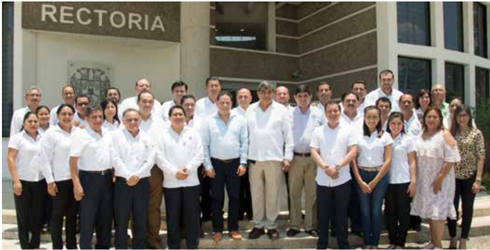
La ceremonia se realizó el 30 de mayo en la Sala de Juntas de Rectoría.