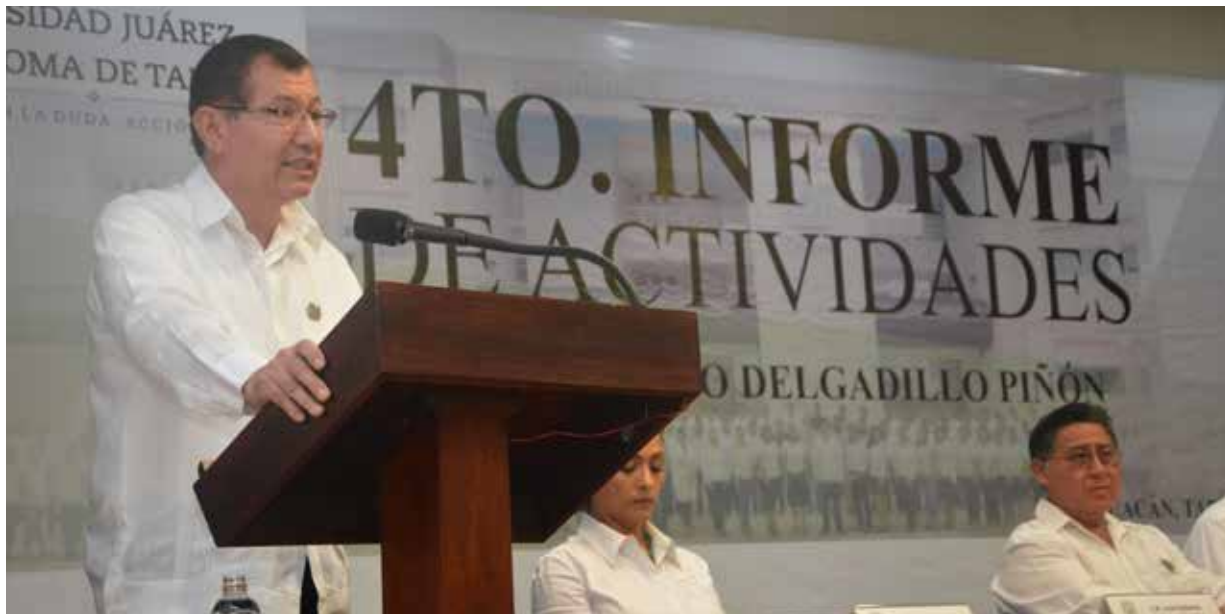
La Especialidad en Ingeniería en Sistemas Offshore, es un programa pionero en colaboración con la UFRJ.