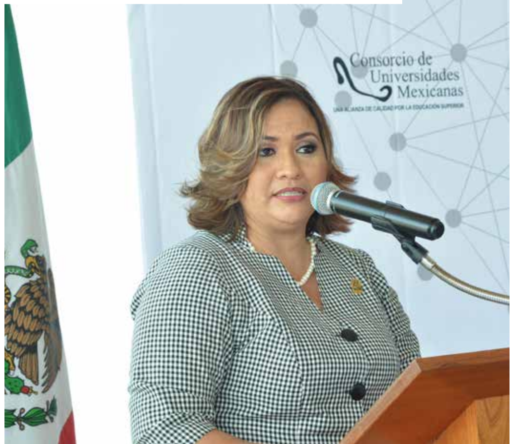
El Informe de Actividades 2017-2018 se realizó el 16 de agosto, en el Centro de Convenciones de Tenosique.