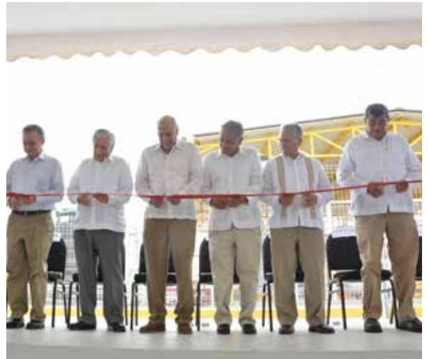
El evento se realizó el 30 de agosto en Cunduacán.

La Reforma Energética del Gobierno mexicano impulsó el desarrollo de nuevos procesos productivos y modelos de negocio, que utilizan la investigación aplicada y dan un particular énfasis a las energías limpias. De 2012 a la fecha, la Secretaría de Energía (SENER) y el Consejo Nacional de Ciencia y Tecnología (Conacyt) destinaron alrededor de 25 mil millones de pesos para investi-