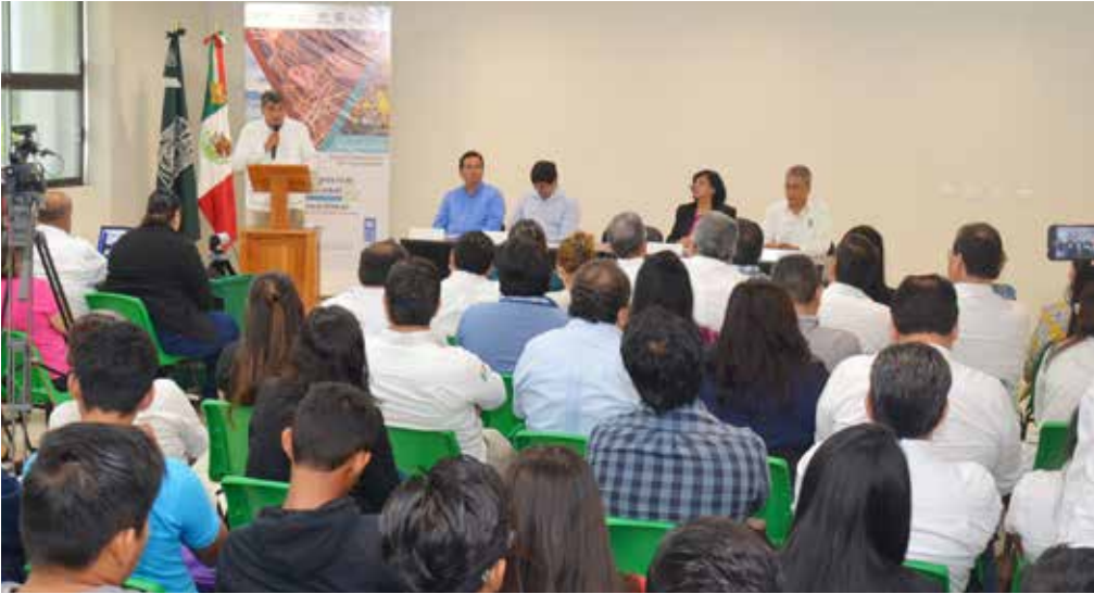
La sede este Simposium fue el campus Ciudad Universitaria del Conocimiento.