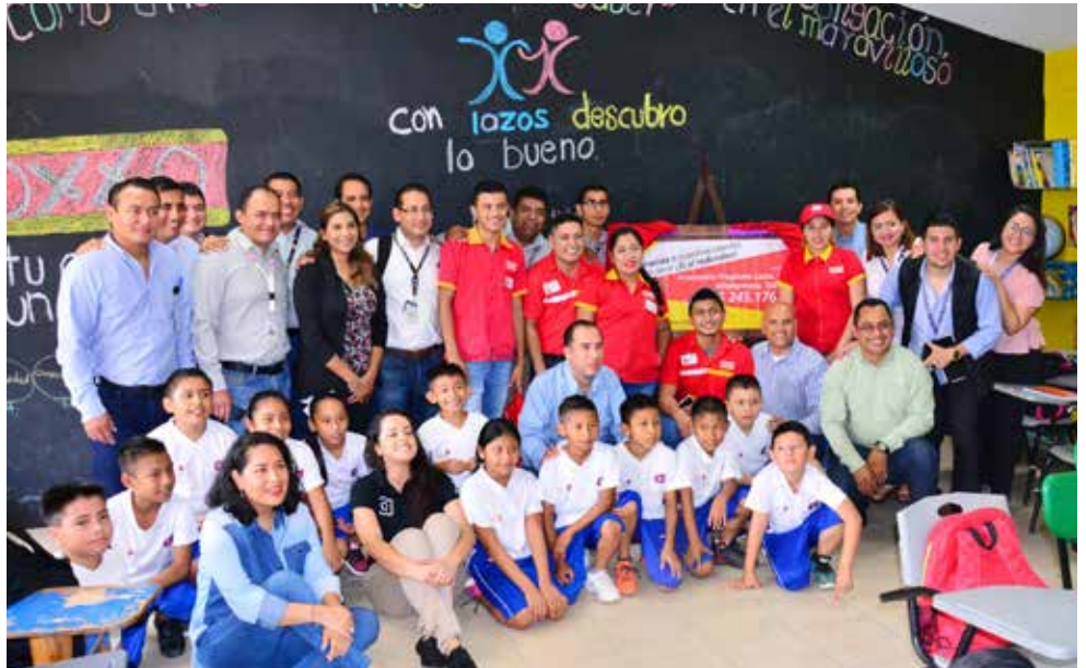
El acto se realizó en la escuela primaria “Josefa Ortíz de Domínguez” del Poblado Guaytalpa, Nacajuca.

Por su parte, el rector de la UJAT subrayó que el objetivo es intercambiar experiencias en áreas de interés común, que fortalezcan al sector docente y la investigación, y con ello propiciar el crecimiento económico de Tabasco.