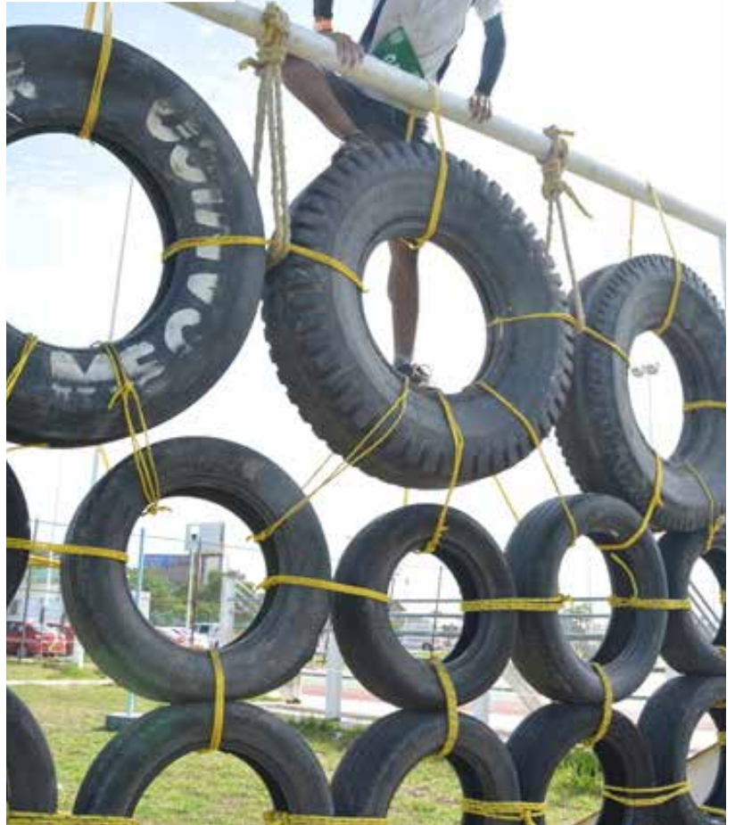
La sede de la competencia fue el Centro Deportivo de la UJAT.

De igual forma, el Rector de la UJAT reiteró el compromiso de esta casa estudios para fomentar el deporte y continuar brindando espacios para el sano esparcimiento, así como también destacó el esfuerzo de las personas involucradas en innovar con este evento que pone en práctica el entrenamiento funcional y que