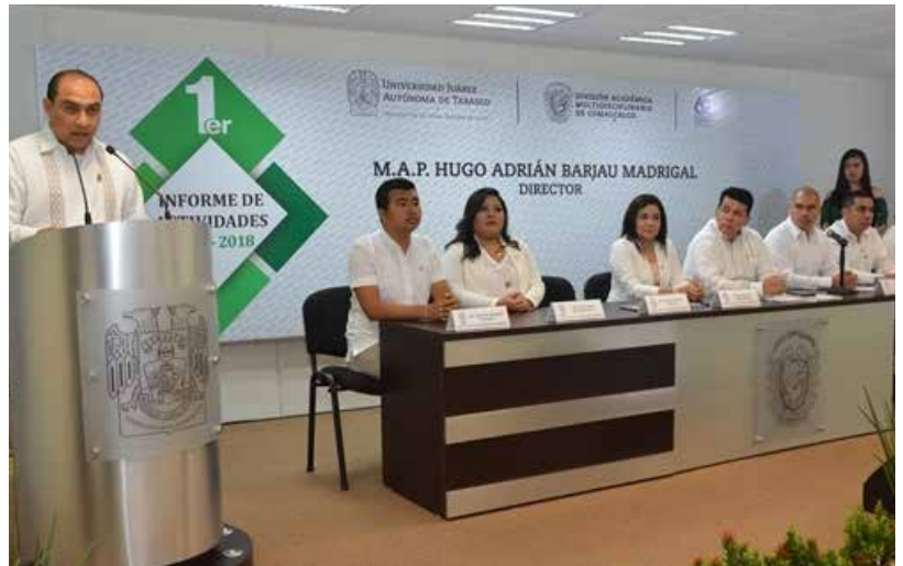
El Informe de Actividades se realizó el 13 de agosto en el Edificio "F" de la DAMC.

Asimismo, el funcionario puntualizó que en materia de calidad educativa, es encomiable el esfuerzo realizado para consolidar los programas educativos que ofrece la DAMC, "así