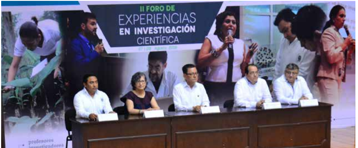
La ceremonia realizada en el Centro Internacional de Vinculación y Enseñanza, contó con la presencia de destacados investigadores.