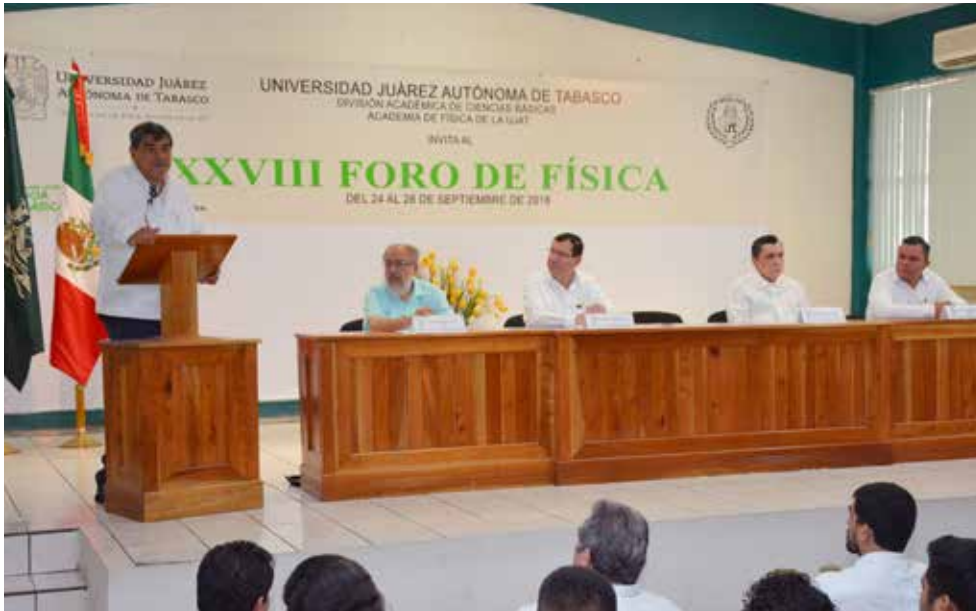
La inauguración fue presidida por el rector de la UJAT, el 24 de septiembre en el Museo de Ciencias.