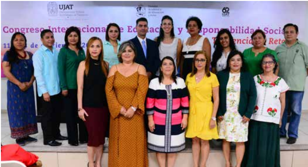
El evento tuvo como sede el auditorio "Dr. Heriberto Olivares Valentines" de la DAEA.