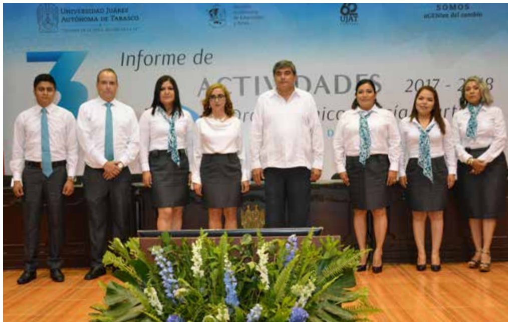
El informe se realizó el 4 de octubre en el auditorio del Centro Internacional de Vinculación y Enseñanza.