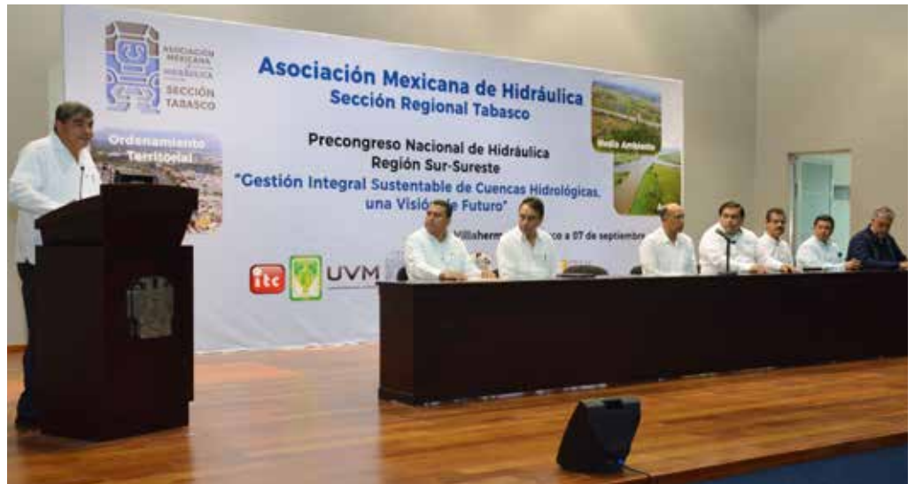
El evento tuvo como sede el auditorio “Lic. Eduardo Alday Hernández” del campus Bicentenario.