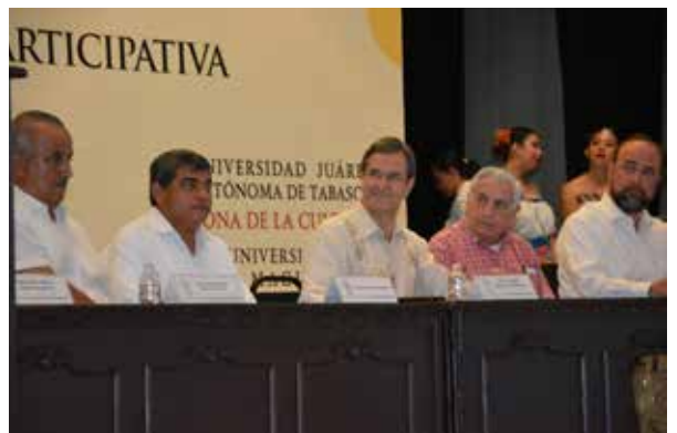
Se contó con la presencia del Gobernador Arturo Núñez Jiménez.

532 ponencias fueron recibidas en el evento