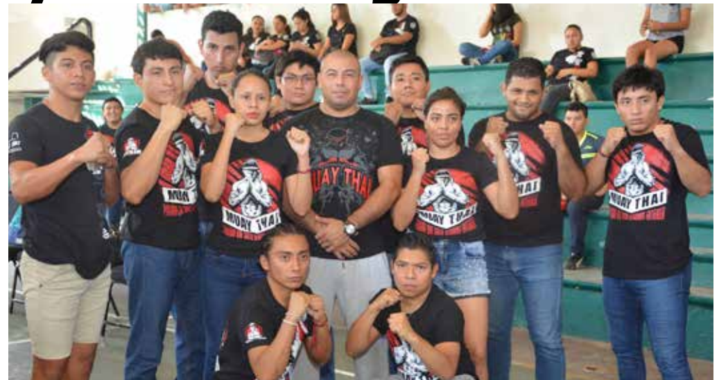
A base de puños y patadas mostraron su fortaleza y los avances logrados tras horas de entrenamiento.

18 combates se desarrollaron en total entre 30 competidores