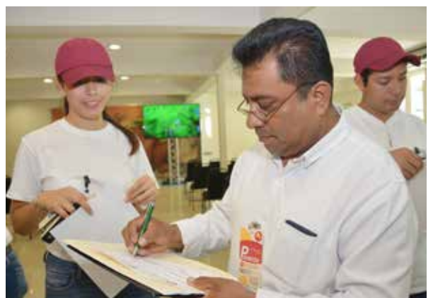
El evento fue organizado con apoyo de la ANUIES.