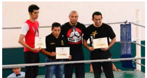
Se entregaron reconocimientos a los promotores deportivos.