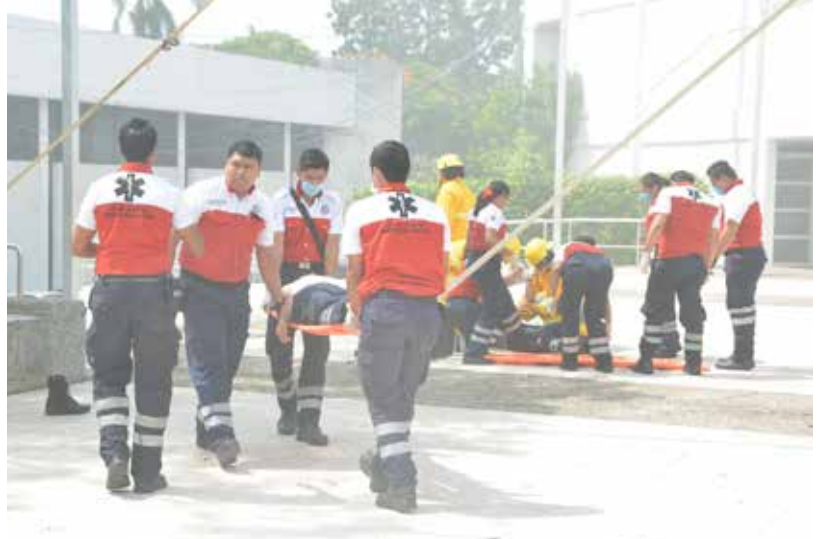
Se realizaron diversos simulacros de evacuación ante contingencias.

la UJAT anunció que, en noviembre próximo, en coordinación con el Colegio Mexicano de Profesionales en Gestión de Riesgos y Protección Civil se realizará el Tercer Congreso Internacional “Territorios más seguros y más humanos ante el riesgo de desastres”, un evento enfocado en el análisis y el intercambio de experiencias sobre temas relacionados con los desastres y la forma de preverlos, reducirlos y afrontarlos.