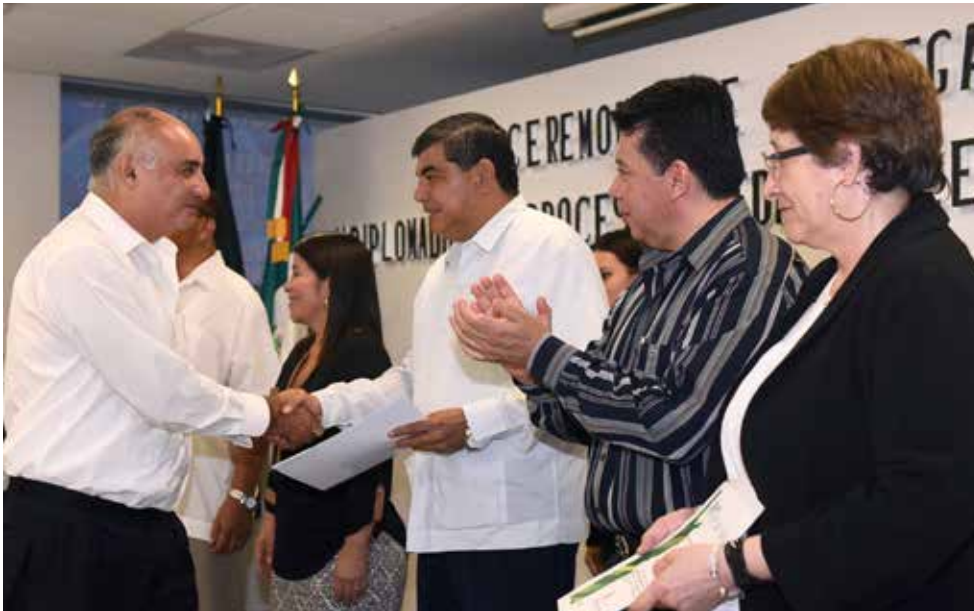
Los programas se convirtieron en evaluables partir de julio de 2018, al egresar la primera generación.