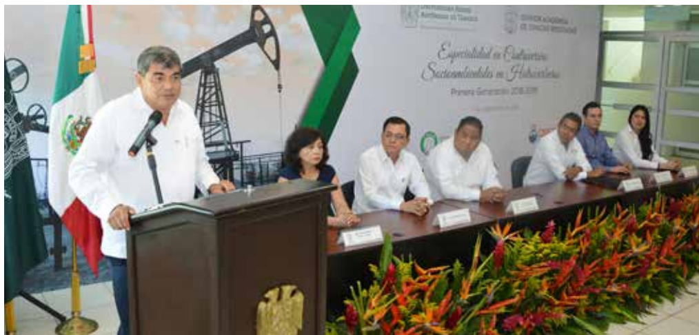
El rector de la UJAT destacó la pertinencia de este programa ante las expectativas en el Sector Energético.

El acto se llevó a cabo el pasado 21 de septiembre.