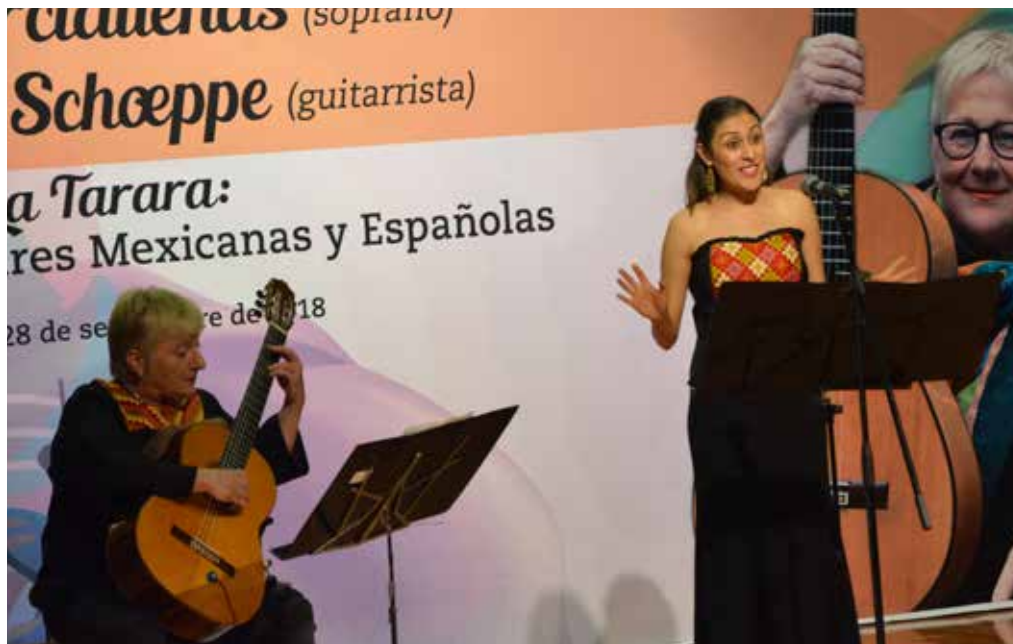
La velada musical se realizó el 28 de septiembre, en el auditorio del CIVE.