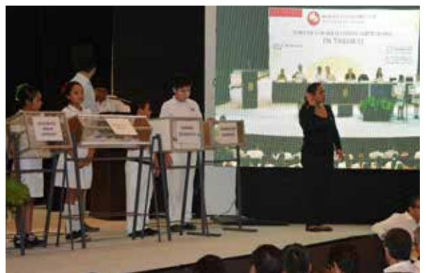
Las temáticas fueron divididas por cada nivel educativo.