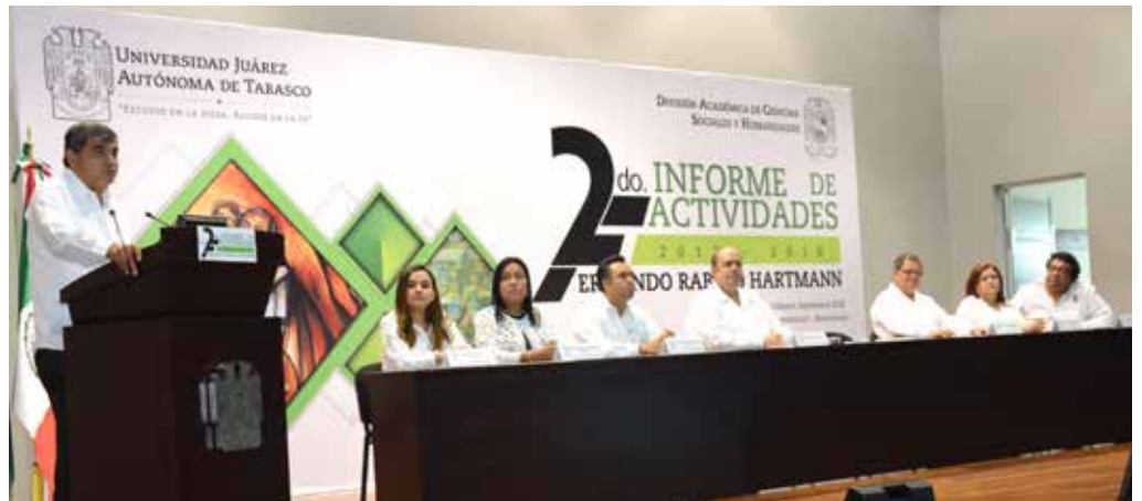
El Rector en su calidad de Presidente Honorario del H. Consejo Divisonal dirigió el mensaje universitario.

Precisó que a fin de fortalecer las Licenciaturas en Historia y Sociología, se dispuso la creación de un Comité Académico de Posgrado, el cual está conformado por profesores investigadores que desarrollan un proyecto para la Maestría en Sociología e Historia, lo que sin duda ayudará a reforzar estos campos del conocimiento;