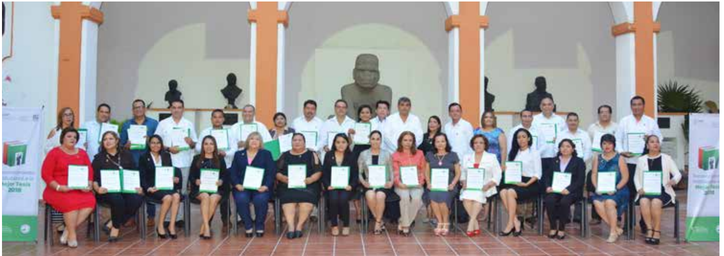
El evento se realizó el pasado 5 de septiembre en el auditorio "Lic. Manuel Sánchez Mármol" del Instituto Juárez.