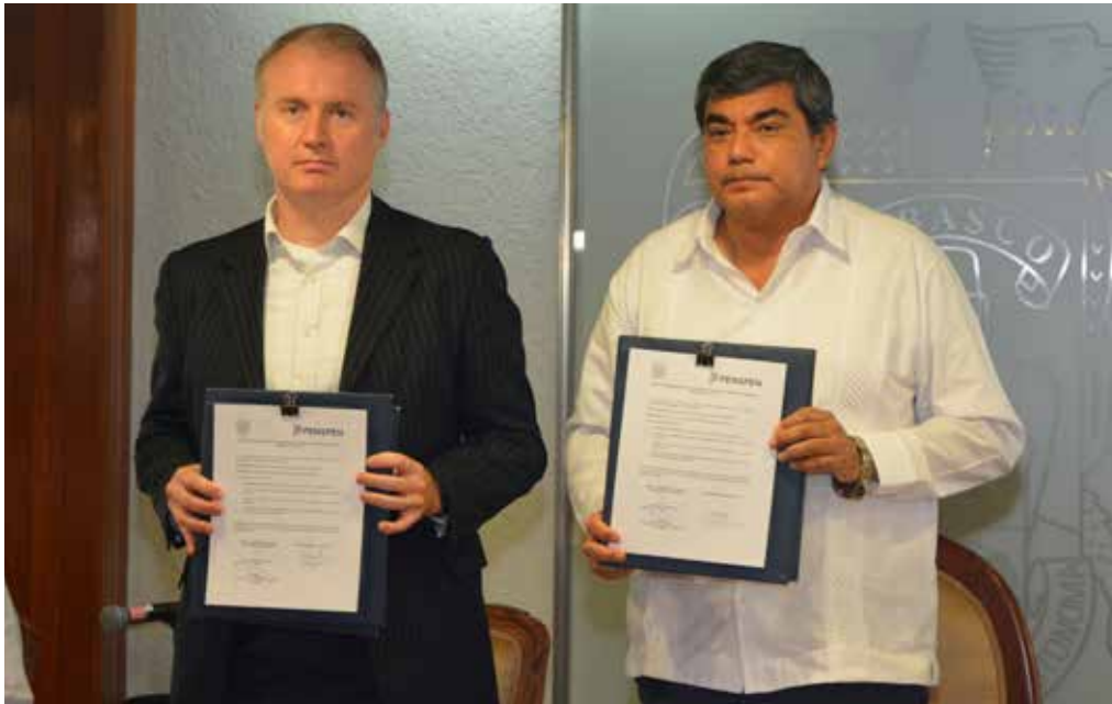
El acuerdo fue firmado en una ceremonia efectuada el 4 de octubre, en la Sala de Juntas de Rectoría.