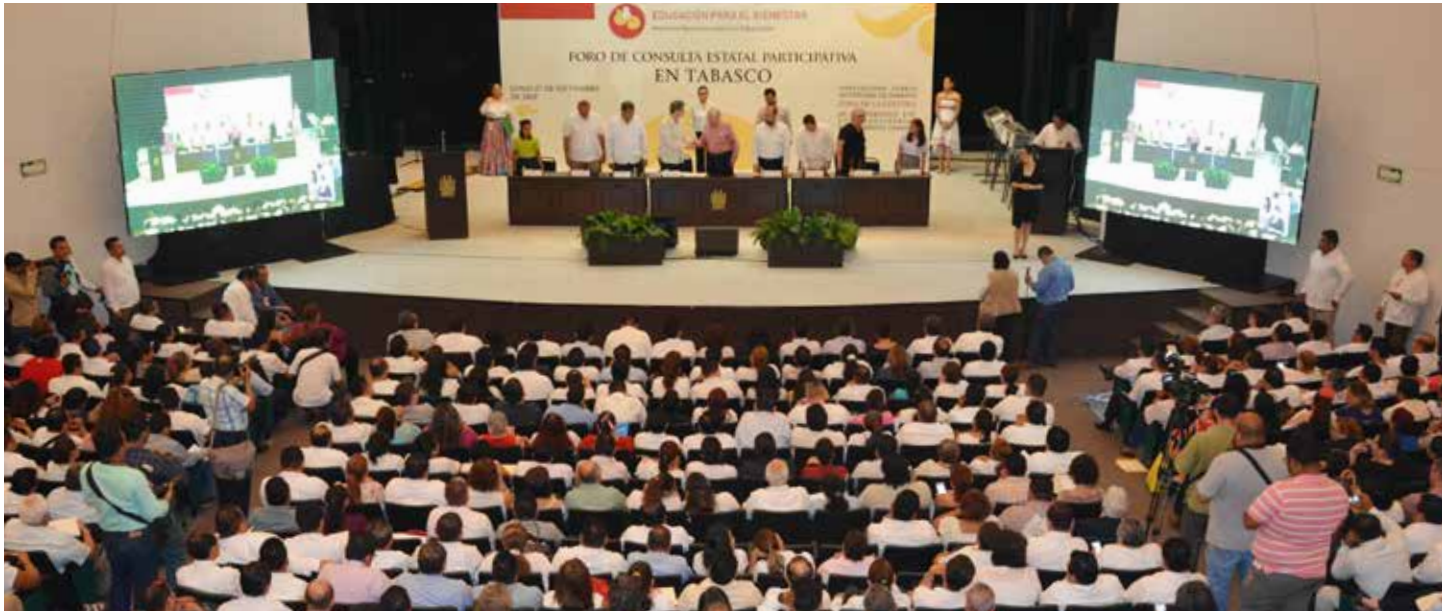
El evento realizado el pasado 17 de septiembre tuvo como sede el Teatro Universitario de la UJAT.