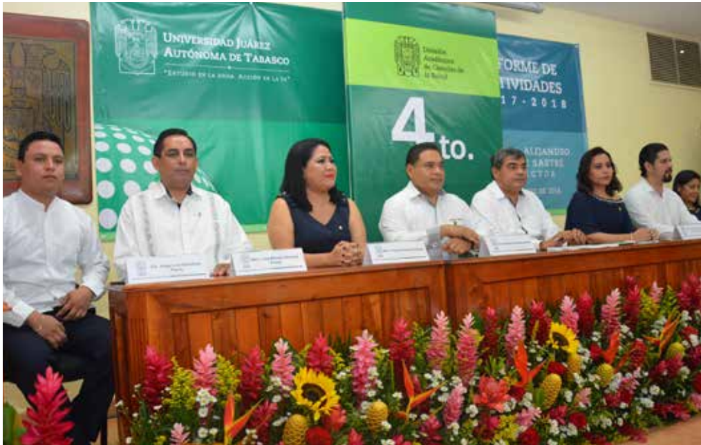
La sesión del H. Consejo Divisional se realizó el 20 de septiembre en el auditorio "Dr. José Luis Martínez Ruíz".