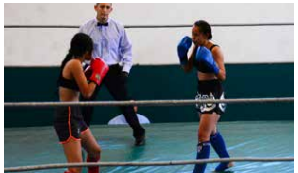
Las peleas mostraron un alto nivel de competencia.

Las escuelas que participaron fueron Training Center Paradise de Paraíso, CDC Bicentenario de Comalcalco, el Club Scorpions de Macuspana y la escuela Muay Thai Fighters RA Club de la UJAT.