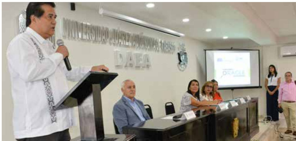
El Secretario de Educación en el Estado, inauguró este espacio que promueve la equidad en la comunidad.