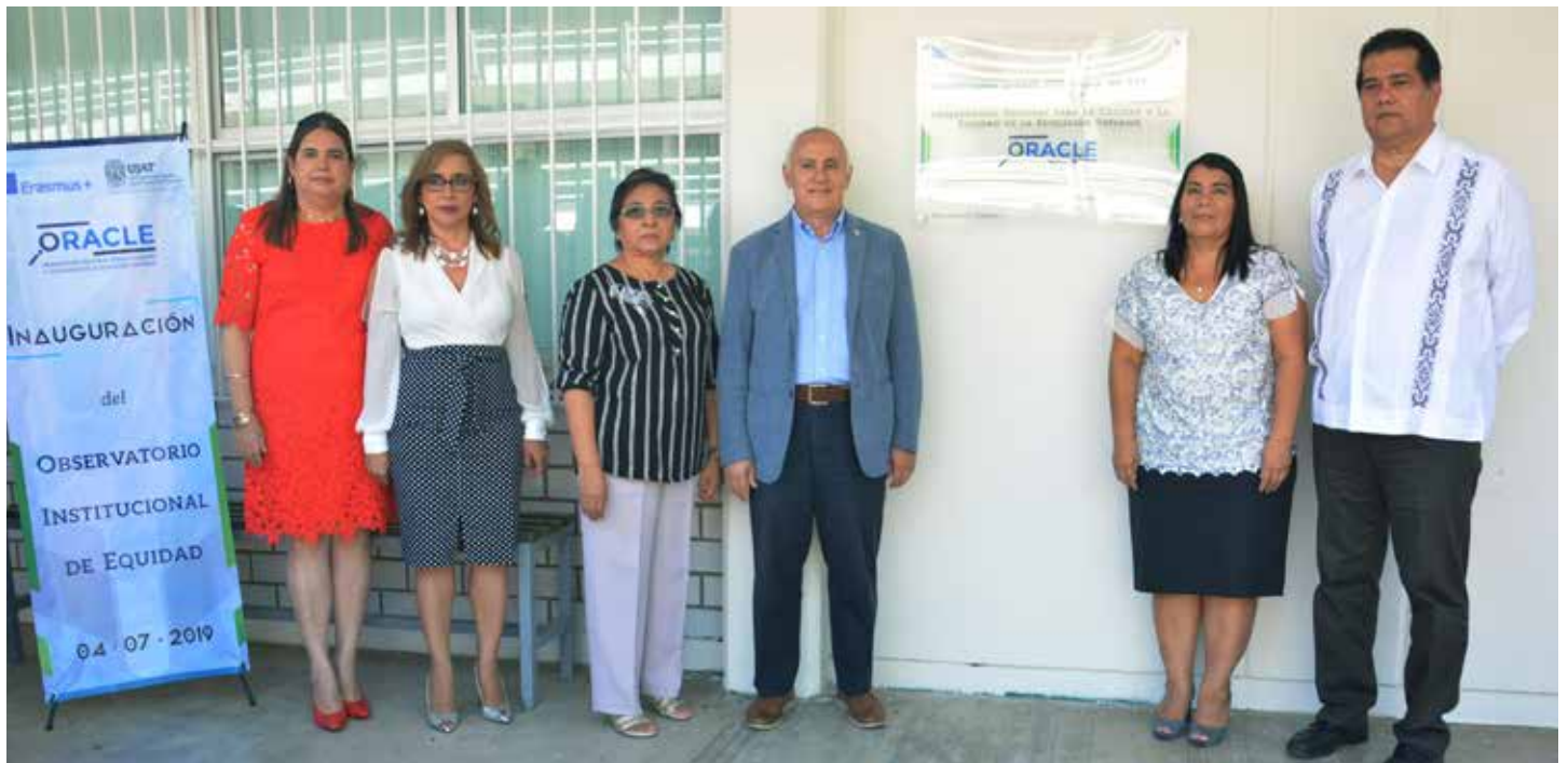
Este observatorio se encuentra en la División Académica de Educación y Artes.