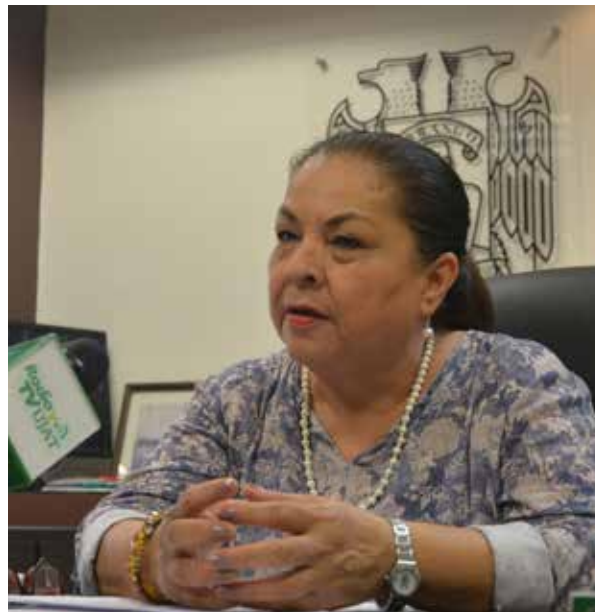
La Directora de la DACCS dio a conocer esta información.

La Directora de la DACCS, recordó que la Licenciatura en Psicología