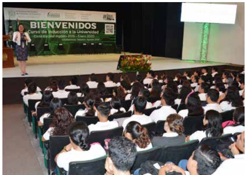
Se impartió una conferencia motivacional que invitó a los jóvenes a esforzarse por sus metas.