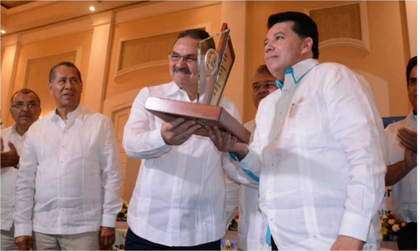
El reconocimiento fue entregado por el Director General de Petróleos Mexicanos, Ing. Octavio Romero Oropeza.