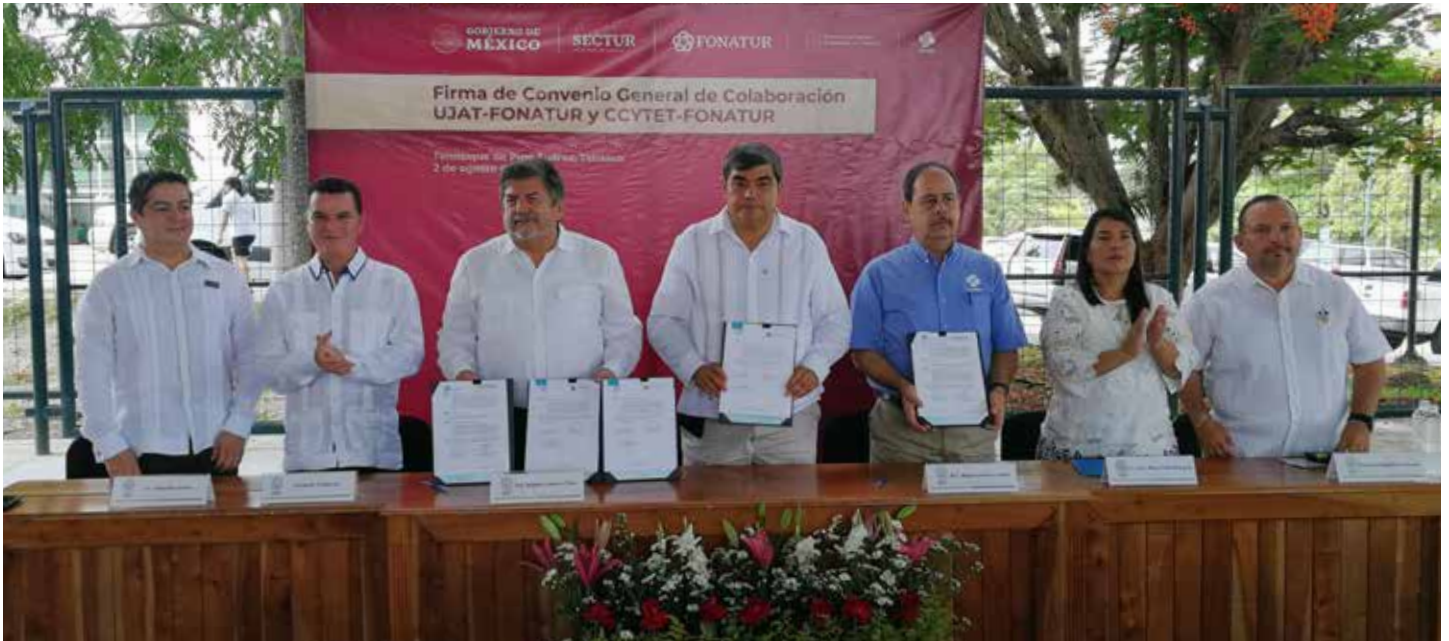
El Rector de la UJAT y el Director General de FONATUR, firmaron este acuerdo para trabajar de manera conjunta.