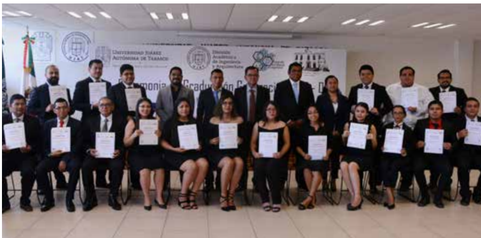
La ceremonia se realizó en la Sala de Usos Múltiples de la DAIA.

Sólo el 1.5% logra concluir un estudio de posgrado