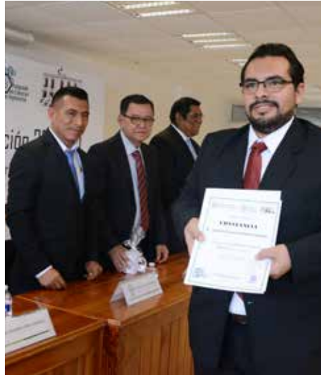
Los egresados recibieron su constancia por parte de las autoridades universitarias