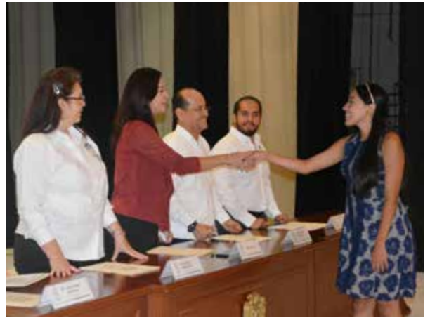
El Teatro Universitario fue la sede donde se realizó la ceremonia.