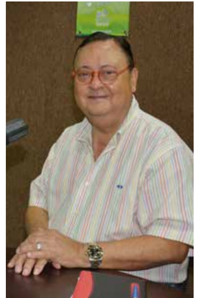
El Jefe de Posgrados de la DACS, informó sobre este programa