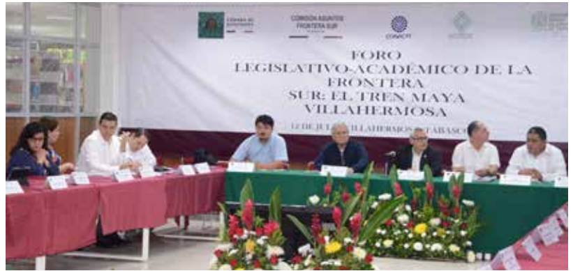
La División Académica de Ciencias Biológicas fue sede de este Foro Legislativo.

Se trata de una obra, dijo, que junto con otras dos grandes iniciativas como el programa Sembrando Vida y la refinería de Dos