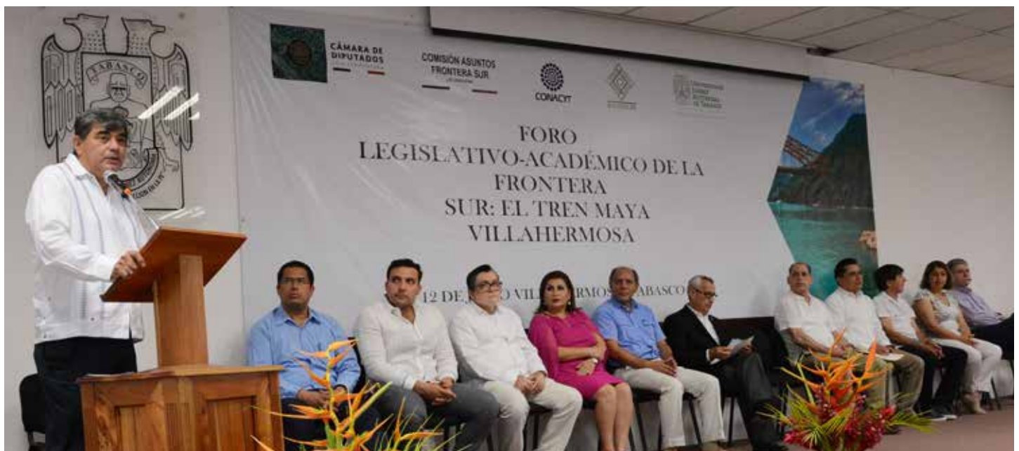
El Rector de la UJAT dio la bienvenida a los académicos, sociedad civil y legisladores que participaron en este Foro.

Posterior a la ceremonia inaugural, los asistentes participaron en tres mesas de trabajo con las temáticas: Perspectivas económicas por la construcción del Tren Maya en el Sureste de México; Tren Maya: Impactos socio-culturales y migratorios y La investigación sobre el impacto al medio ambiente en la construcción del Tren Maya.