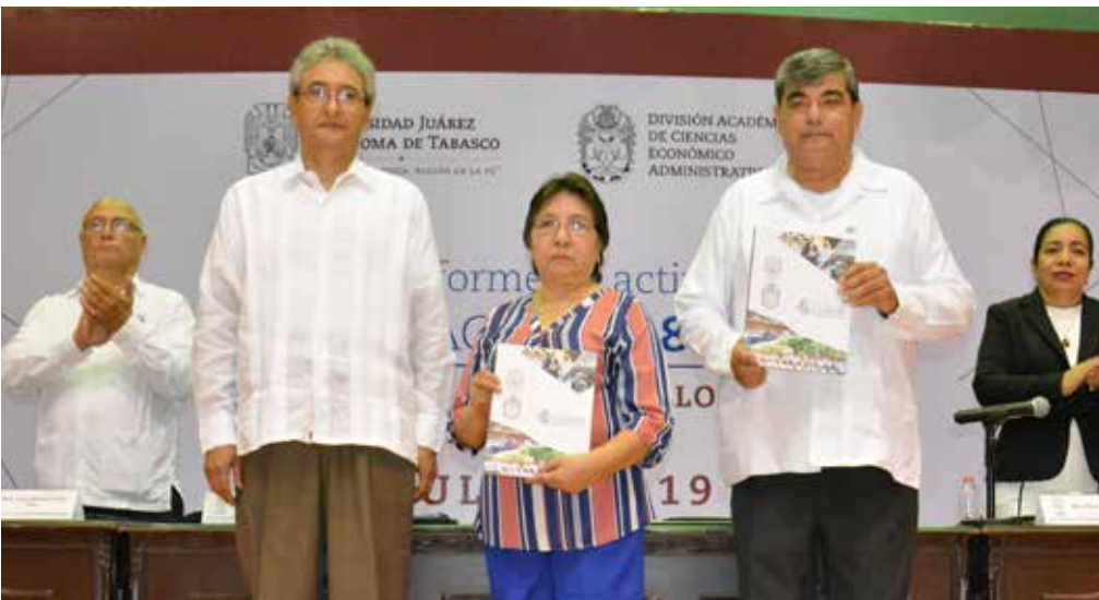
Se entregó a la H. Junta de Gobierno, el documento que integra el 4to Informe de Actividades.

COPAES, mientras que los programas de licenciatura a distancia cuentan con el Reconocimiento Nivel 1 de los CIEES.