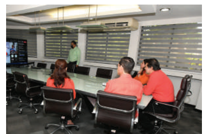
Los participantes se enlazaron a través del Aula Virtual de la UJAT, en Microsoft Teams.