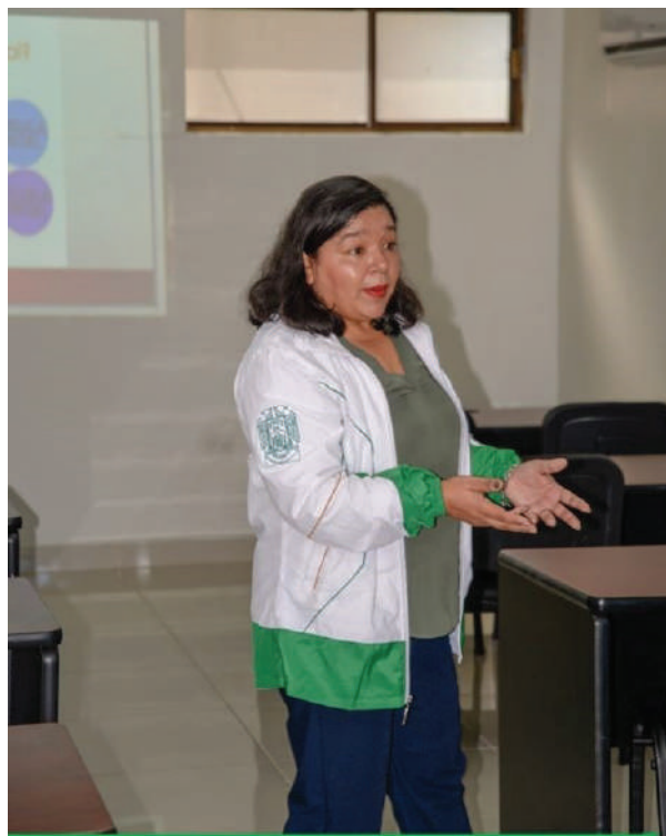
La profesora invitó a sus compañeros a participar en esta labor editorial