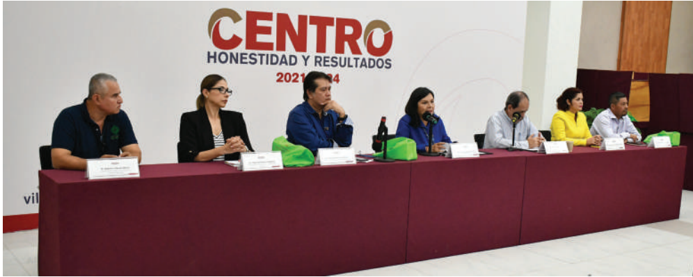
Participan en este programa, destacados profesores de la Universidad.

>> Esta actividad se deriva de la vinculación que mantiene esta Casa de Estudios con la administración municipal.