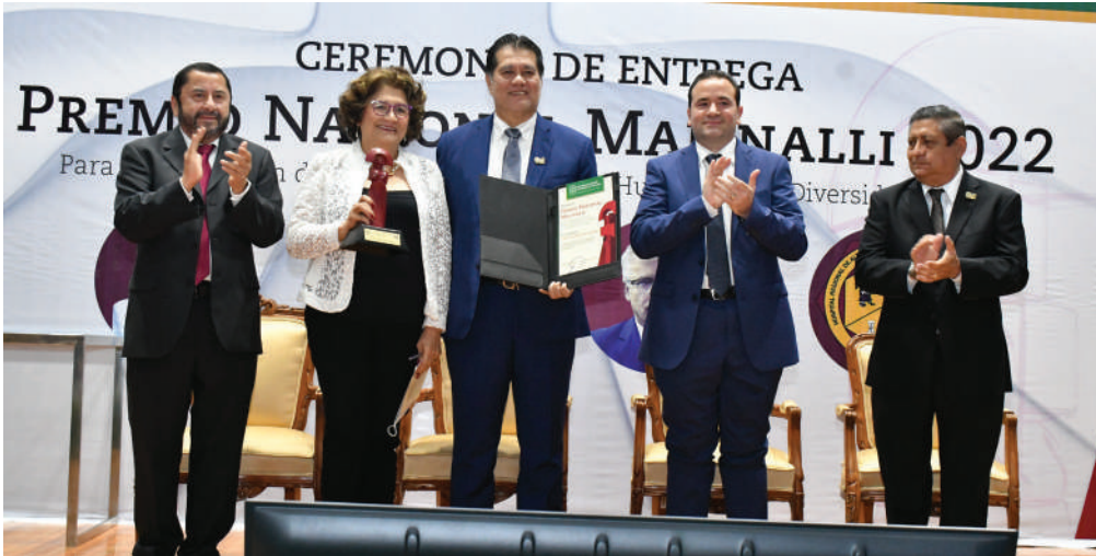
El 64 Aniversario de la UJAT enmarcó esta evento institucional.