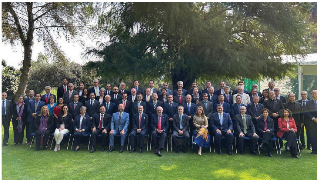
El evento se realizó el pasado 16 de noviembre en la Ciudad de México.