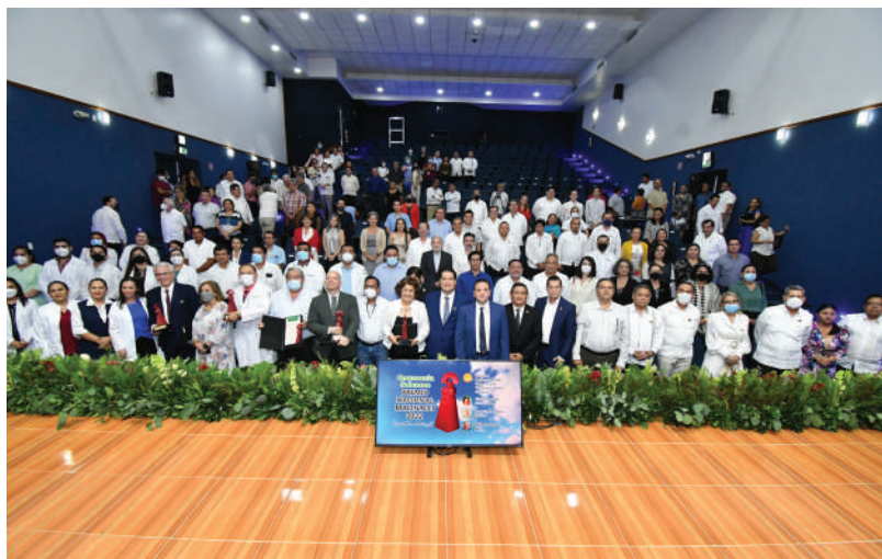
Se realizó la toma de la foto del recuerdo con los galardonados de este premio en su edición 2022.

del caso Julian Assange y WikiLeaks, señalando que su decisión de difundir los crímenes de lesa humanidad y corrupción en Iraq, fue un acto de ejercicio de la libertad de expresión, hecho que lo tiene en un proceso de extradición a Estados Unidos lo cual consideró como un acto de “injusticia”.