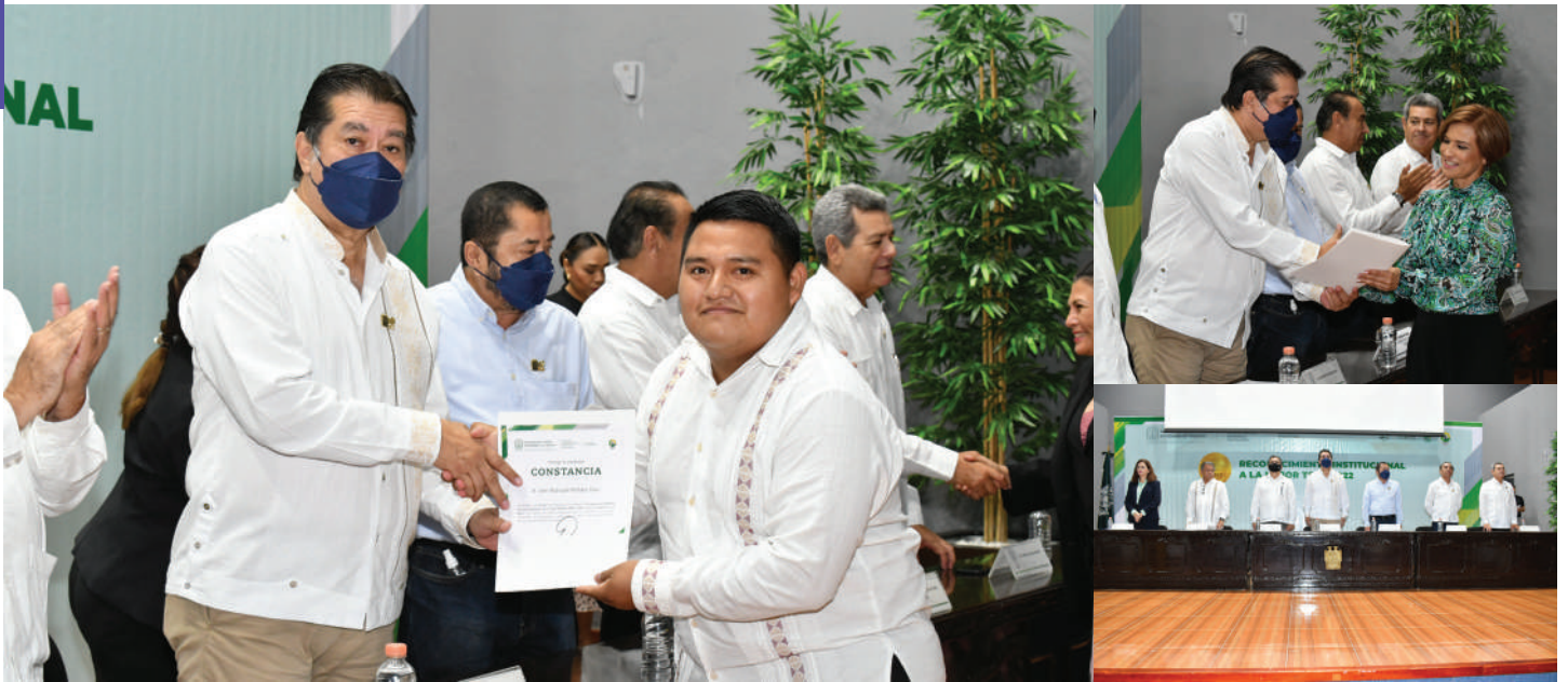
La ceremonia se llevó a cabo el pasado 15 de noviembre en el auditorio del Centro Internacional de Vinculación y Enseñanza.