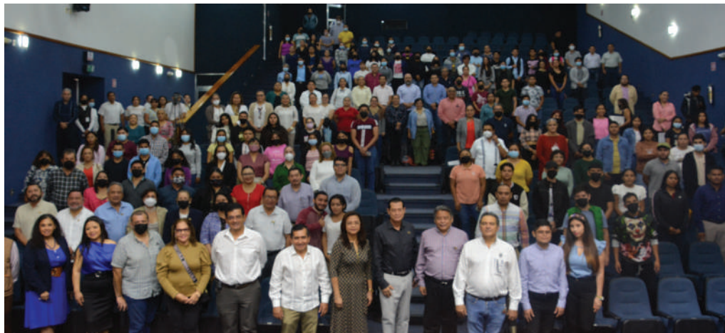
Los asistentes se congregaron en el CIVE de la UJAT

>> Las actividades se realizaron los días 24 y 25 de noviembre.