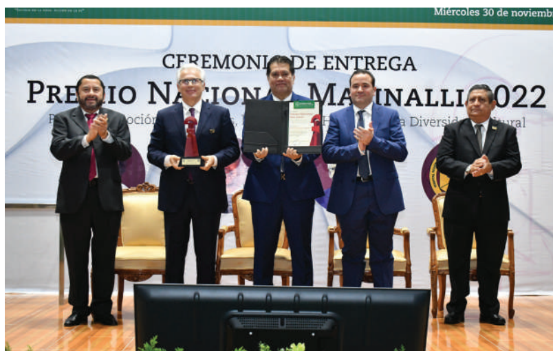
El Rector y el Secretario de Gobierno, realizaron la entrega de estas distinciones durante el desarrollo de la Ceremonia Solemne.