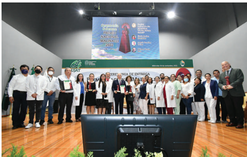
Los galardonados junto a los integrantes del Hospital de Alta Especialidad “Dr. Juan Graham Casasús”.