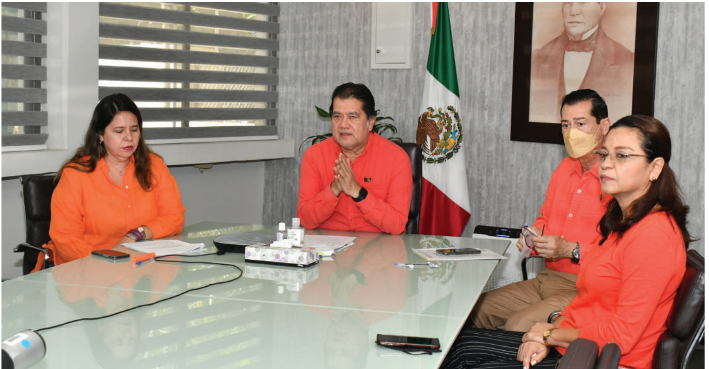
En este marco, también se inauguraron las actividades por los 26 días de activismo.

>> El Rector de la UJAT clausuró el Diplomado “Estudios de Género: Análisis multidisciplinario de la violencia de género”.