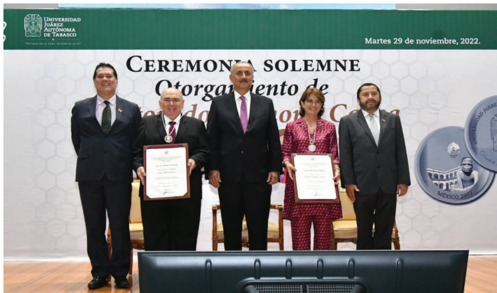
La ceremonia solemne se realizó en el Auditorio del CIVE.

>> Los reconocimientos se entregaron en el marco del 64 Aniversario de la Máxima Casa de Estudios.