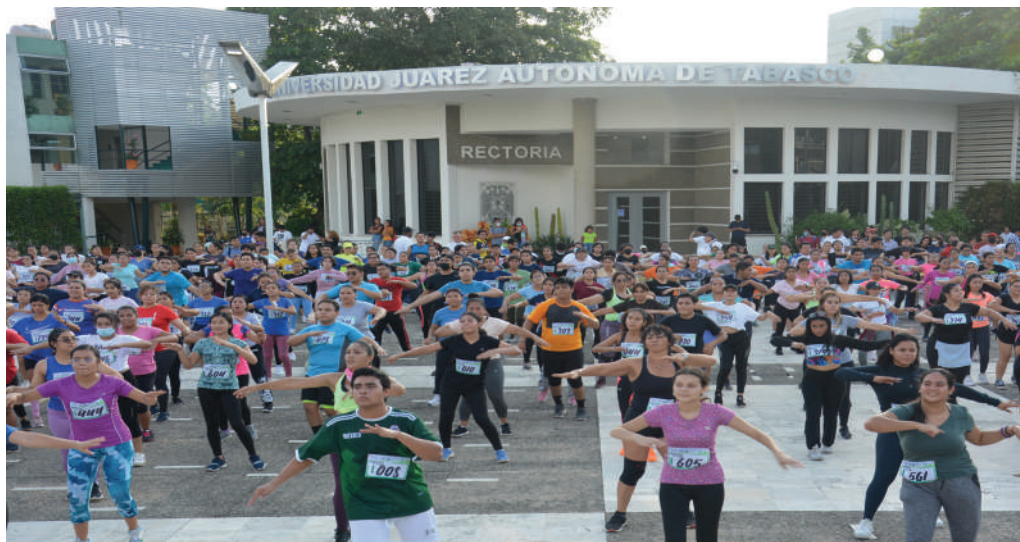
La Plaza Cívica Universitaria congregó a los deportistas participantes en esta edición.