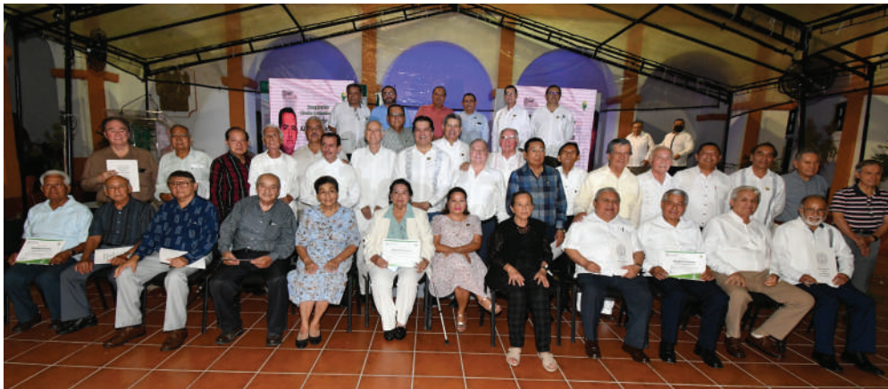
Se entregaron distinciones a egresados de la generación 1968-1972 de la Licenciatura en Derecho.

>> En este escenario, se otorgó un reconocimiento a familiares del jurista tabasqueño.