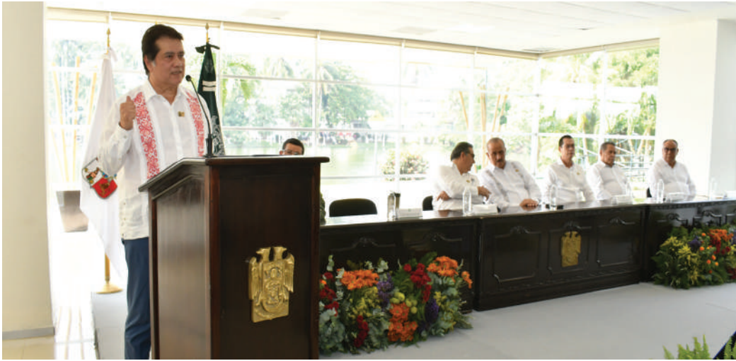
El Rector destacó la trayectoria de los docentes por su trabajo por la enseñanza de un segundo idioma.