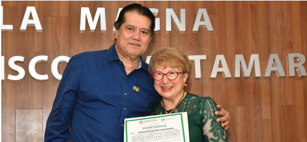
La Ministra de la SCJN estuvo acompañada por el Rector de la UJAT.