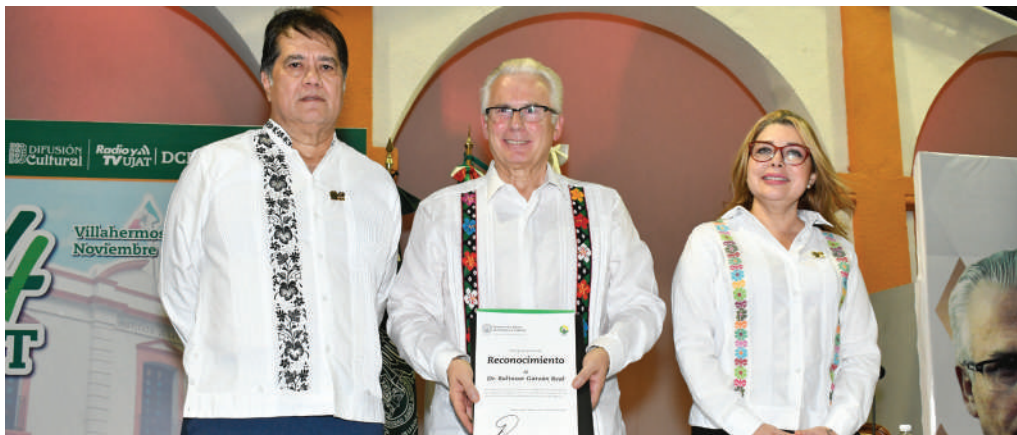
El Instituto Juárez fue el escenario de esta disertación realizada durante el 64 Aniversario de la UJAT.

>> El también galardonado con el Premio Nacional Malinalli, impartió la conferencia magistral “Un compromiso de progreso”.