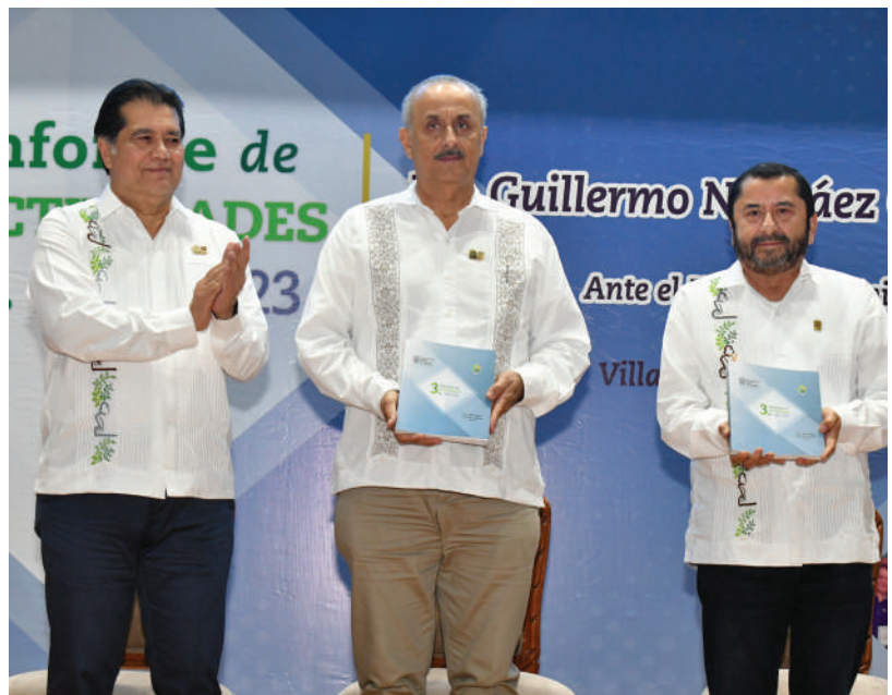
El Rector hizo entrega del documento del Tercer Informe de Actividades.