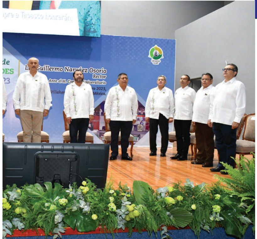
La sesión se realizó en el Centro Internacional de Vinculación y Enseñanza.