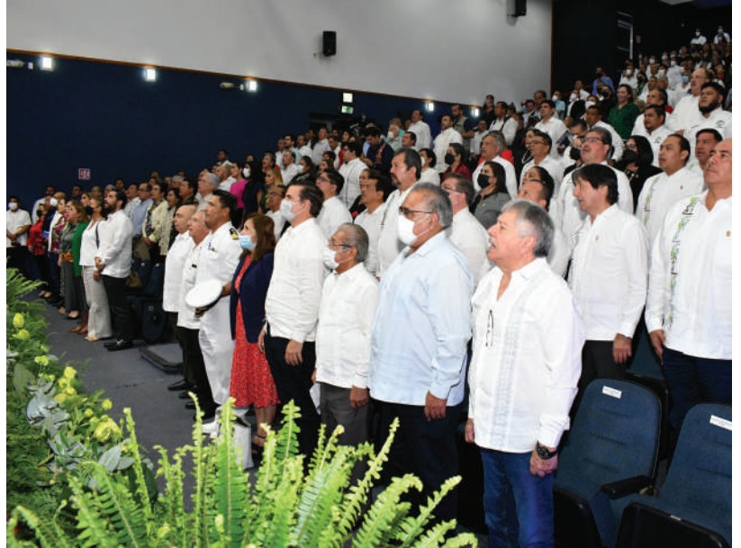
Asistieron invitados especiales e integrantes de la comunidad universitaria.