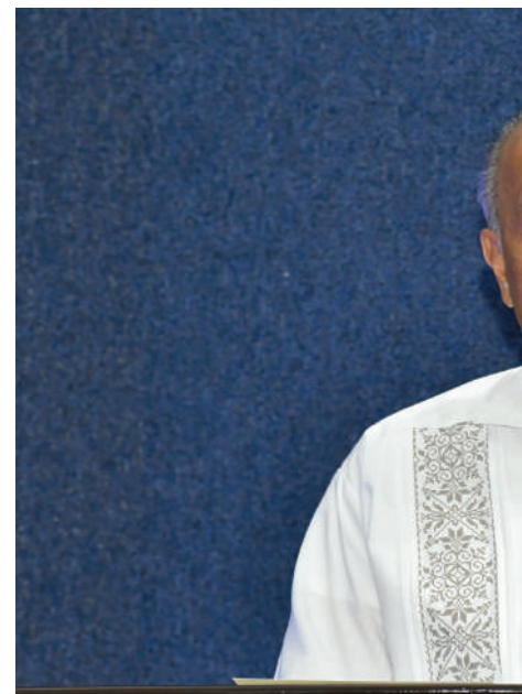
El Gobernador de Tabasco se congratuló por el t