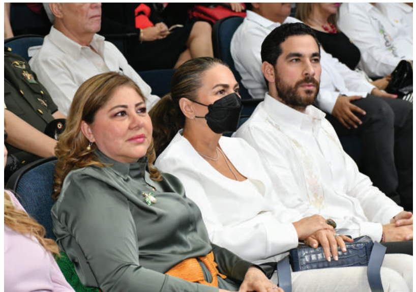
Las presidentas del Sistema DIF Tabasco y del Voluntariado UJAT