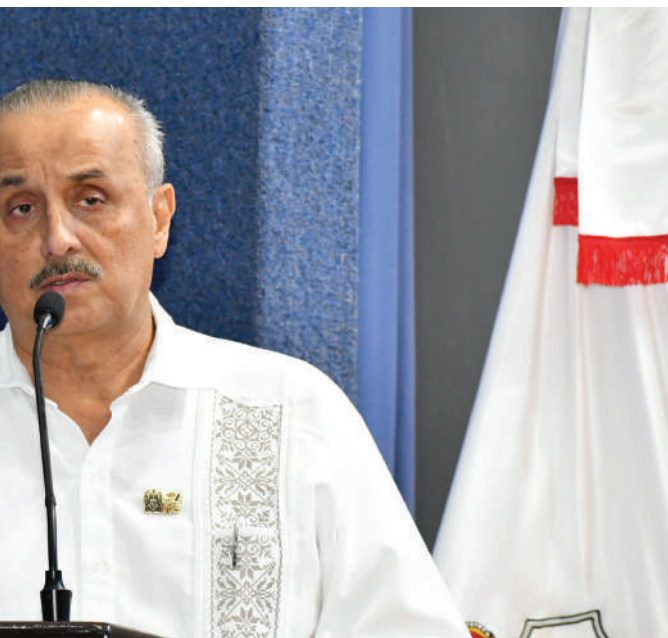
trabajo realizado durante el periodo informado.