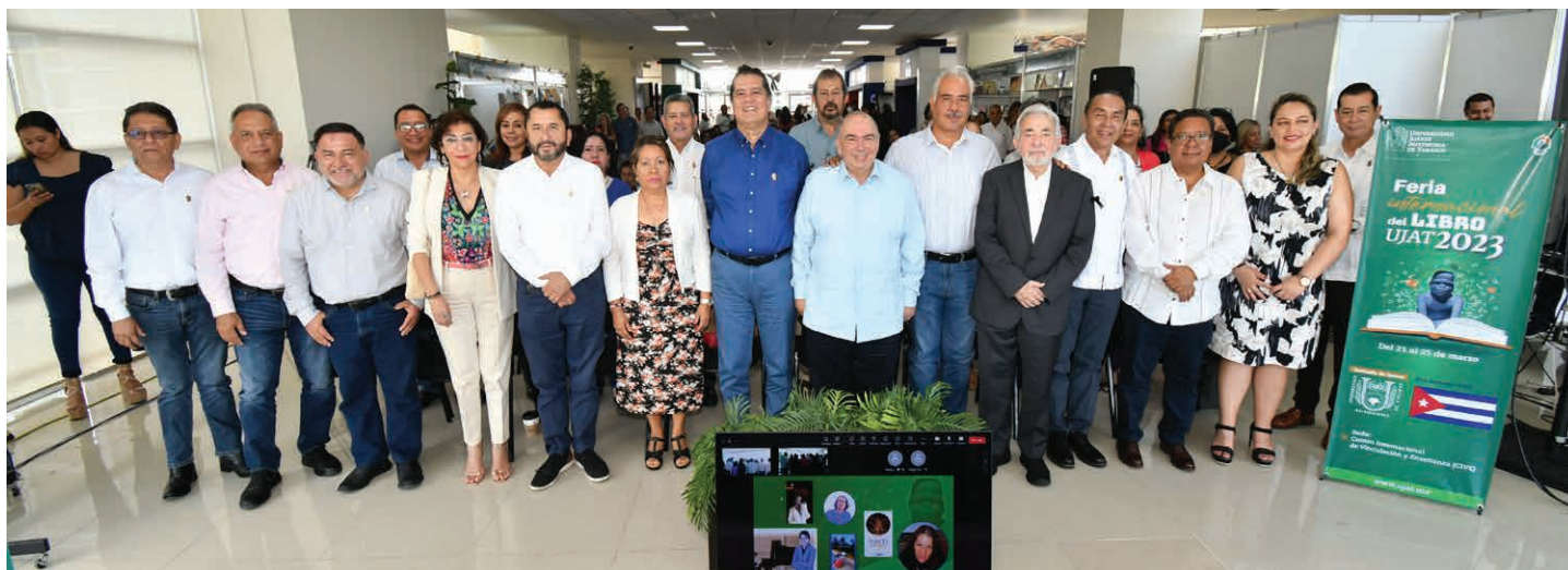
La presentación de los libros, se realizó en el marco de la FIL UJAT 2023, en el escenario del vestíbulo del CIVE.