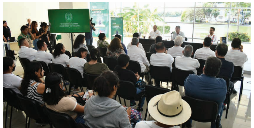
Estuvieron presentes autoridades de ambas instituciones y público en general.

La UNACH inició sus actividades el 17 de abril de 1975