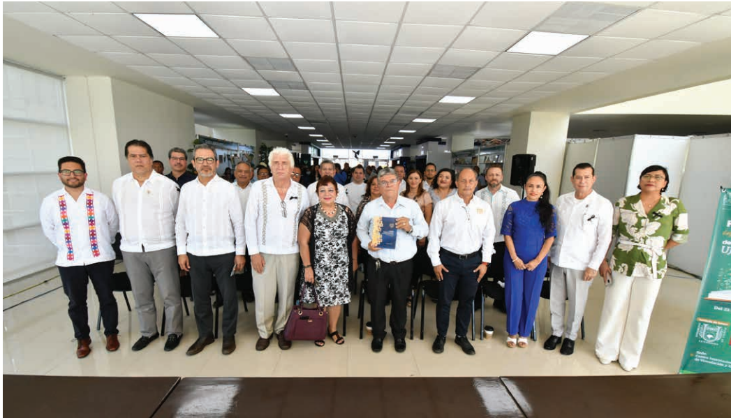
El escenario Foro FIL CIVE congregó a los profesores de la Universidad invitada