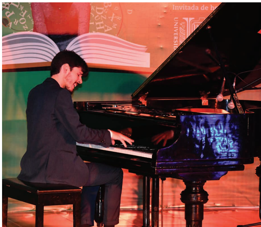
El pianista llenó el espacio del CIVE con sus interpretaciones musicales.

Entre sus reconocimientos cuenta con el premio a la mejor composición del Stanford Jazz Workshop 2016; primer lugar en el concurso internacional Vivo (2018) en el Carnegie Hall de Nueva York; premio especial en el certamen Grand Prize Virtuoso Ámsterdam (2019), junto a la violinista Tania Haase, con quien conformara entonces el dúo Espiral; segundo premio en el concurso provincial de piano Amadeo Roldán; así