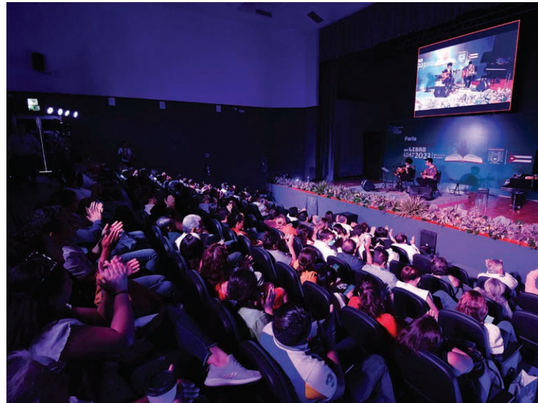
El auditorio del Centro Internacional de Vinculación y Enseñanza, congregó a los espectadores de este concierto.