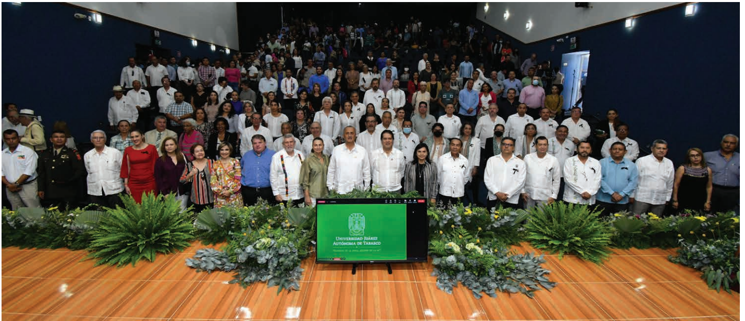
El Centro Internacional de Vinculación y Enseñanza fue el escenario principal de esta fiesta literaria universitaria.

“En este espacio privilegiado que rinde homenaje a las obras realizadas por destacados escritores y artistas, tanto locales como internacionales, sin lugar a dudas, será un placer deleitar el conocimiento con obras de escritores como el más grande poeta tropical Carlos Pellicer Cámara, así como otros tabasqueños que heredaron un sinnúmero de textos como José Gorostiza, Andrés Iduarte, José Carlos Becerra y el guardián de las letras y las palabras de Tabasco, Francisco J. Santamaría”, expuso.