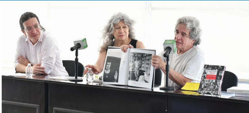
El autor mostró algunas fotografías que integran a esta compilación de retratos.

>> La obra fue publicada en el 2014 y está concebida en dos entregas.