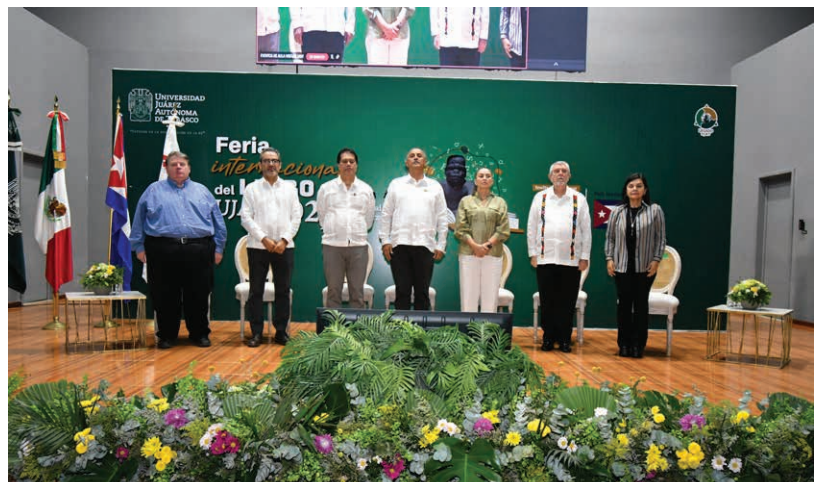
El Gobernador de Tabasco, Carlos Manuel Merino Campos, realizó la declaratoria inaugural