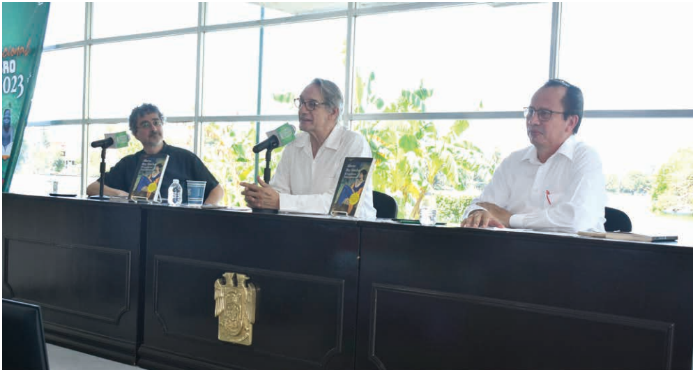
Los escritores participaron en el Foro FIL CIVE