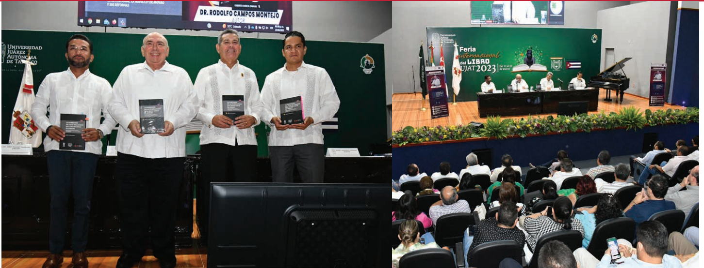
El evento se desarrolló en el auditorio del Centro Internacional de Vinculación y Enseñanza, como parte de la FIL UJAT 2023.