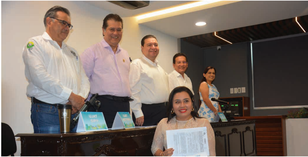
Las autoridades reconocieron el trabajo de investigación que se realiza al interior de la Universidad.

>> Los 20 proyectos financiados se eligieron de los 177 inscritos en la convocatoria.