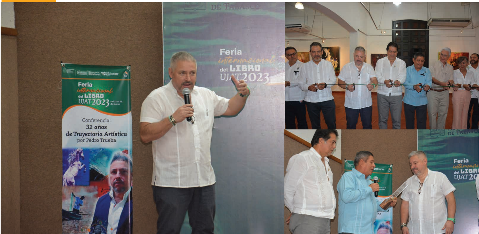
La presentación se realizó en el auditorio "Manuel Sánchez Mármol", del Instituto Juárez.