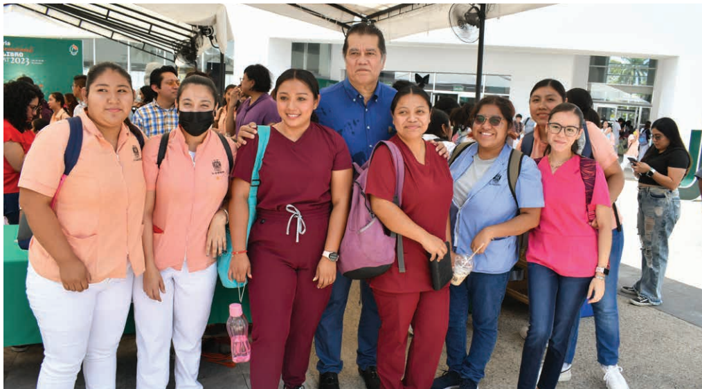
La explanada del CIVE congregó a los jóvenes, quienes presentaron sus productos y servicios

>> Autoridades estatales también visitaron los proyectos de los estudiantes.