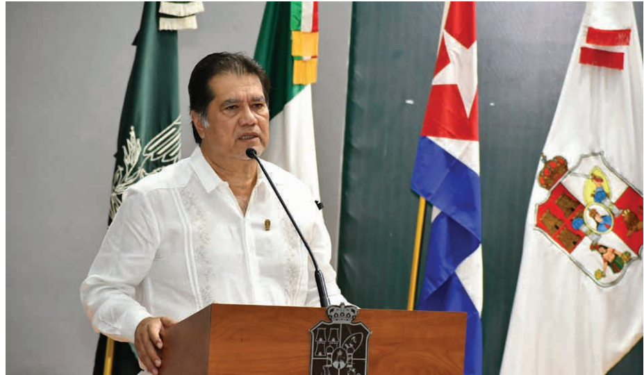
El Rector Guillermo Narváez Osorio, encabezó esta ceremonia

>> Después de 3 años de no realizarse, la FIL se llevó a cabo del 21 al 25 de marzo y tuvo como país invitado a Cuba y como invitada de honor a la UNACH.