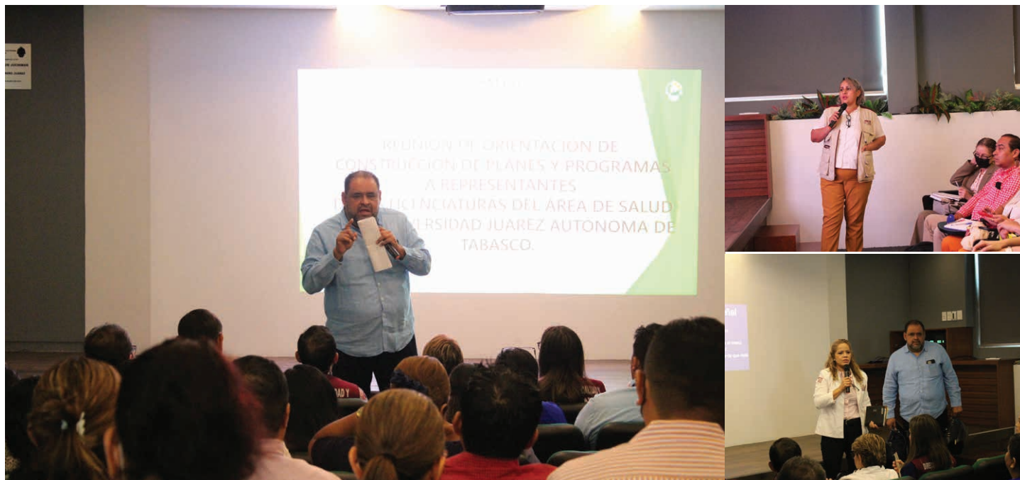
La reunión congregó a los asistentes en el auditorio “Jorge Membreño Juárez”, de la Secretaría de Servicios Administrativos.

>> Participaron directores y personal de las divisiones en las que se imparten carreras de esta área del conocimiento.