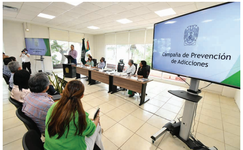
La DAEA fue la primera División sede de esta campaña institucional.

Se impartió la conferencia testimonial por integrantes de Alcohólicos Anónimos A.C.