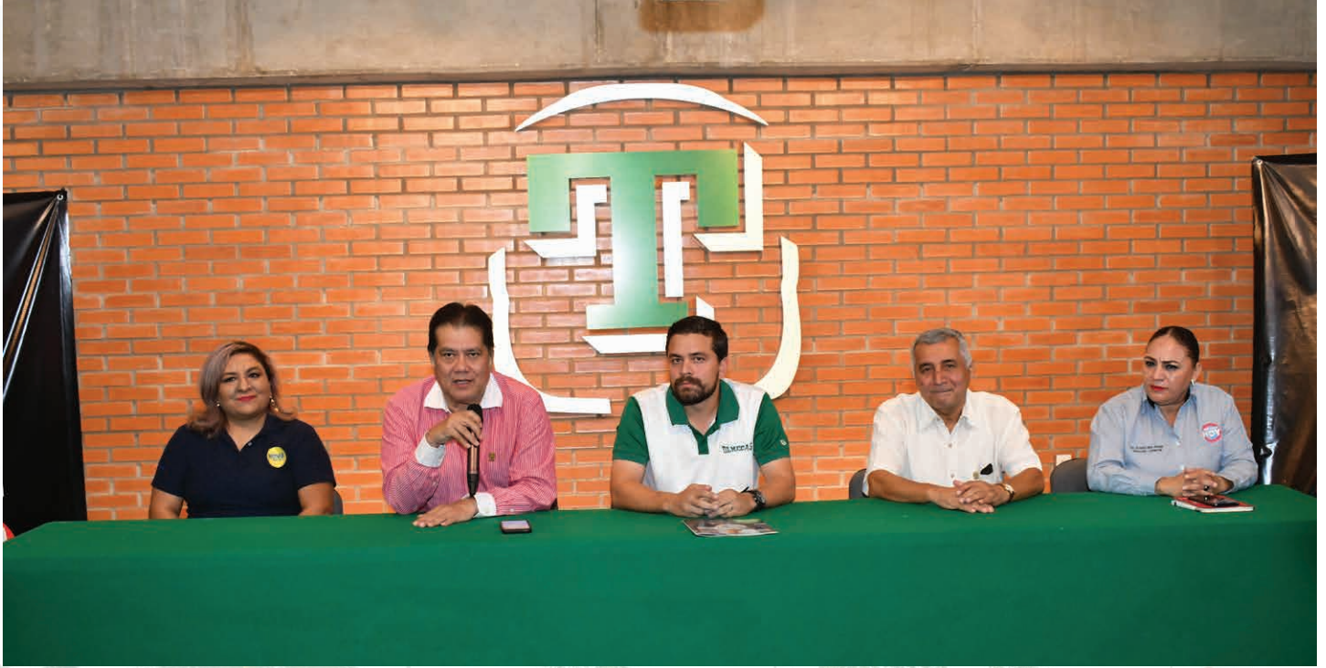
La información se dio a conocer en rueda de prensa, a través de las redes sociales oficiales del Club Deportivo de los Olmecas de Tabasco.

>> El canal 35.1 TDT albergará todos los partidos del Club Olmecas de Tabasco de la Temporada 2023.