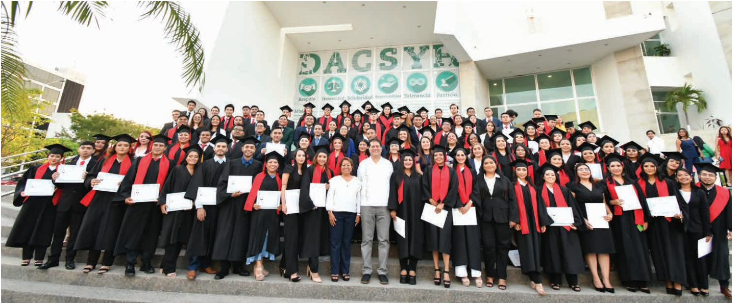
Las autoridades universitarias se tomaron la foto del recuerdo con la generación de egresados de la DACSyH.