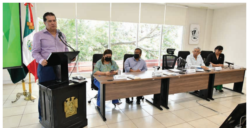
El Rector exhortó a los participantes, a atender a las historias de vida que se compartieron