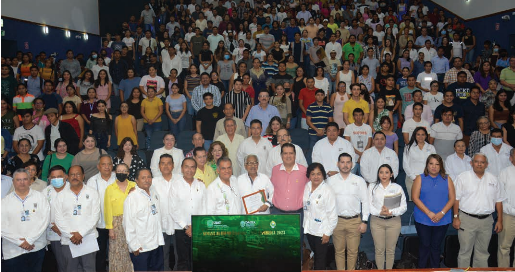
El Rector de la UJAT inauguró la Semana Académica de Contaduría Pública 2023