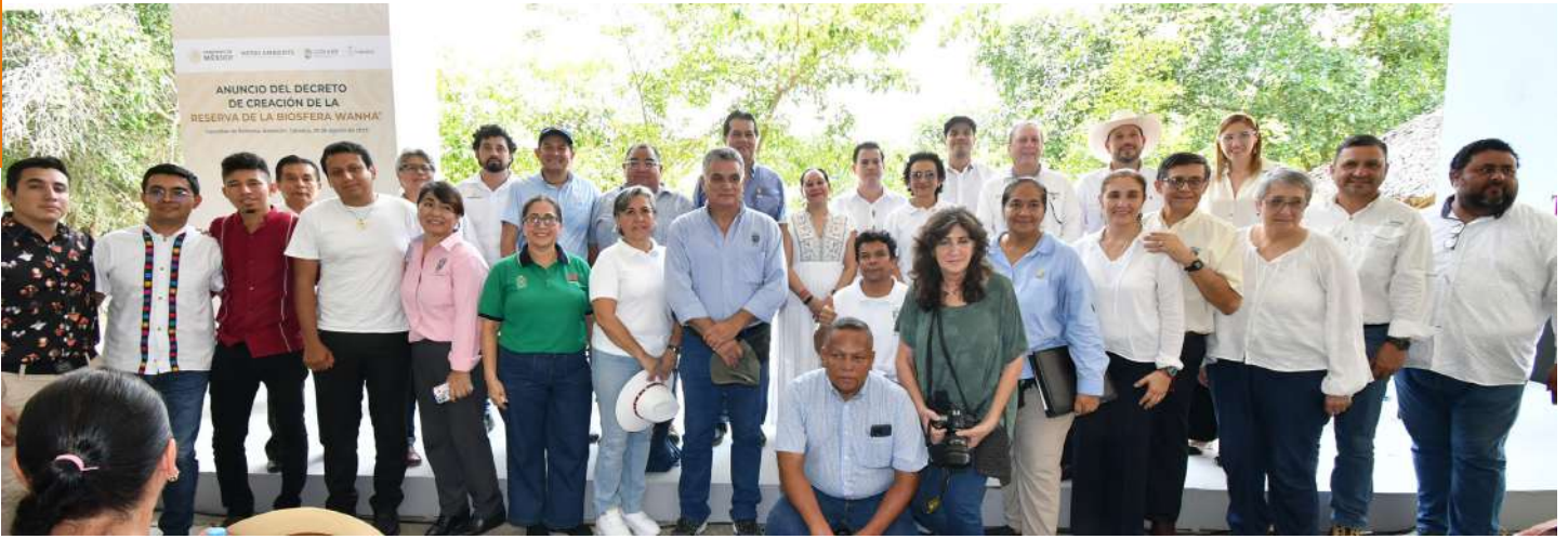
Gracias al trabajo de los profesores investigadores de la UJAT se logró concretar el Plan de Manejo.