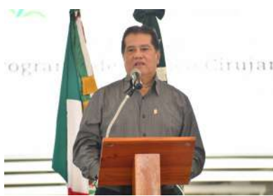
El rector destacó la trayectoria profesional y académica del galardonado.