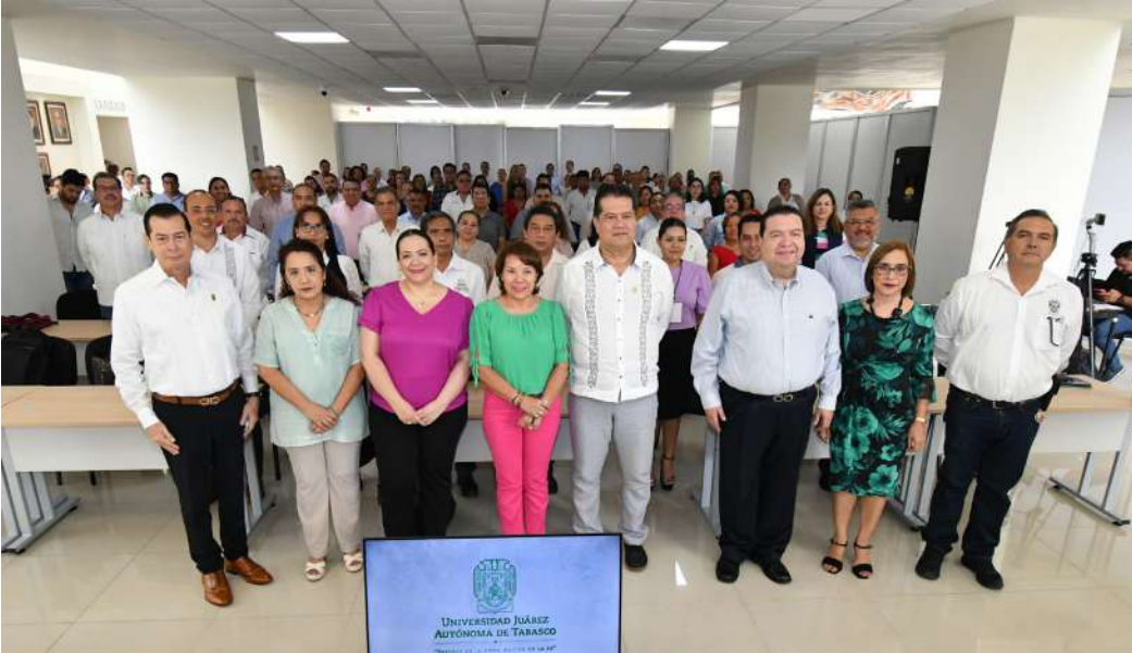
La capacitación fue realizada en el Centro Internacional de Vinculación y Enseñanza de la UJAT.

>> Los trabajos se desarrollaron en el marco de las iniciativas que desarrolla el Consejo Nacional para la Coordinación de la Educación Superior .