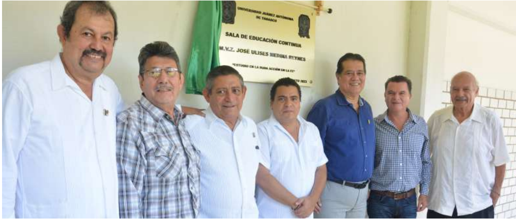
Las aulas de la DACA llevarán los nombres de profesores investigadores reconocidos por su trayectoria.