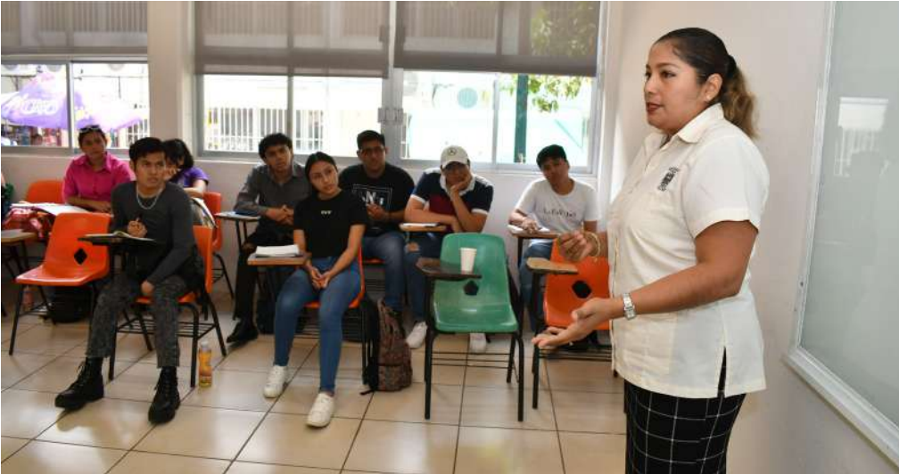
Los docentes dieron la bienvenida en cada una de las aulas de las 12 divisiones académicas.

>> Tan sólo en el Centro de Enseñanza de Lenguas Extranjeras se inscribieron 10 mil 584 jóvenes.