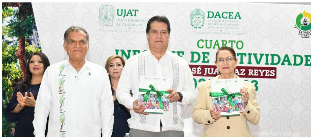
El rector hizo énfasis en que la cultura financiera permitió conseguir los logros presentados en el informe