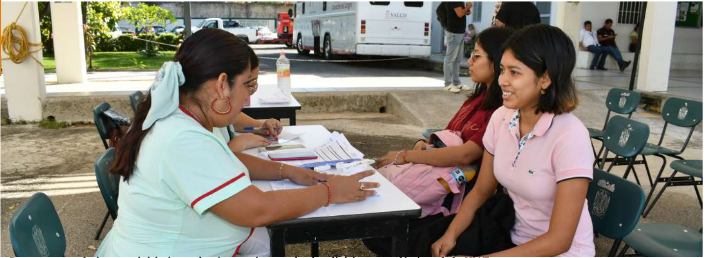
De manera paulatina esta iniciativa se hará extensiva a todas las divisiones académicas de la UJAT.