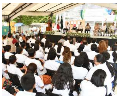
La ceremonia tuvo como sede la División Académica de Ciencias de la Salud.