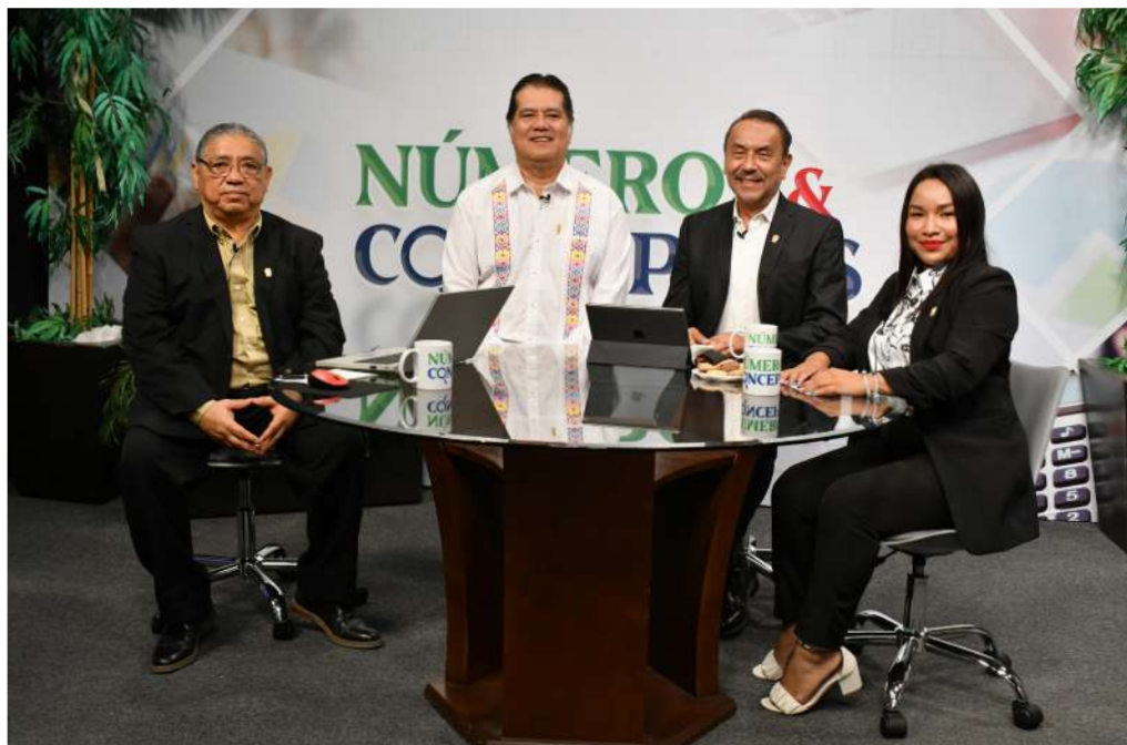
El rector de la UJAT fue el encargado de dar la bienvenida a este nuevo espacio de expresión.

>> Este proyecto se transmite en vivo por el canal 35.1 de TV UJAT y es producido por la Secretaría de Finanzas de la universidad.