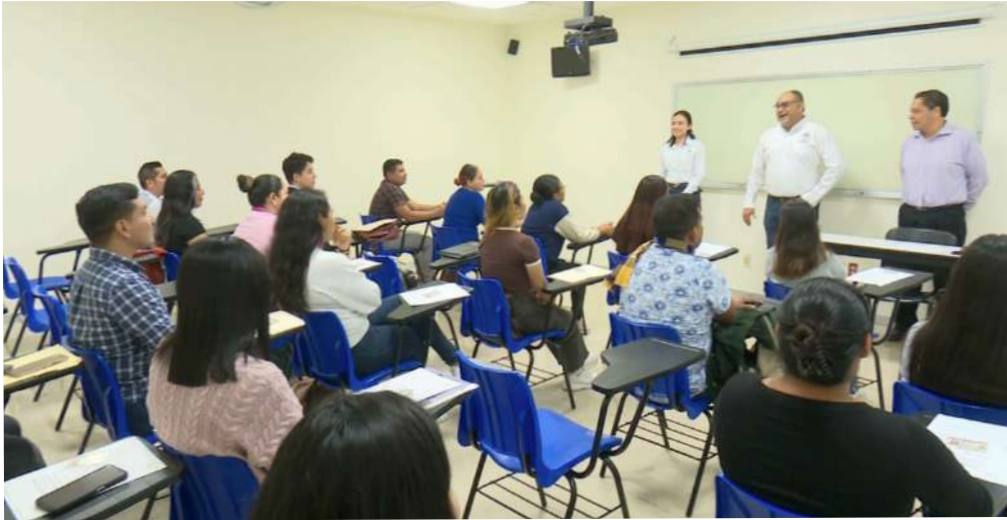
En la capacitación participaron enfermeros que se postularon a través del Servicio Nacional de Empleo.

>> Esta actividad se deriva de un convenio establecido entre la UJAT y la Fundación Hospitalaria de las Hermanas Niederbronner.