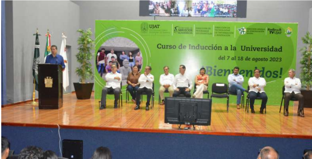
El Curso de Inducción a la Universidad fue impartido a cerca de seis mil estudiantes de nuevo ingreso.

>> El rector dio a conocer que la UJAT cuenta con controles de acceso y de mecanismos para combatir el acoso y el hostigamiento.