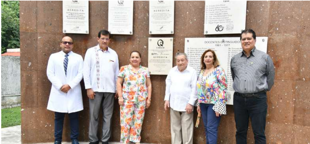
EL COMAEM reconoció la calidad educativa de este programa de estudio de la DACS.

>> El rector de la UJAT aseguró que este evento pone de manifiesto el compromiso que esta casa de estudios tiene con la educación pública de excelencia.