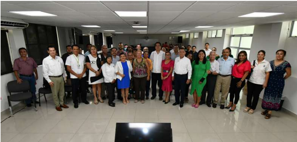
El rector recomendó a la planta docente del SEAD, fortalecer sus contenidos digitales.

>> Mediante este sistema se puede favorecer el incremento de la matrícula escolar.