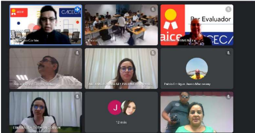
El CACECA consideró que la carrera obtuvo el puntaje necesario para acreditarse.

>> El programa acreditado concentra sus principales logros en los rubros de infraestructura, evaluación y plan de estudios .