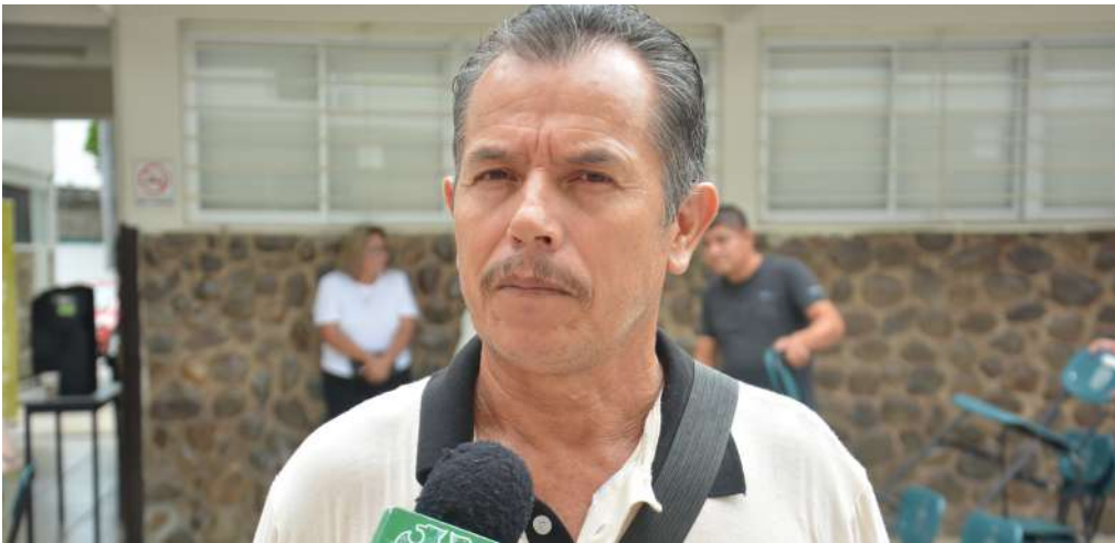
Al opinar sobre este proceso, los padres de familia avalaron los resultados del examen CENEVAL.