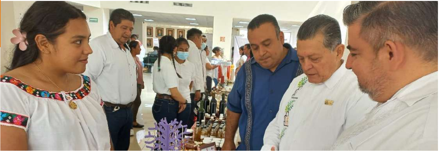
El proyecto es apoyado por la Secretaría de Desarrollo Económico y por el Centro de Emprendimiento de la UJAT.