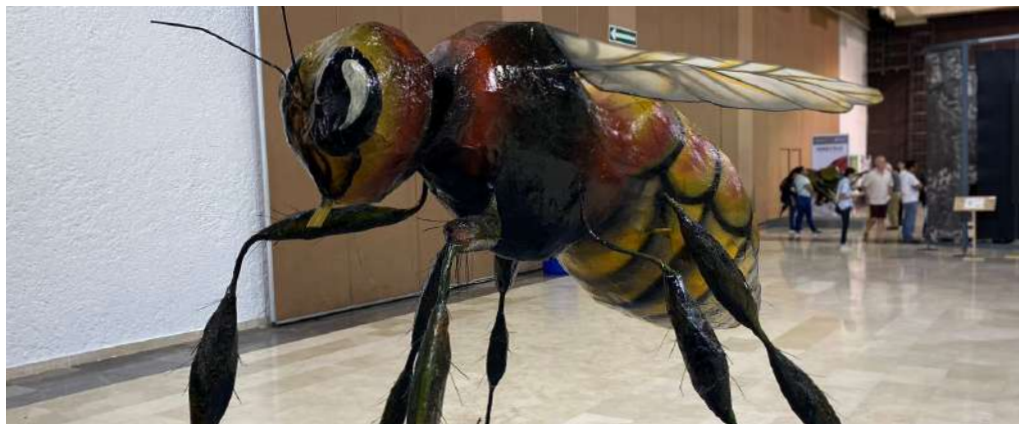
Si las abejas no existieran la humanidad colapsaría afirmó la especialista.

>> El proyecto fue presentado en el marco de la Exposición “Insectus. Ciencia, Arte, Cultura”.