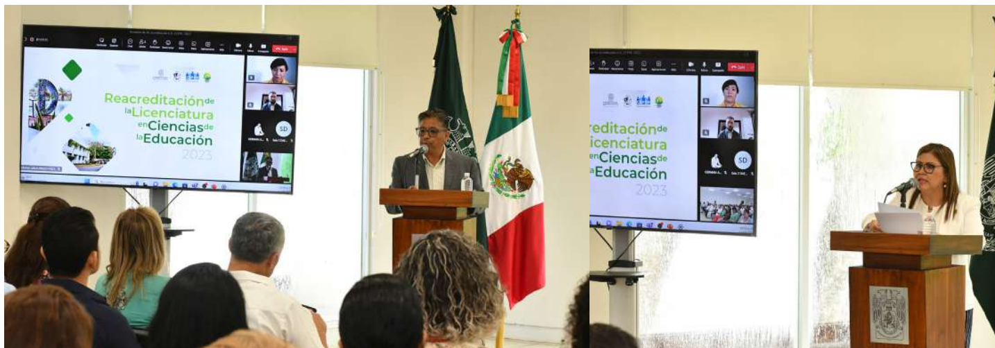
Este logro se obtuvo en la víspera del 50 Aniversario de la creación de esta carrera que se imparte en la UJAT

>> Integrantes del CEPPE visitaron la DAEA y entrevistaron a su comunidad universitaria.