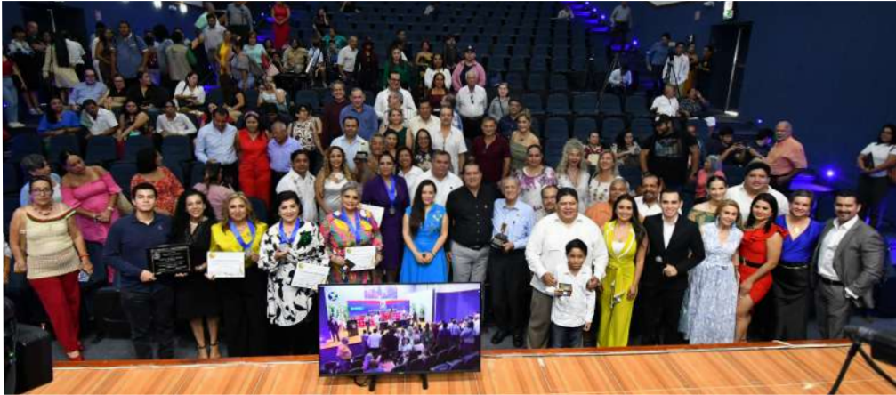
El auditorio del Centro Internacional de Vinculación y Enseñanza de la UJAT fue el marco para la entrega de los galardones.

>> La CORAT recibió una placa conmemorativa por el 40 Aniversario de este medio de comunicación oficial del estado.