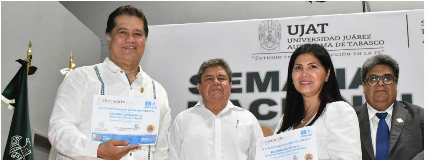
La distinción fue otorgada en el marco de la firma del convenio de colaboración entre la UJAT y la ANPROGERI.

>> La “Semana Nacional de Protección Civil 2023”, dio inicio con la conferencia magistral: “Evolución y Futuro de la Protección Civil en México”.