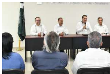
Participaron académicos y representantes de diversos organismos públicos y privados..