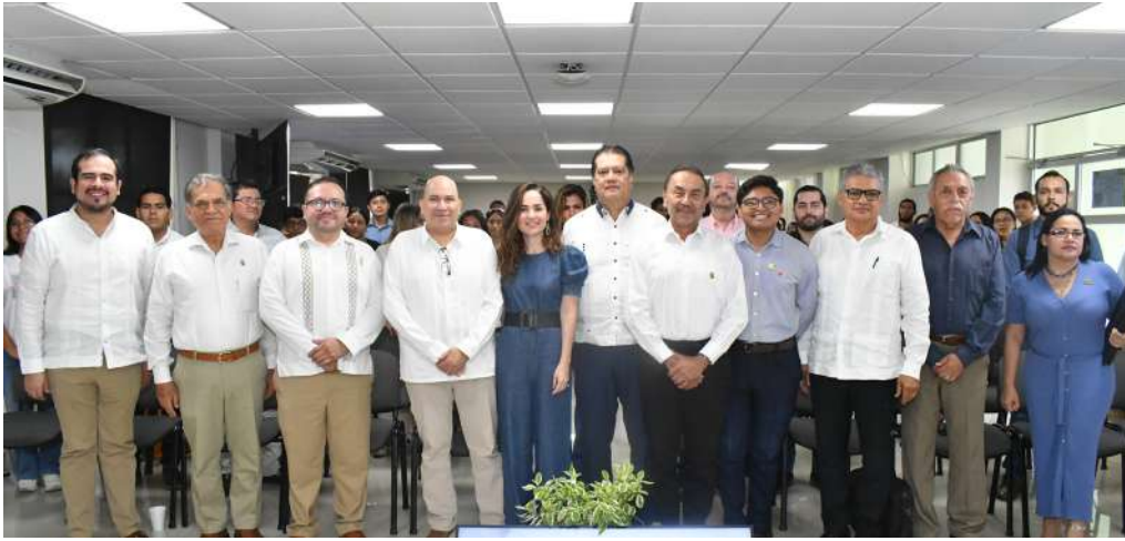
El rector inauguró un Conversatorio Universitario para alumnos de la División Académica de Ciencias Económico Administrativas.

>> Durante el evento se expresó la necesidad de heredar a las futuras generaciones el amor por el desarrollo de la sociedad.