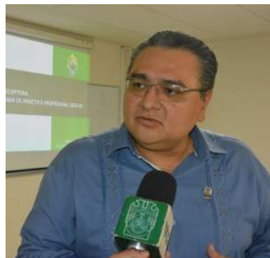
La iniciativa es organizada por la Secretaría de Servicios Académicos.

Las fases de ejecución establecen la adecuada prosecución que han de tener para lograr su propósito, considerando todos los momentos implicados en su desarrollo. Las dimensiones engloban los distintos aspectos que intervienen en ellas, desde el punto de vista organizativo, curricular, institucional y relacional.