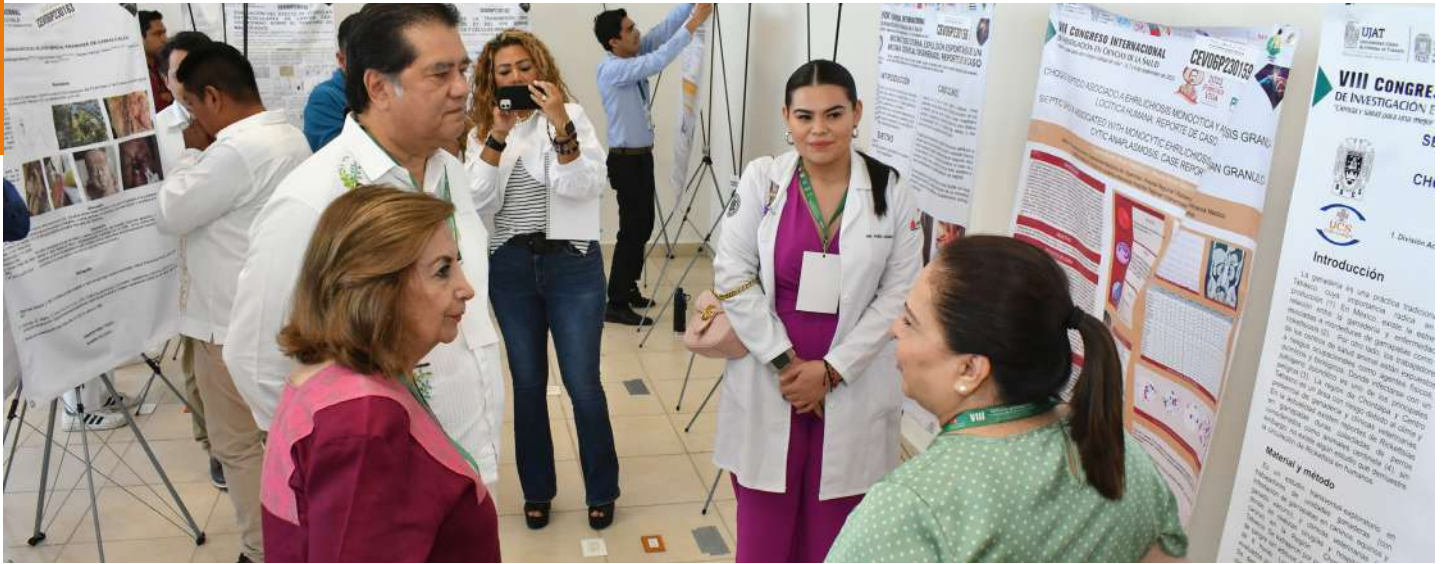
Cada año se realiza una edición del Congreso Internacional de Investigación en Ciencias de la Salud.