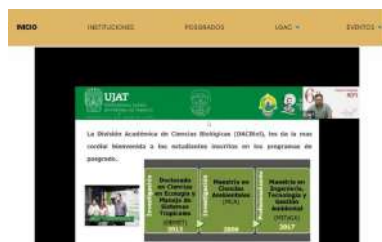
Las actividades se efectuaron a través de la plataforma en línea.