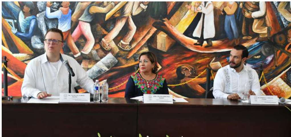
Los ponentes aseguraron que la democracia se enriquece cuando se escucha y se respetan las voces de todos los sectores de la sociedad.

>> La sede del foro fue la División Académica de Ciencias Sociales y Humanidades de la UJAT.