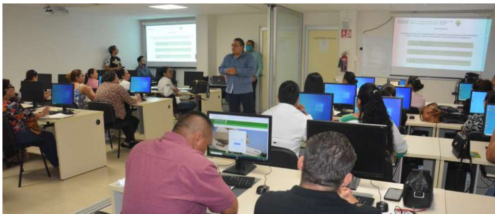
Se tomó protesta a los integrantes, en el marco del Día Mundial del Medio Ambiente.

>> En esta edición XVIII, se inscribieron un total de 344 estudiantes de diversas divisiones académicas.