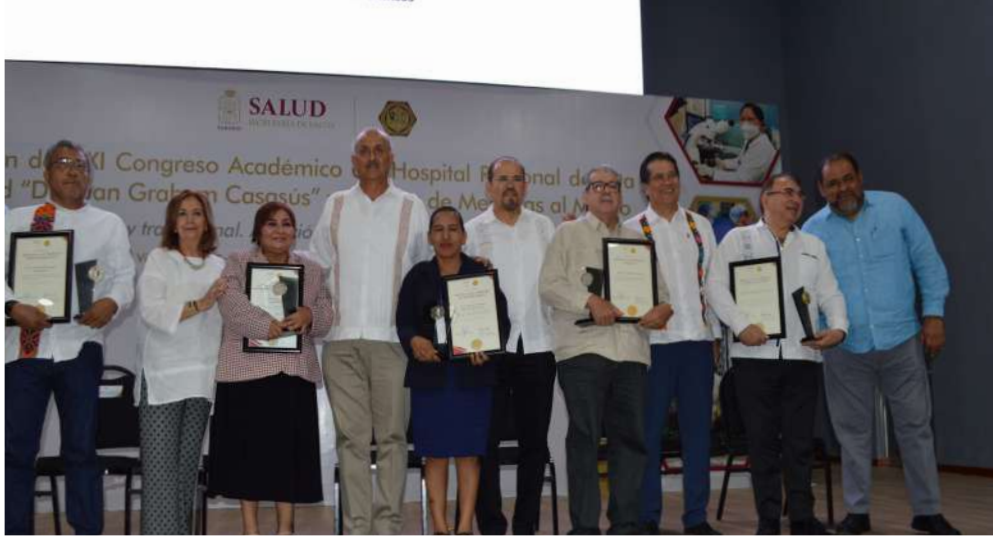
Los reconocimientos y medallas fueron entregados por autoridades del gobierno estatal, acompañados por el rector de la UJAT.

>> El galardón se otorgó en el marco del XXI Congreso Académico del Hospital Regional de Alta Especialidad “Dr. Juan Graham Casasús”.