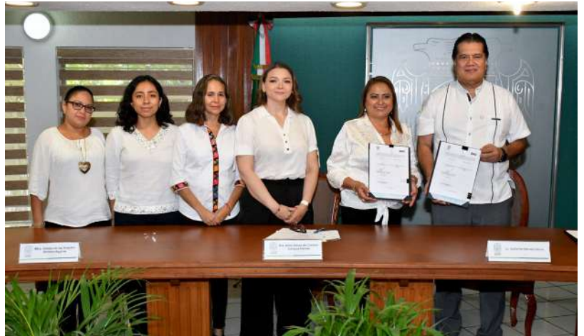
El objetivo del acuerdo es la prevención de la tendencia suicida en estudiantes.

“En esta suma de voluntades nuestro colegio orienta su labor de crecimiento con base en una