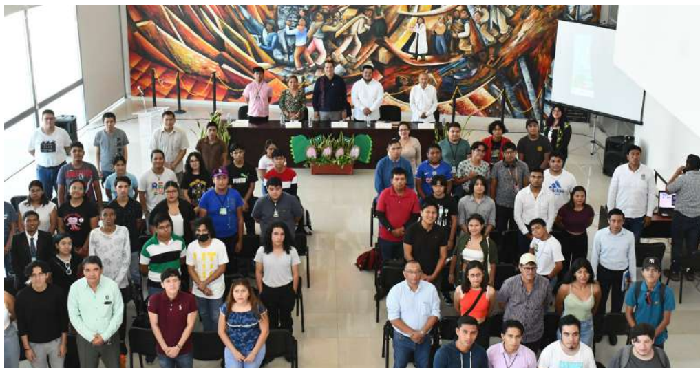
El lema del evento fue: “El Quehacer Histórico en el Hoy y el Mañana”.

>> Autoridades coincidieron en que es importante estudiar historia para entender cómo surge la sociedad actual.