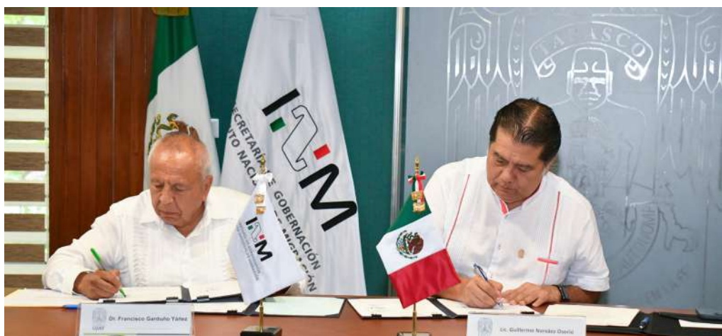
El tema migratorio, se ha convertido en prioridad de la agenda nacional.

>> La política del presidente Andrés Manuel López Obrador es procurar el respeto a los Derechos Humanos.