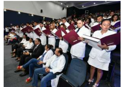
Lectura del Código de Bioética.