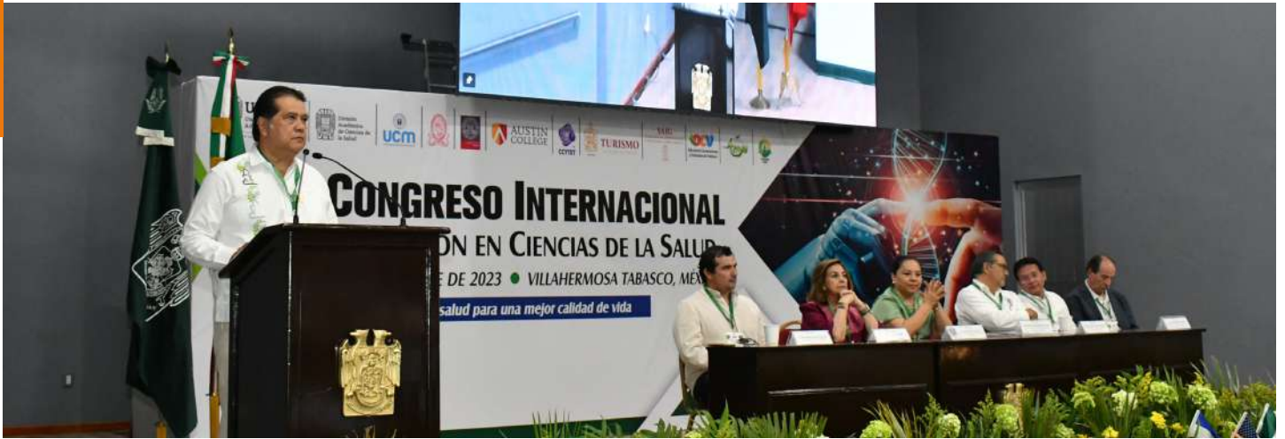
El foro reúne la participación de especialistas de Estados Unidos, España, Chile, El Salvador, Brasil, Colombia, Cuba, Argentina y México.