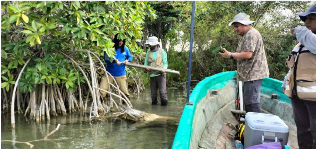
El objetivo es conocer la biodiversidad microbiana de este ecosistema relicto.

>> El proyecto de investigación contempla el desarrollo de estudios metagenómicos y de cultivo microbiano.