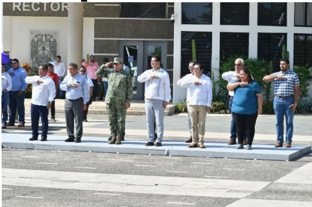
La ceremonia a la que acudió la comunidad de esta casa de estudios se llevó a cabo en la Plaza Cívica Universitaria.

>> Las escoltas y Banda de Guerra de la 30 Zona Militar y de la Novena Zona Naval, participaron en el evento cívico.