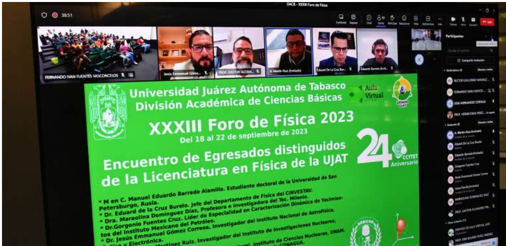
A través de un enlace a distancia, se realizó el Encuentro de Egresados.

>> *El conversatorio fue realizado en el marco del Trigésimo Tercer Foro de Física, organizado por la Academia de Física de la División Académica de Ciencias Básicas.