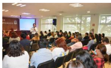
Al Aula Magna “Lic. Francisco J. Santamaría”, acudieron estudiantes y académicos.