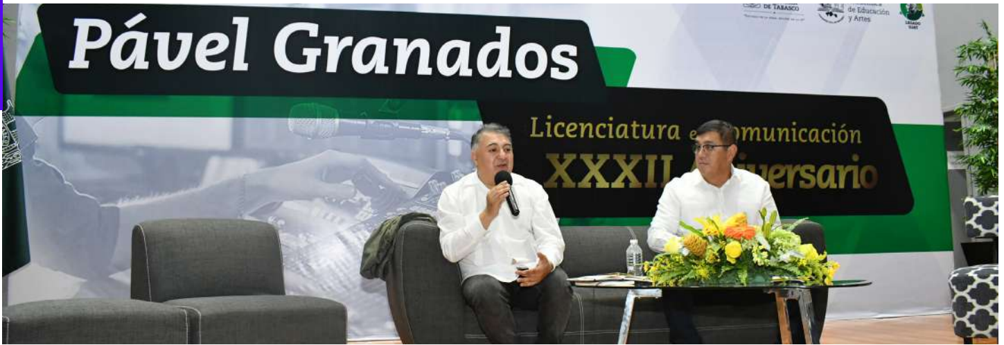
El director general de Televisión Metropolitana, disertó una conferencia magistral en el marco de los festejos por el 32 Aniversario de la Licenciatura en Comunicación.