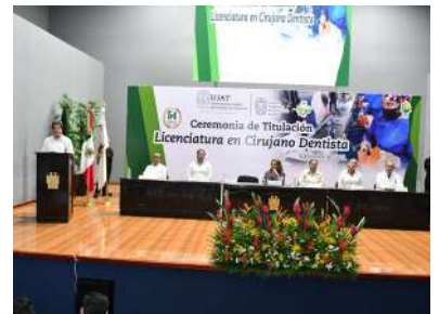
La ceremonia fue realizada en el Centro Internacional de Vinculación y Enseñanza.

>> Durante la ceremonia se tomó protesta y el Código de Bioética a los egresados de esta carrera que cuenta con un amplio campo laboral.