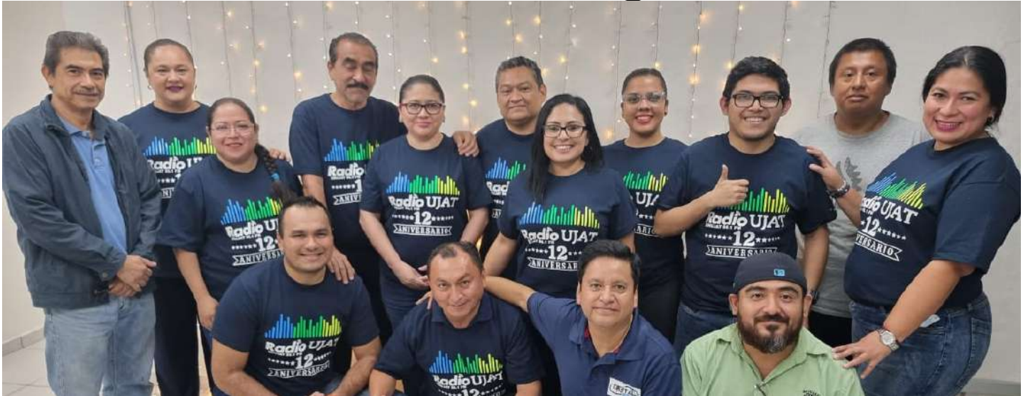
Radio UJAT es miembro de la Red de Radiodifusoras y Televisoras Educativas y Culturales de México.

>> El 19 de enero de 2023, Radio UJAT: Voz Universitaria, cambió sus emisiones a la señal 96.1 FM.