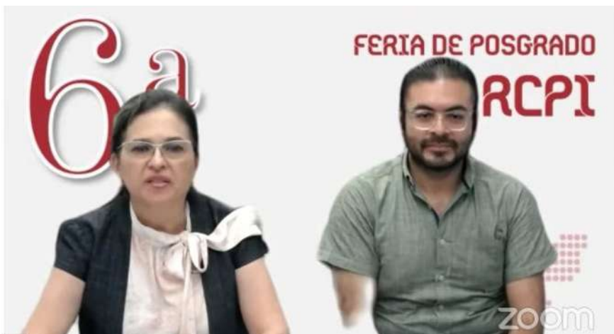
La Red CPI se constituye por 21 IES de la región Sur-Sureste de México.