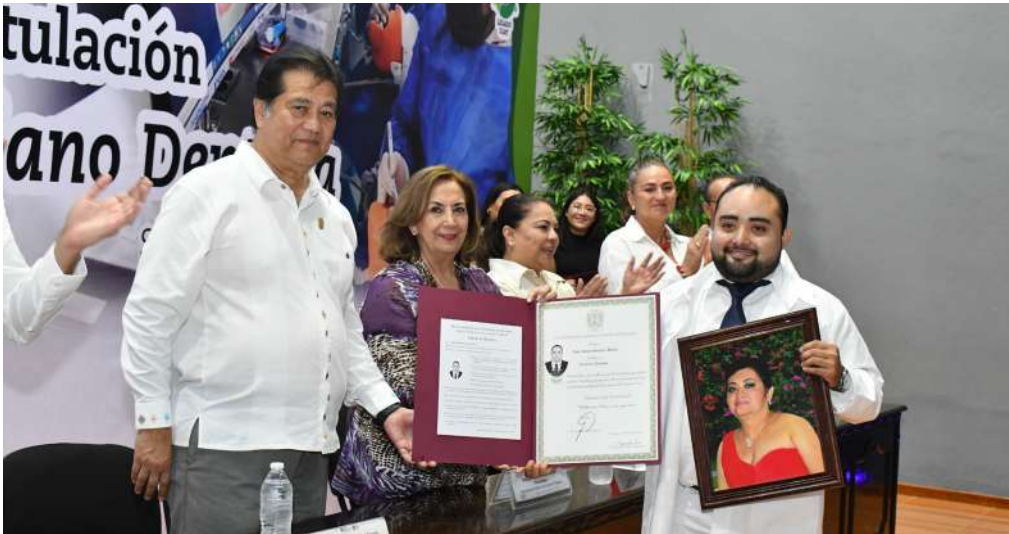
Con orgullo los egresados recibieron sus constancias por parte de las autoridades universitarias y de la Secretaría de Salud.