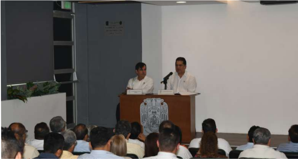
Las autoridades universitarias dieron a conocer la elaboración del Programa Anual de Archivo.

>> El objetivo principal es lograr la instauración del sistema universitario de archivos.