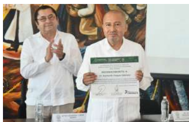
Ambos galardonados dijeron sentirse orgullosos de su profesión y agradecieron por la distinción.

La realización del evento que llevó por tema “La Historia y las Ciencias Sociales”, tuvo como finalidad la organización de eventos para valorar el quehacer de los historiadores en el contexto de la primera mitad del siglo XXI.