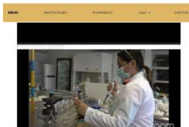
Uno de los objetivos es conjuntar esfuerzos y experiencias para el fortalecimiento de proyectos.

Para finalizar, expuso que la Red CPI se constituye por 21 IES de la región Sur-Sureste de México, diez de ellas universidades públicas, ocho institutos, dos centros de investigación y una institución privada, con el objetivo de impulsar de forma interinstitucional la capacidad y la competitividad académica, así como fortalecer la vinculación mediante la firma de acuerdos de colaboración que procuren la eficiencia de los equipos a cargo de la investigación y los estudios de posgrado.