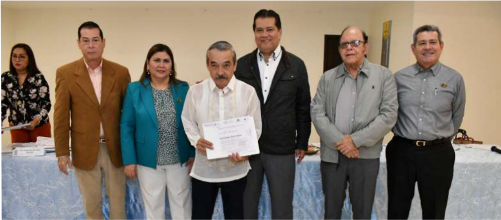
Se entregaron los reconocimientos a 13 profesores de esta División Académica.

>> La distinción se otorgó en el marco de la celebración del 50 aniversario de esta carrera.