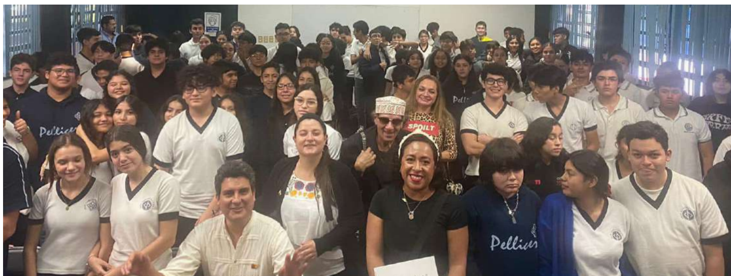
Los festejos del 65 Aniversario de la UJAT contemplaron actividades en centros educativos de nivel básico.

P oetas de Honduras, Cuba, México, Colombia y Costa Rica, visitaron el Colegio Carlos Pellicer Cámara, en donde realizaron una “Lectura poética y conversatorio” en el que interactuaron