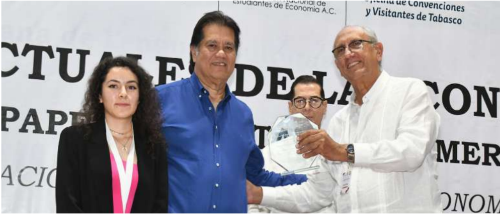
Se realizó el XXXVI Congreso Nacional de Estudiantes de Economía