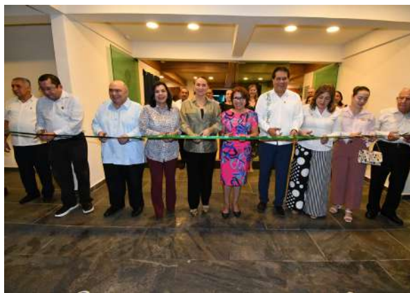
El corte de listón dio paso al recorrido por el interior de este recinto