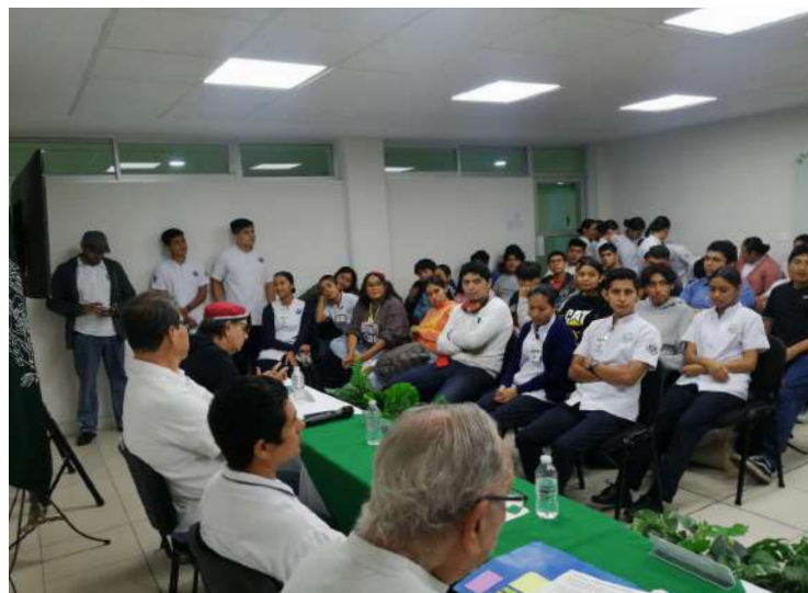
Participaron profesores y estudiantes de ambas divisiones académicas multidisciplinarias.

>> Asistieron poetas de Cuba, Perú, Chile, Italia, Colombia, Costa Rica, Honduras y México, para sumarse a los festejos de esta casa de estudios.