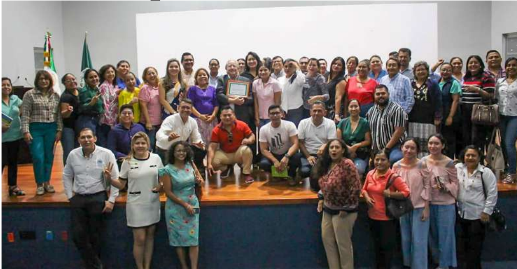
La plática se realizó en la División Académica de Ciencias Sociales y Humanidades.

>> El Doctor en Ciencias de la Educación por la Universidad Complutense de Madrid, disertó la conferencia “Docentes para el Siglo XXI, claves y estrategias de una práctica educativa efectiva”