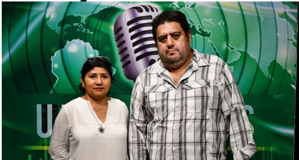
Los docentes pertenecen a la División Académica de Ciencias Agropecuarias

>> Los profesores acudieron al programa de Noticias de Radio y TV UJAT