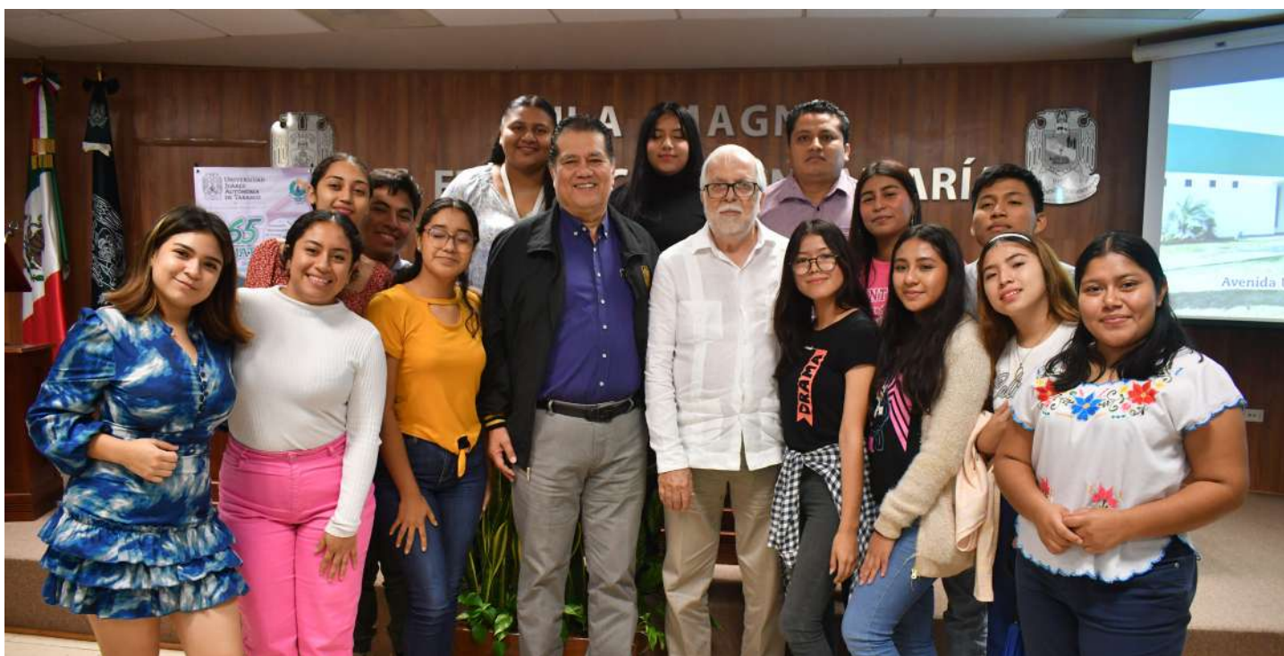
Estudiantes de la División Académica de Ciencias Sociales y Humanidades, se acercaron al ponente, con quien se tomaron la foto del recuerdo.