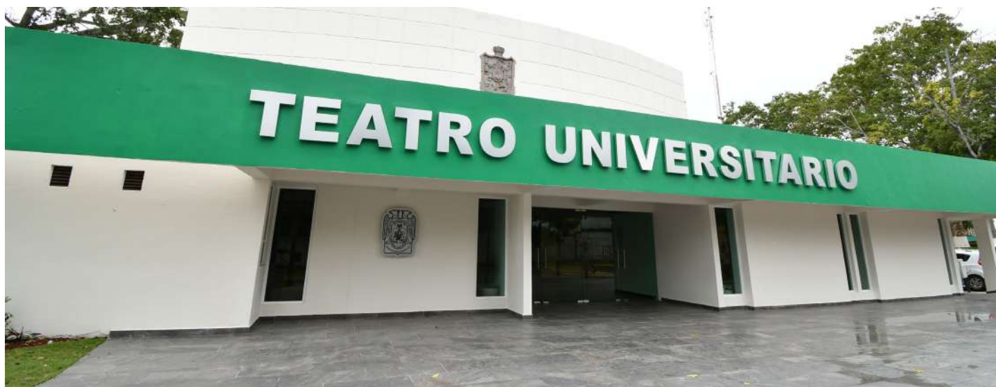
Tiene su origen como Teatro del Estado, inaugurado el 30 de julio de 1963.