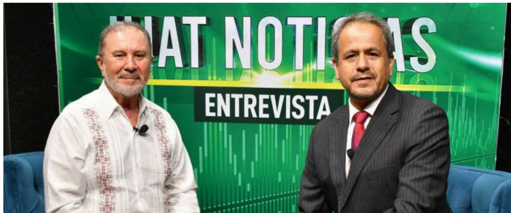
La entrevista fue concedida al espacio de UJAT Noticias.

>> El funcionario estatal destacó que se contó con un evento de calidad, gracias a las gestiones del gobierno de Tabasco.