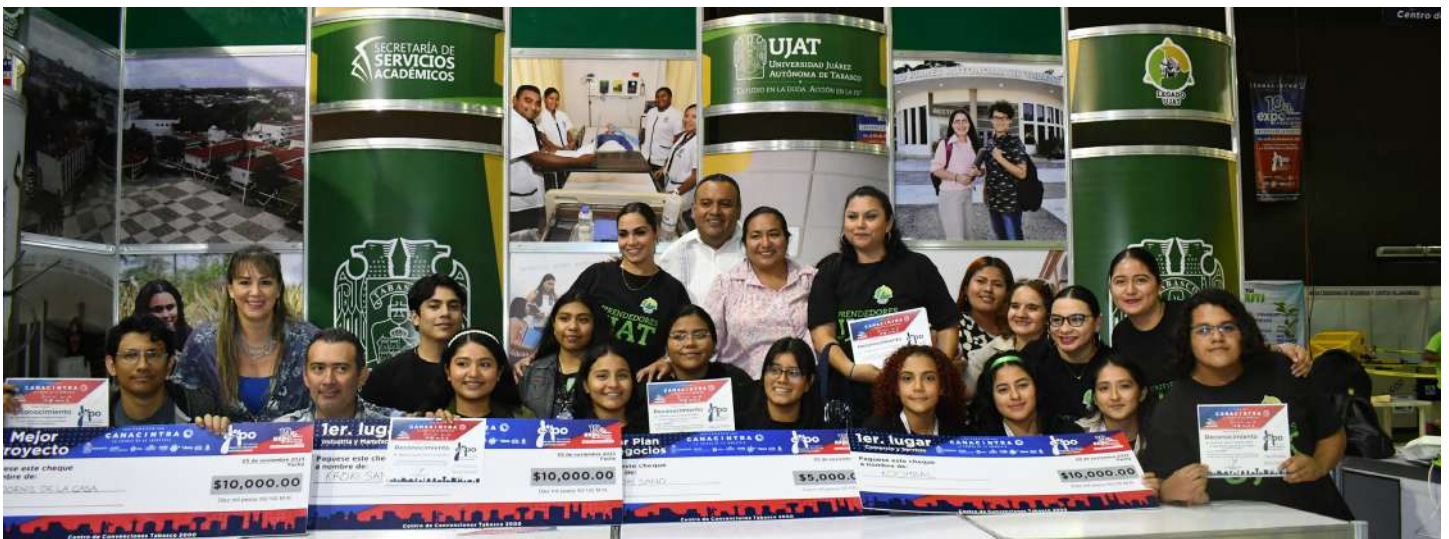
Los seis proyectos, en los que participaron un total de 22 alumnos de la UJAT, recibieron premios en esta edición.

>> En la 19 edición, participaron más de 200 expositores, entre empresarios y universitarios.