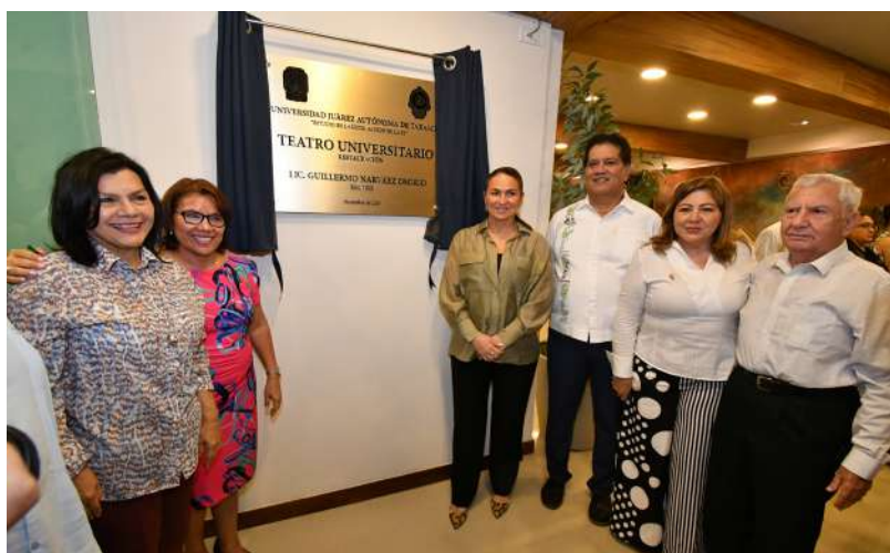
Las autoridades estatales, municipales y universitarias develaron la placa alusiva a esta reinauguración