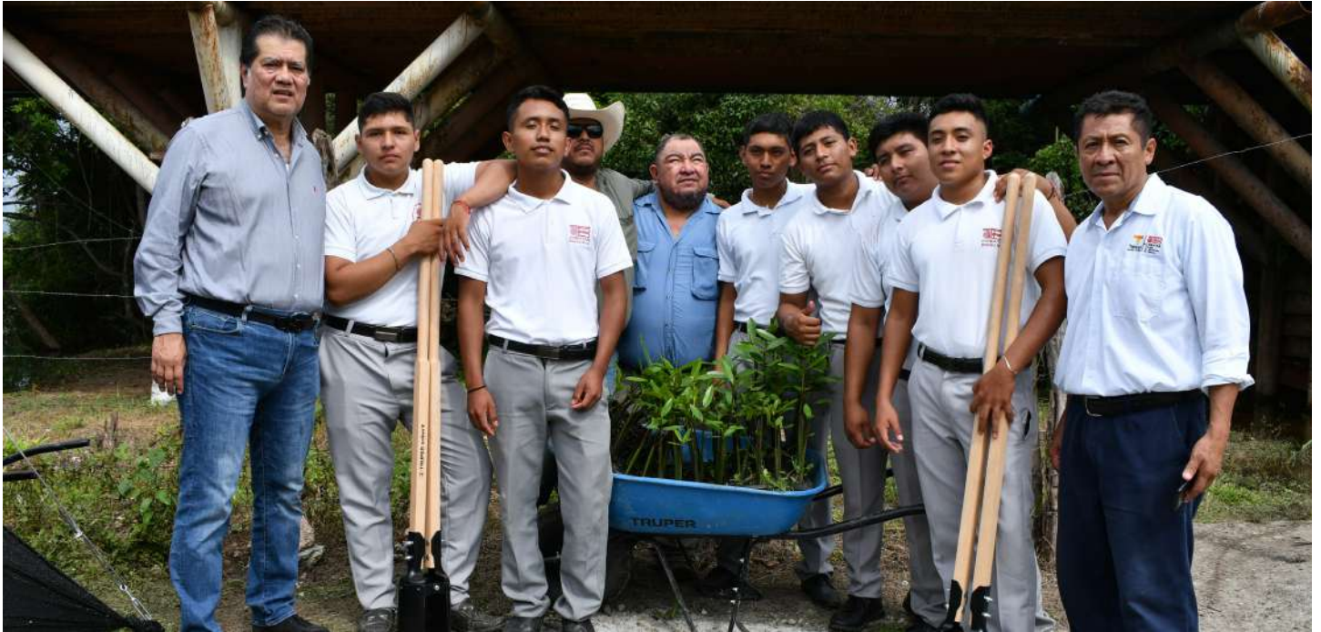
También participaron en esta actividad, estudiantes de nivel media superior de la región de los ríos.

>> Esta campaña de reforestación, tiene la meta de sembrar 28 mil plantas en diferentes zonas de este afluente.