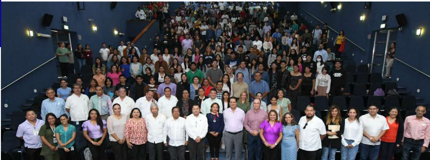
El Festival "Sí a la vida", se realizó en el marco del Día Mundial de la Salud Mental