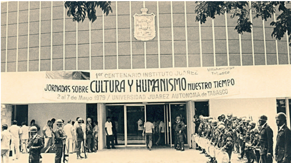
Este recinto fue donado a la UJAT el 29 de julio de 1969

>> La reinauguración contó con la presentación estelar del cantautor mexicano, Fernando Delgadillo.