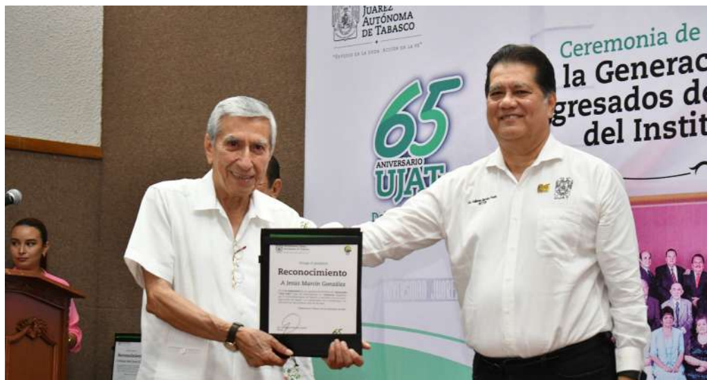
Los ex alumnos del Instituto Juárez se congregaron en este histórico recinto donde cursaron su nivel de bachillerato.

>> Con anécdotas de la enseñanza de esa época, se dieron inicio las actividades del 65 aniversario de la Universidad.