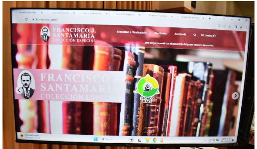
Se cuenta con este acervo digital disponible desde la página www.ujat.mx