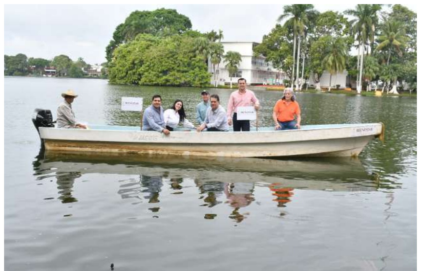
La liberación se realizó en el área de la Laguna que se sitúa en la Zona de la Cultura de la UJAT.