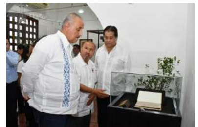
Después del evento protocolario, se realizó un recorrido por las instalaciones de la Colección Especial