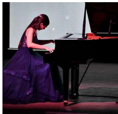
Diversas melodías fueron interpretadas por las manos de los pianistas.