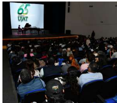
Los asistentes al Teatro disfrutaron de un gran concierto