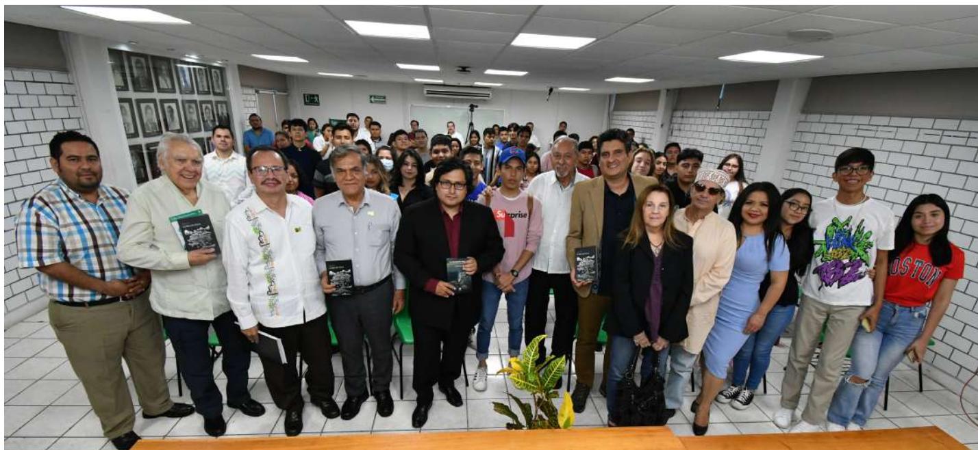
El autor junto a comunidad de la División Académica de Ciencias Ecoómico Administrativas

>> Este evento se desarrolló como parte del programa de actividades por el 65 Aniversario de la UJAT