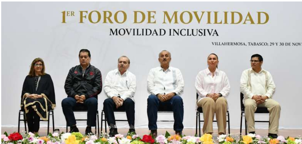
Este Foro se llevó a cabo en la División Académica de Ciencias Sociales y Humanidades