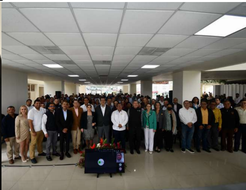
El rector de la UJAT recordó que, desde el 2007, esta casa de estudios instituyó este reconocimiento.

>> En esta edición, se reconocieron 24 trabajos, lo que representó a 66 galardonados.