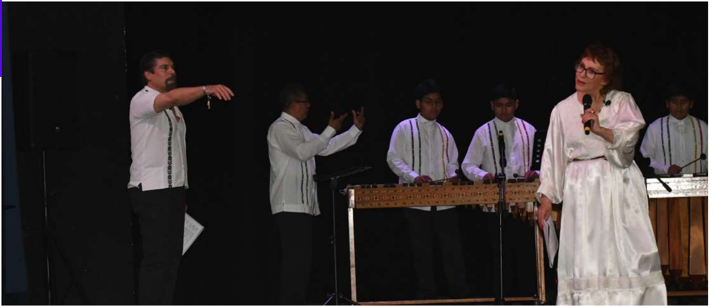
Esta puesta en escena es calificada por ambos actores, como un viaje a la imaginación