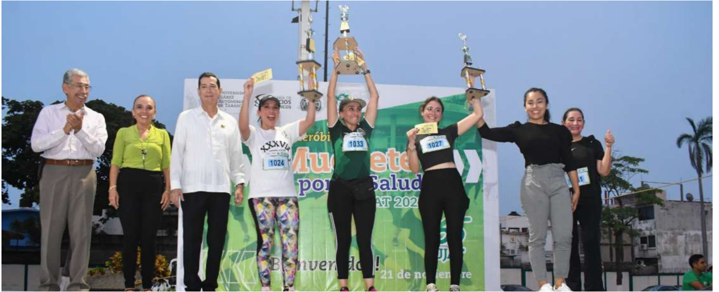
Los participantes se congregaron en la Plaza Cívica Universitaria

>> La temática de esta actividad invitó a los asistentes a moverse por su salud.