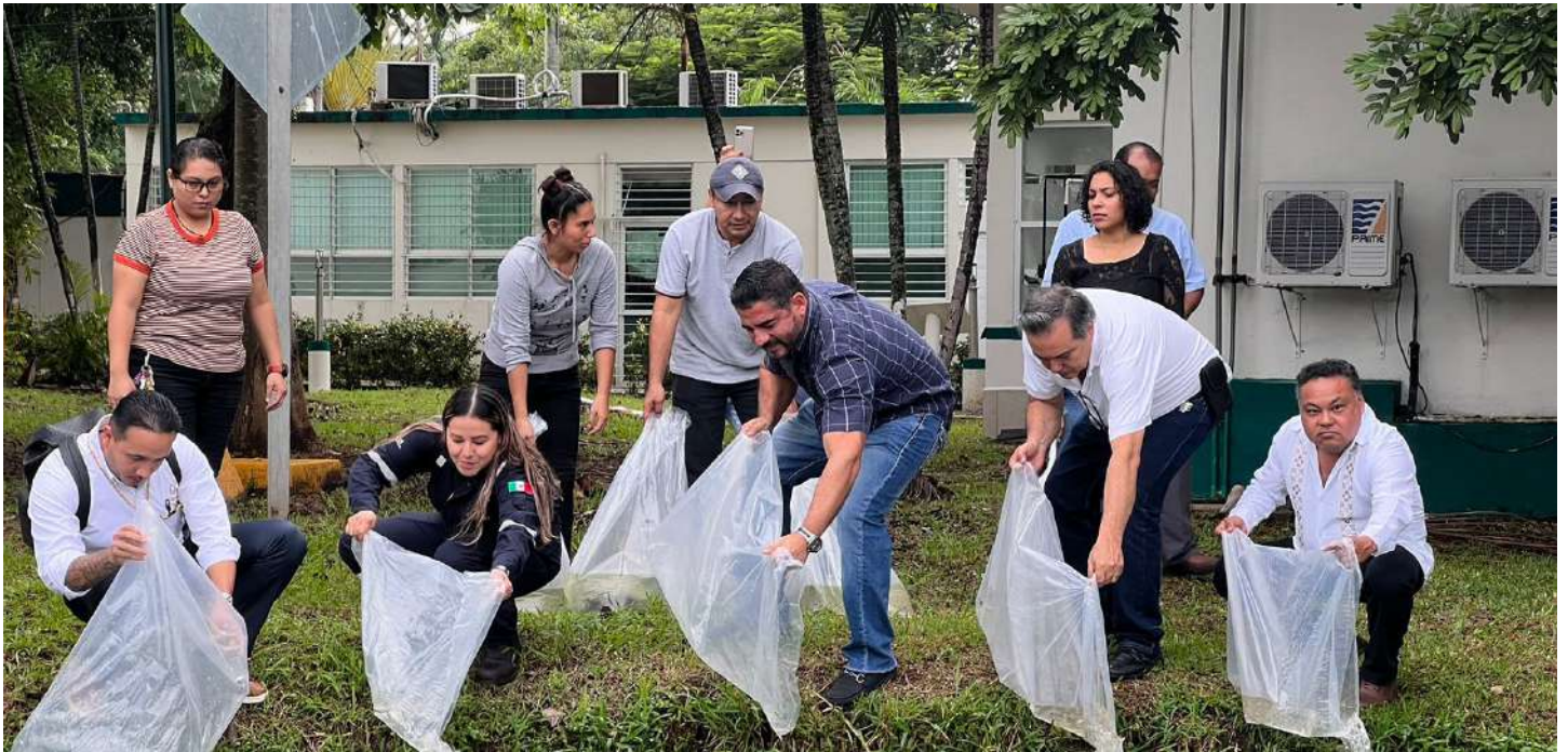
Autoridades universitarias también participaron en esta repoblación con especies nativas.

>> Esta acción de repoblación también se llevará a cabo en el afluente de “La Pólvora”