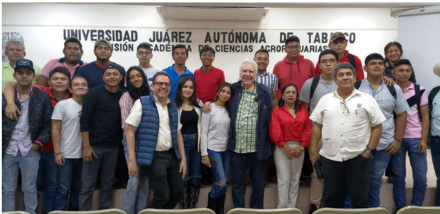
La comunidad estudiantil participó en esta proyección donde se relata la vida del poeta tabasqueño.

>> Esta actividad se realizó en las divisiones académicas de Ciencias Agropecuarias y Ciencias Básicas