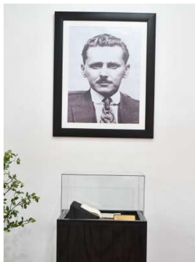
El Instituto Juárez es la sede que alberga todas las obras que representan patrimonio universal