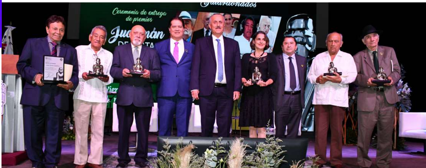
Los galardonados junto al mandatario estatal y el rector de la UJAT, con la estatuilla otorgada por esta casa de estudios.