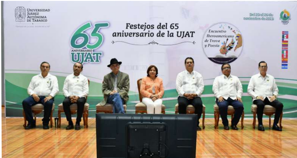
El rector inauguró los festejos por el 65 Aniversario de la máxima casa de estudios de Tabasco.

>> Asistieron poetas de Cuba, Perú, Chile, Italia, Colombia, Costa Rica, Honduras y México.