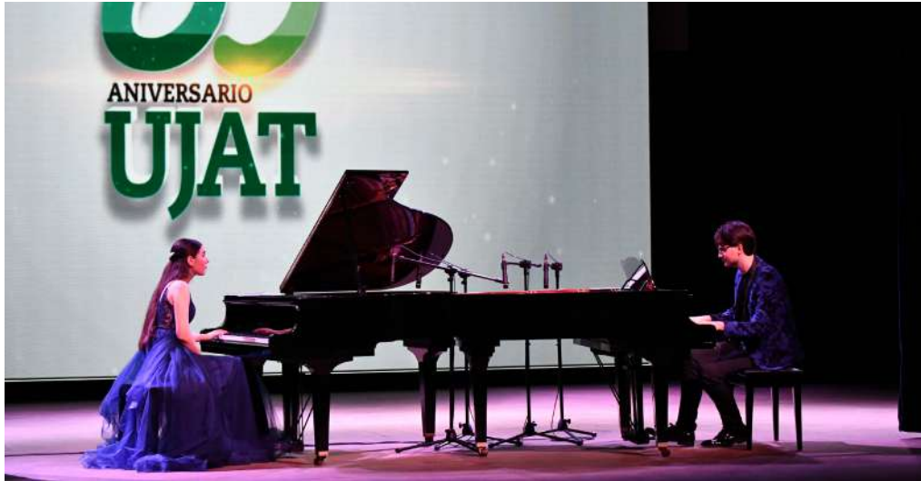
El escenario se engalanó con esta presentación internacional

>> Los pianistas deleitaron a los asistentes al Teatro Universitario