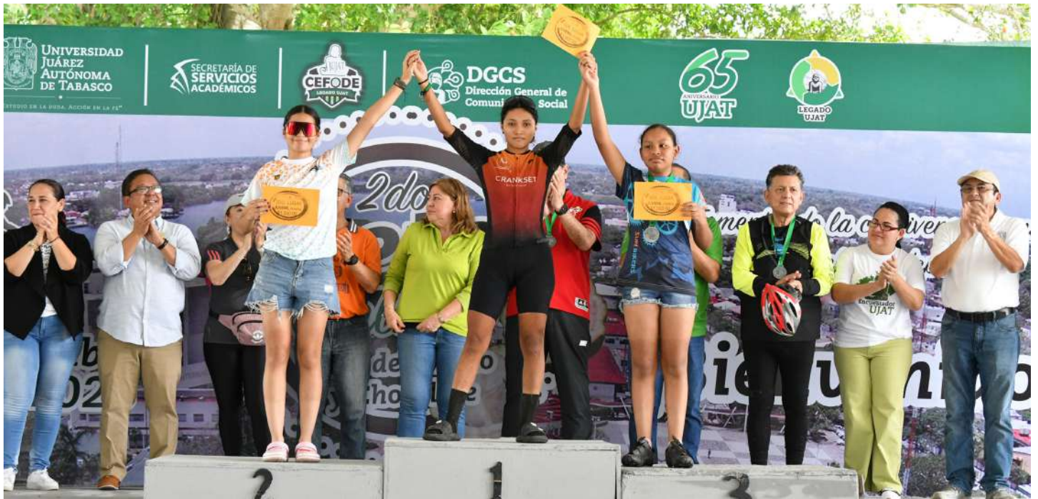
Las autoridades universitarias premiaron a los primeros lugares de cada categoría

>> Esta actividad deportiva, fue el cierre de los festejos por el 65 aniversario de la Universidad.