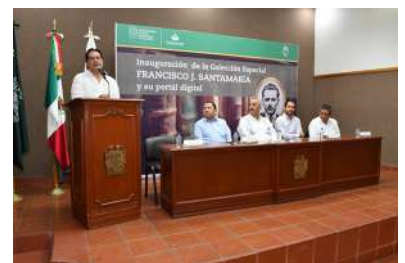
El rector destacó que desde hace poco más de dos años se iniciaron los trabajos de restauración