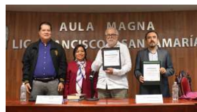
El rector entregó los reconocimientos al ponente y al moderador de esta conferencia.