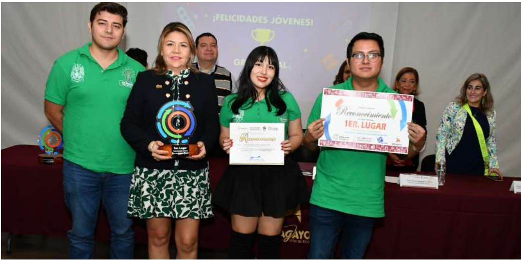
La premiación se realizó en el Museo Interactivo Papagayo

>> Los jóvenes de la DACBIOL, participaron en esta competencia organizada por la SEDENER y el CCYTET