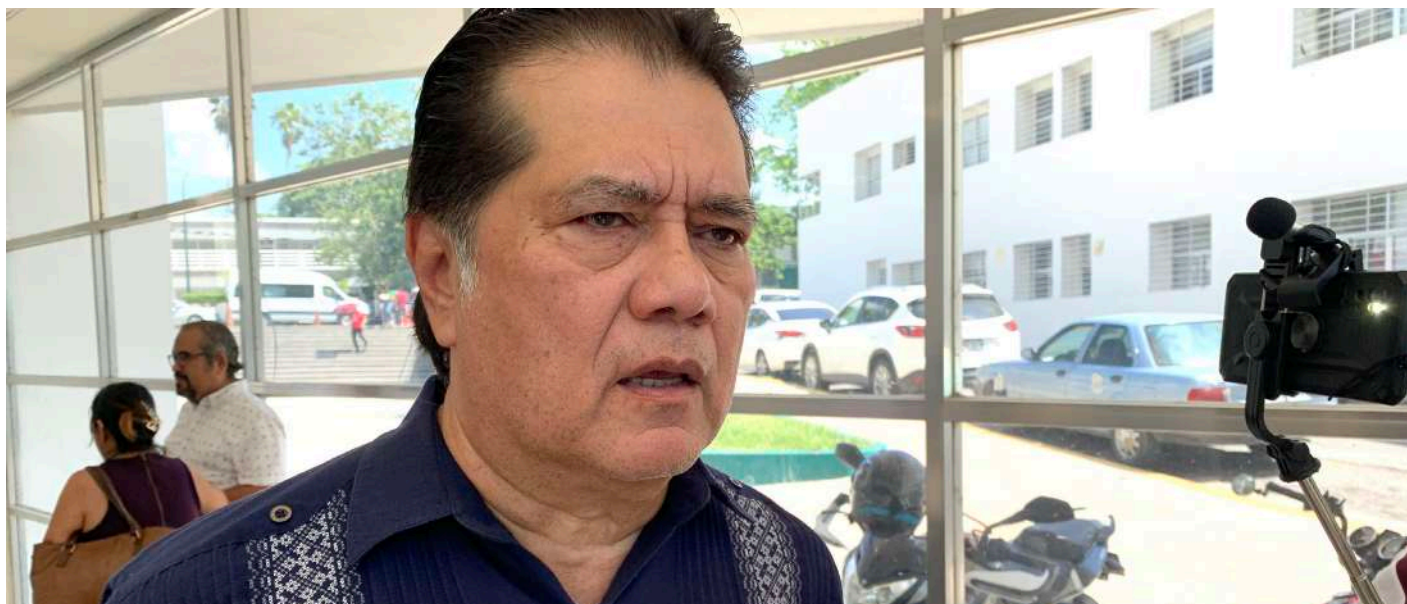
Adelantó sobre la reinauguración del Teatro Universitario y las actividades del 65 Aniversario de la Universidad.

>> El rector fue entrevistado por medios de comunicación local sobre diversos temas de gestión.