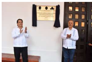
El rector y el gobernador develaron la placa alusiva a este espacio.