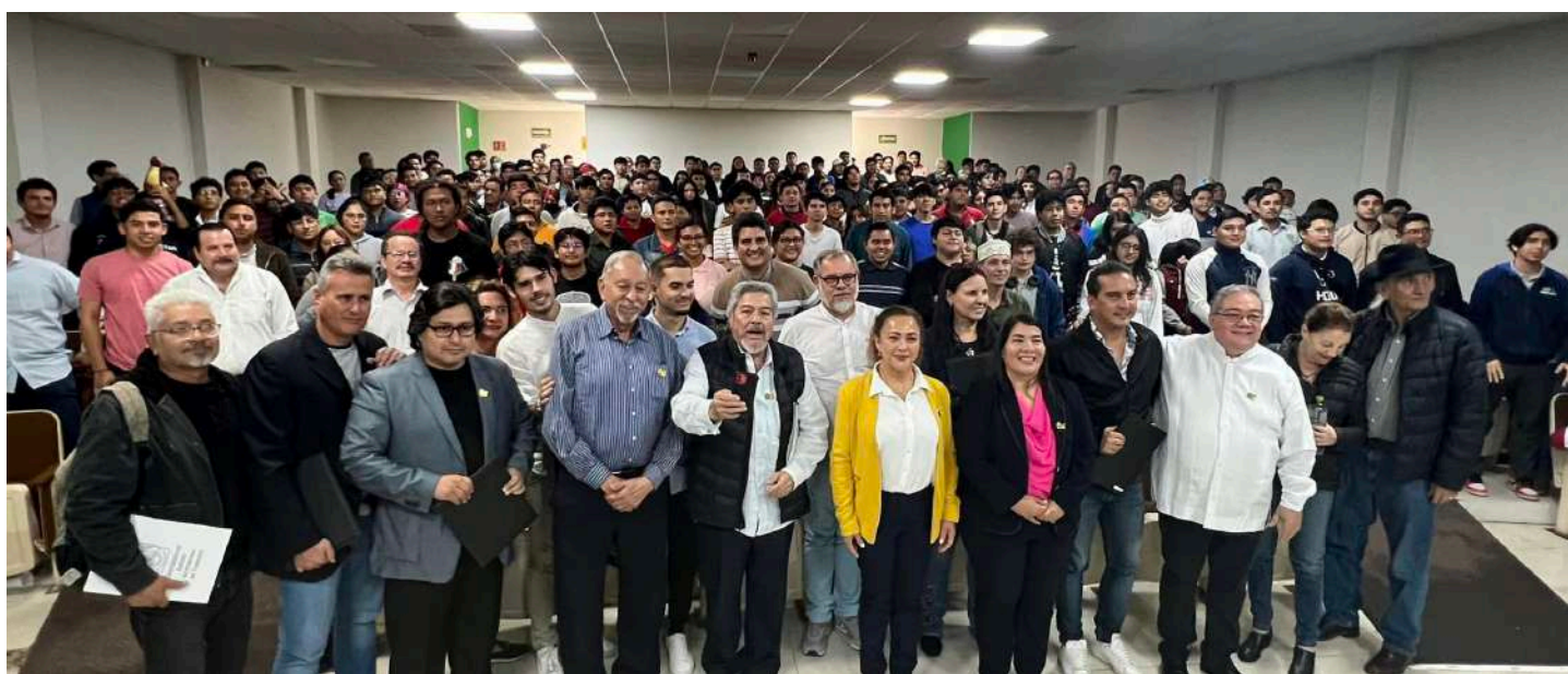
Al finalizar la presentación, los músicos se tomaron la foto del recuerdo con la comunidad de las divisiones académicas de Cunduacán

>> Los artistas cubanos amenzaron este espacio que congregó a la comunidad de las divisiones que integran a este Campus.