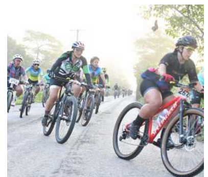
El recorrido contó con personal de apoyo quienes indicaron la ruta a seguir en esta segunda edición del Reto Ciclista.