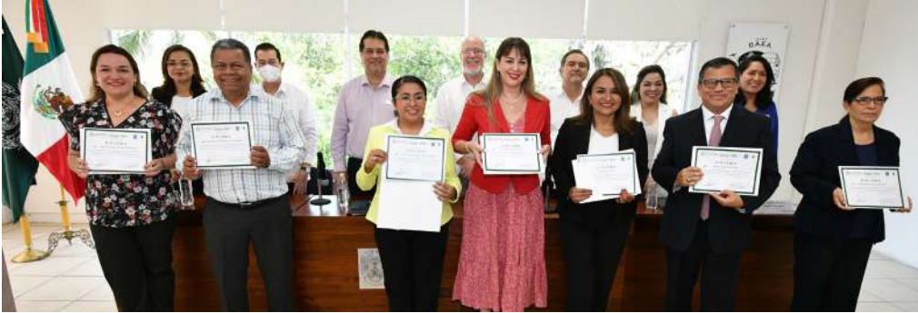
La División Académica de Educación y Artes fue la sede de esta clausura.

>> Se entregaron reconocimientos a 34 profesores investigadores que cursaron este programa.