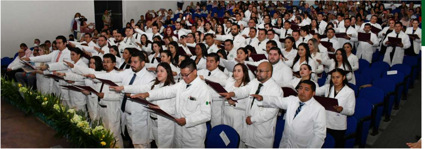
Se dio lectura al Código de Bioética y se tomó protesta a los egresados de las especialidades.