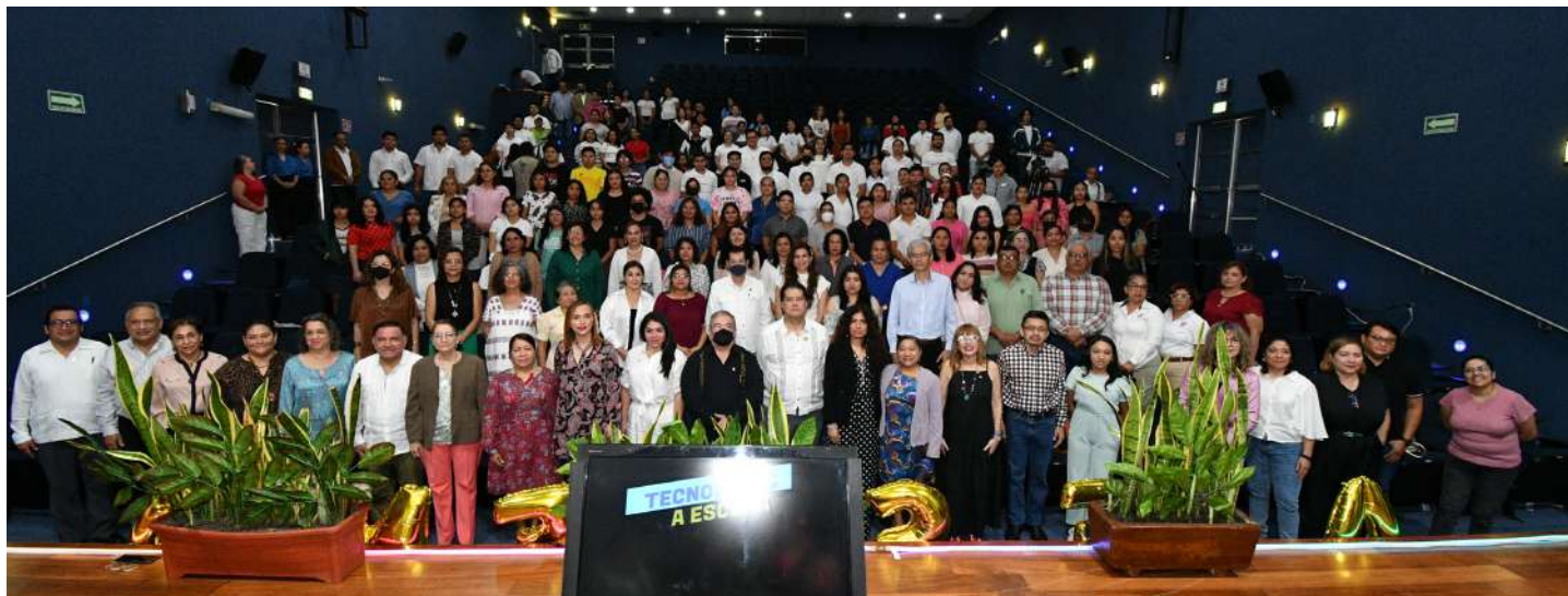
Este evento fue organizado por la División Académica de Ciencias y Tecnologías de la Información