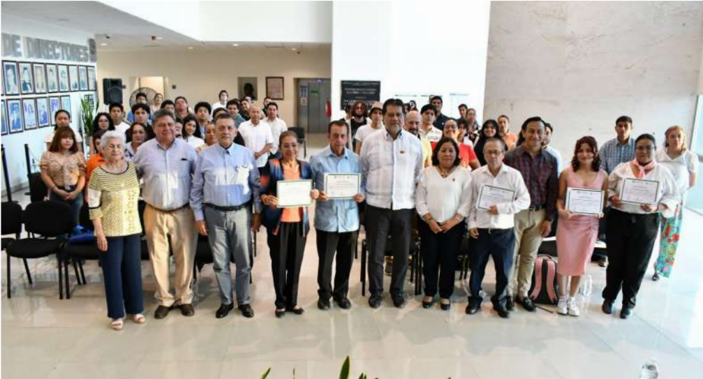
Los asistentes se congregaron en la DACSyH

>> Los panelistas resaltaron la vida y obra del ilustre académico de la Universidad.