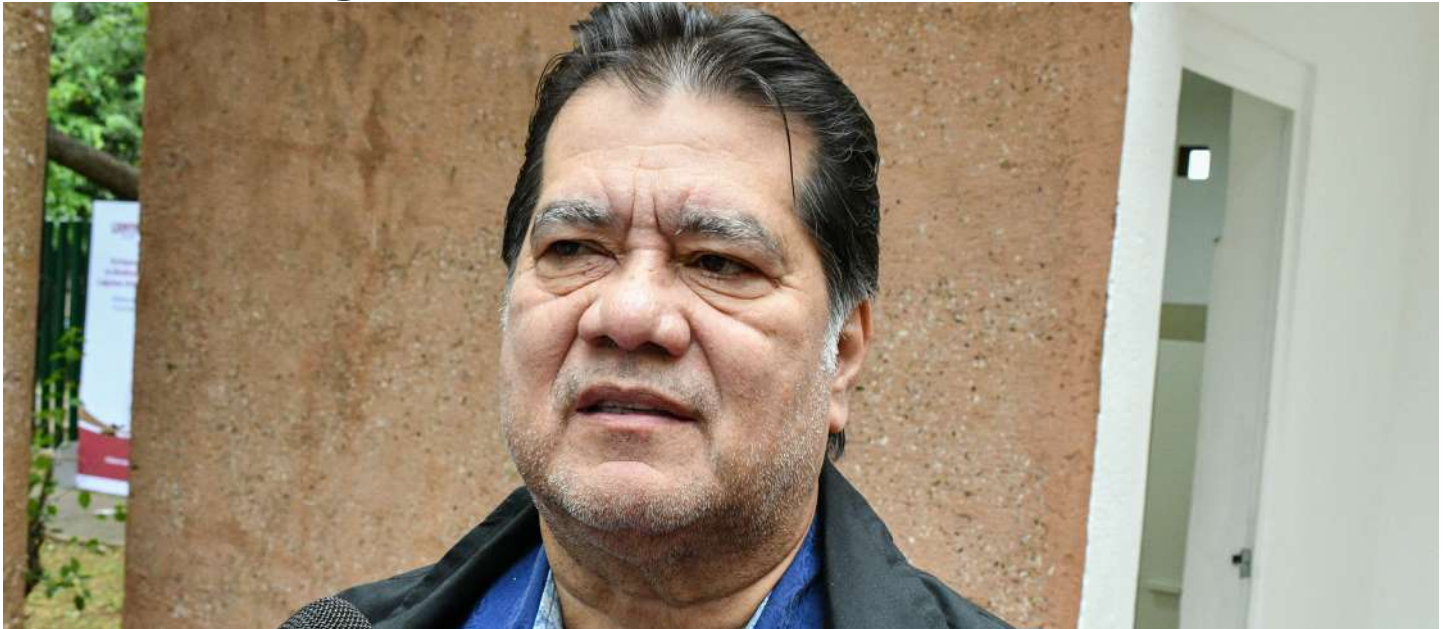
Las declaraciones las realizó en entrevista con medios de comunicación.