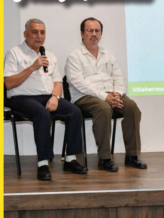
En rueda de prensa, se dieron a conocer las actividades culturales. Pág. 11