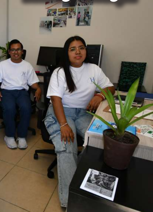
En ambos espacios se brindará orientación a migrantes. Pág. 22