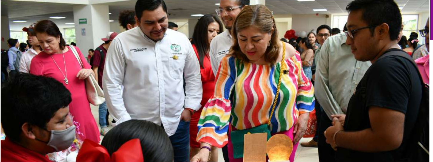
Los emprendedores se instalaron en el vestíbulo del CIVE