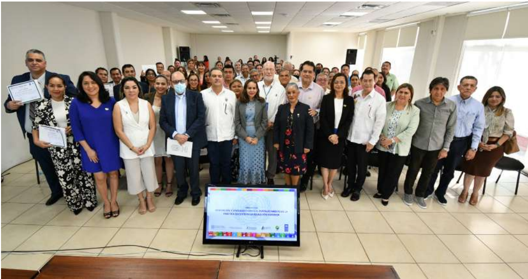
El Diplomado se desarrolló de septiembre de 2023 a enero de 2024.