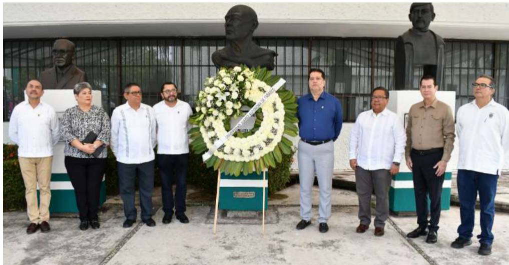
El rector inauguró los festejos por el 65 Aniversario de la máxima casa de estudios de Tabasco.