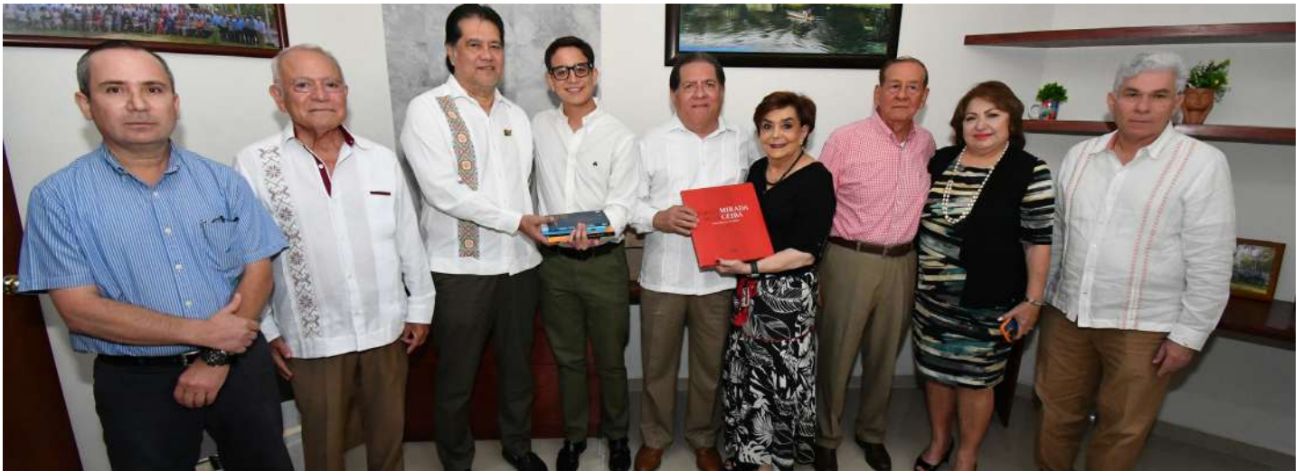
La inauguración de este espacio se realizará el 13 de marzo, anunció el titular de este organismo estatal.

>> Las obras son procedentes del Fondo Editorial Universitario y abordan temas de cultura general y del ámbito jurídico.