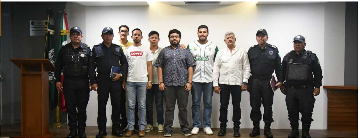
Los participantes se congregaron en la Sala Jorge Membreño Juárez