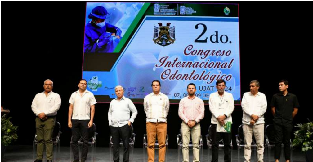
Este evento se llevó a cabo en el Teatro Esperanza Iris

>> Más de mil 200 asistentes participaron en la edición de este encuentro académico-científico.