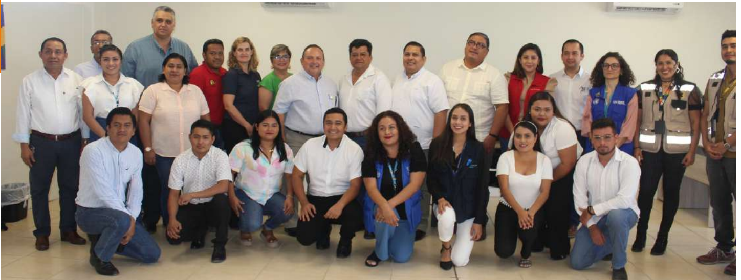
Se destacó la labor que realiza la UJAT en Tenosique, para apoyar a estos grupos de personas en su tránsito por la entidad.