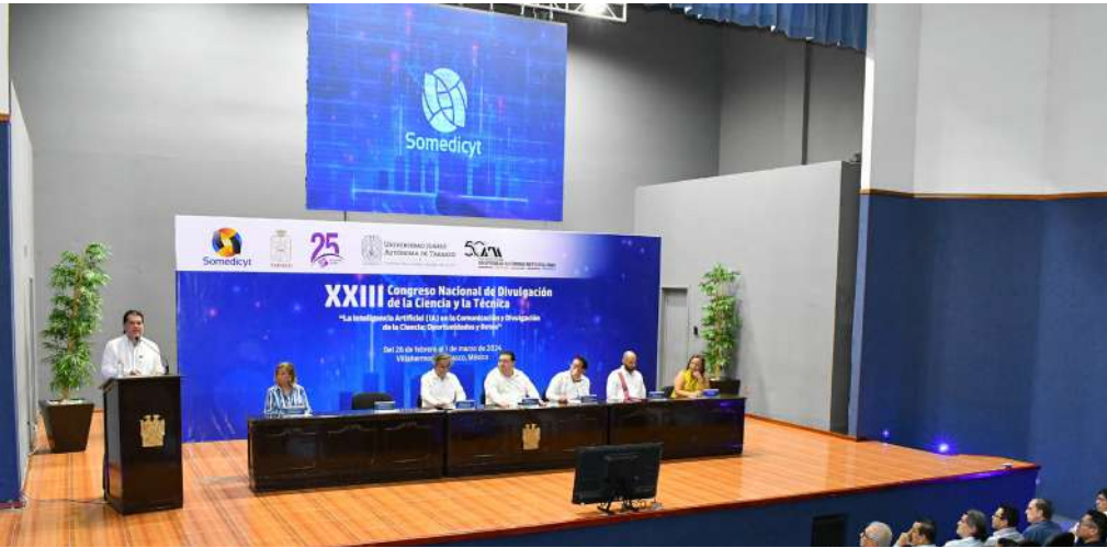
Los asistentes se congregaron en el auditorio del CIVE.

>> Se inauguraron los trabajos del XXIII Congreso Nacional de Divulgación de la Ciencia y la Técnica.