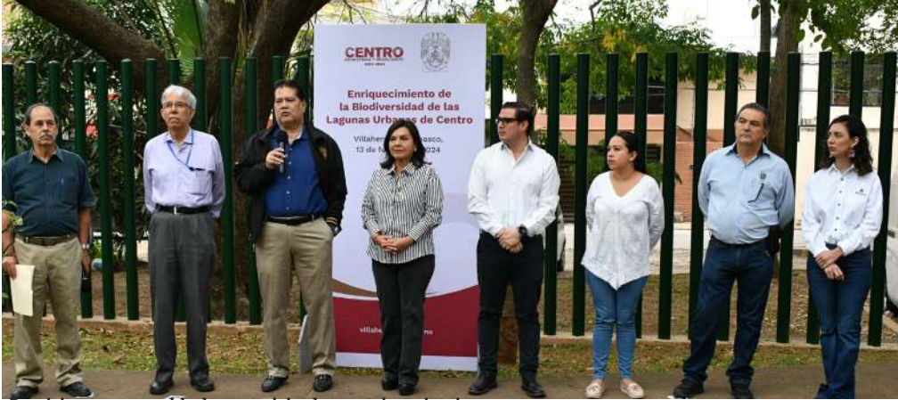
Participaron autoridades municipales y universitarias

>> Se depositaron seis mil juveniles de mojarra Casta Rica y 20 reproductores de Pejelagarto.