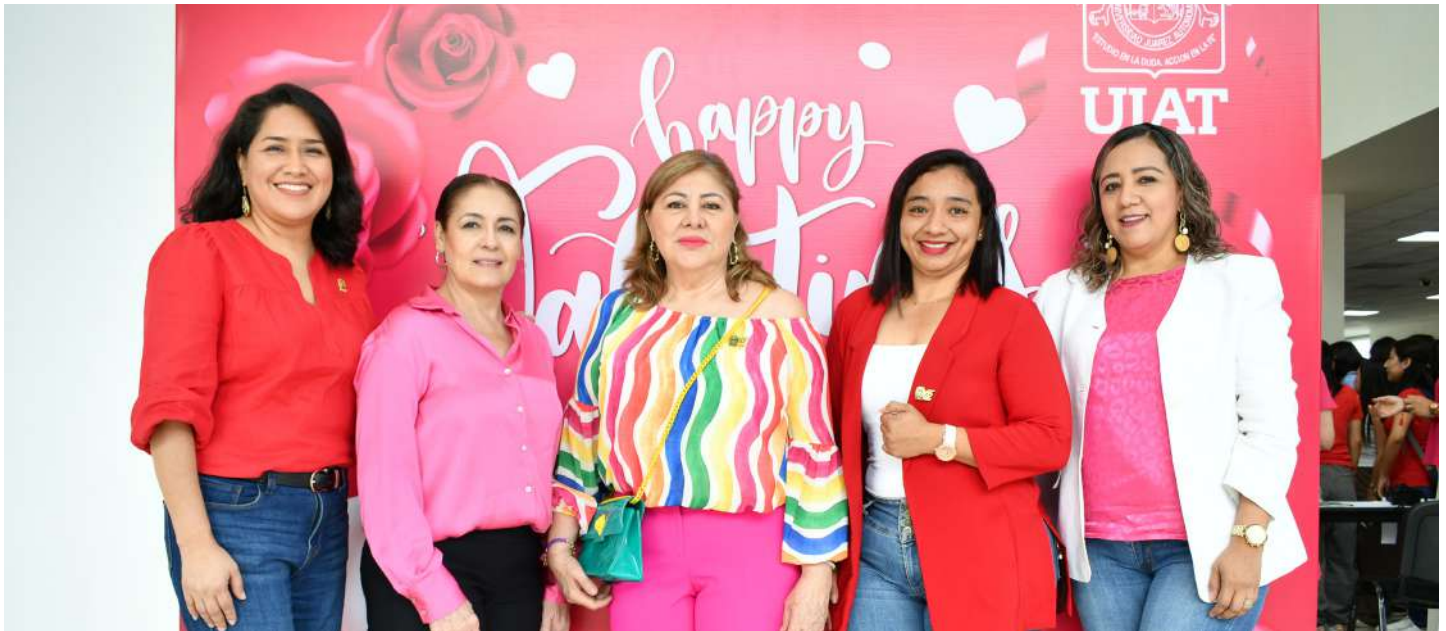
La presidenta del Voluntariado con integrantes de la Fundación UJAT.

>> Lo recaudado se destinó a las becas del programa “Apadrina a un estudiante”