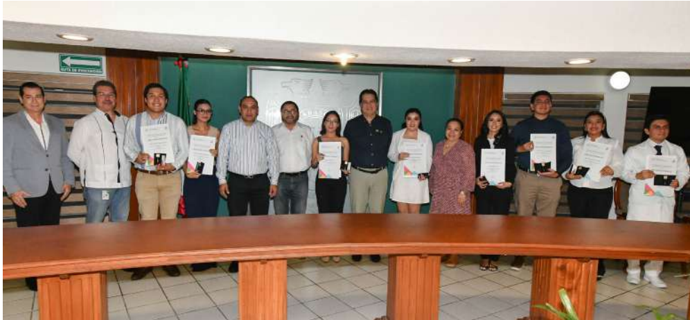
Los premiados recibieron el reconocimiento en las instalaciones de la Rectoría.

>> Un total de once jóvenes de la DACS, DAMC y DAMJM alcanzaron esta distinción.