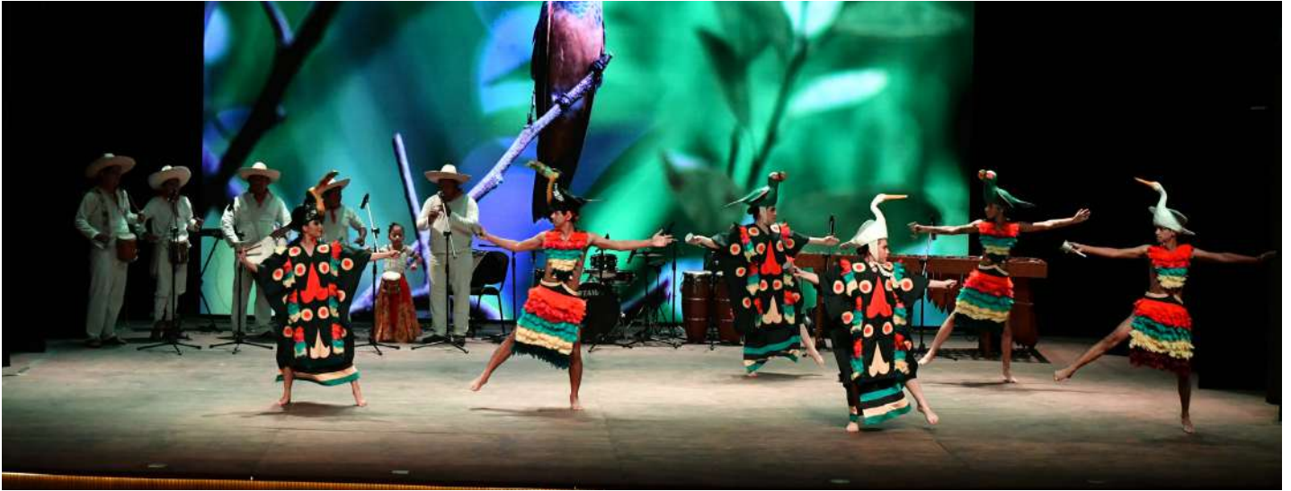
El Teatro Universitario fue el escenario donde se dio muestra del talento de los integrantes del Centro de Desarrollo de las Artes