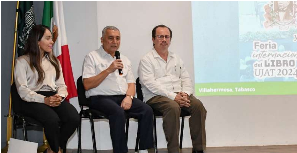
Los medios de comunicación se congregaron en la Sala Jorge Membreño Juárez

>> La rueda de prensa fue presidida por el director General de Comunicación Social, el director de Difusión Cultural y la directora del Centro de Fomento al Deporte.