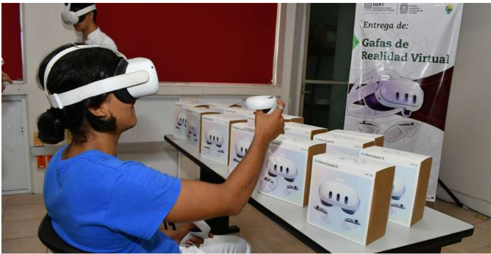
Se realizaron pruebas del equipo adquirido por la Universidad