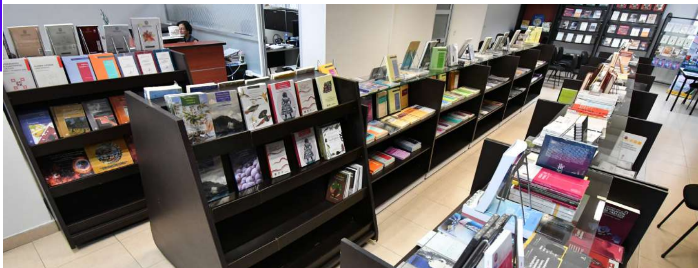
Este espacio se encuentra en la Av. 27 de Febrero, número 626, a unos pasos del Instituto Juárez.