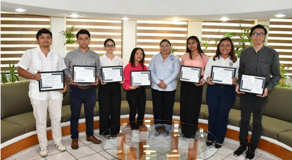
La entrega de constancias se realizó en las instalaciones de Rectoría