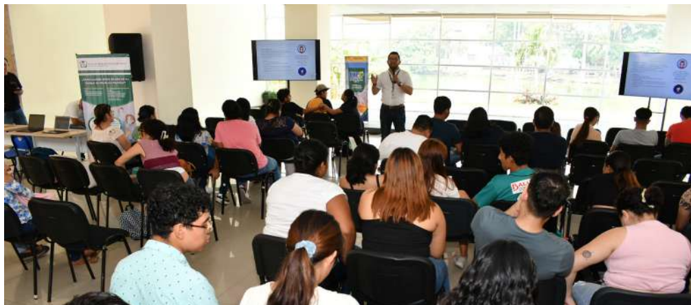
El rector participó en la inauguración de estas jornadas.