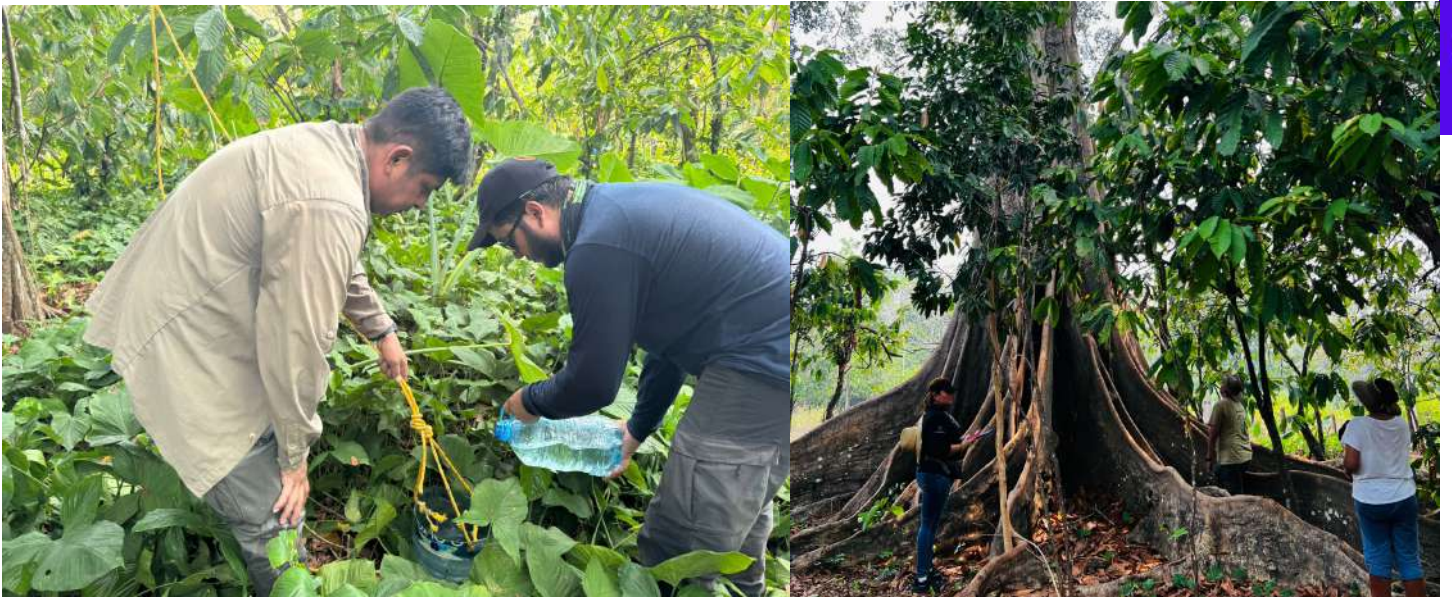
Los investigadores colocaron tanques con agua y alimentos, para los primates de la zona