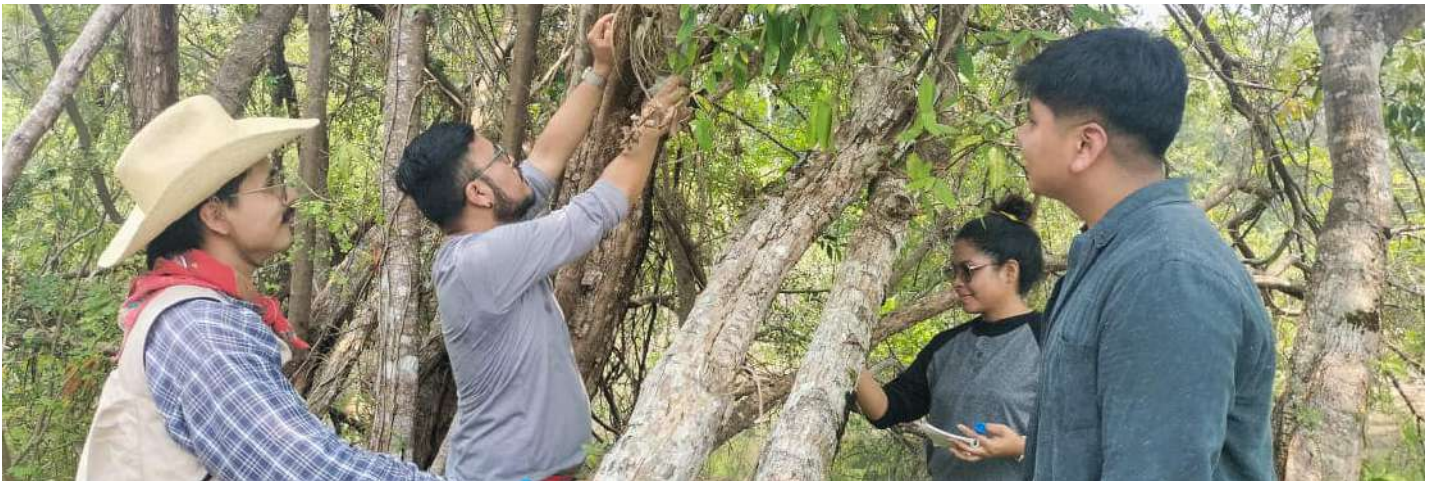
También visitaron el área de la Reserva de la Biósfera Wanha'