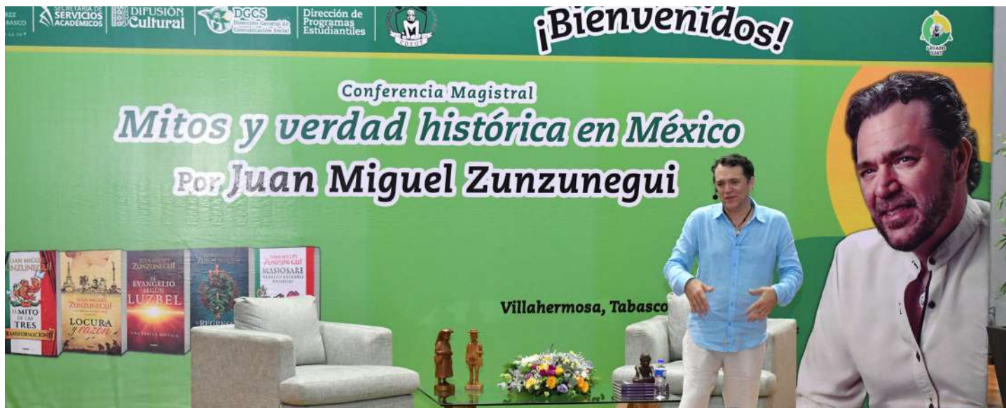
Los asistentes se congregaron en el auditorio del Centro Internacional de Vinculación y Enseñanza

>> El escritor disertó la conferencia magistral “Mitos y Verdad Histórica en México”.