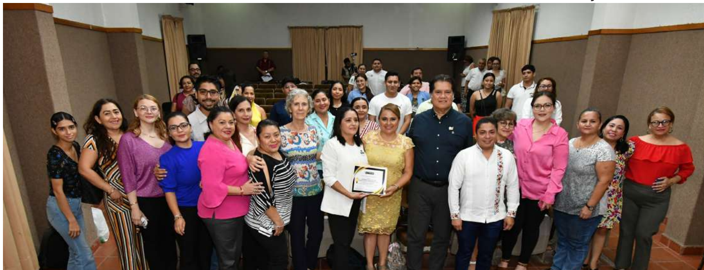
El auditorio "Manuel Sánchez Mármol" del Instituto Juárez, fue el escenario para la entrega de esta distinción