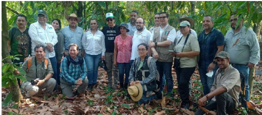
Los especialistas realizaron una visita In Situ, en las zonas de avistamiento

>> Se instalaron centros de acopio en las divisiones académicas de esta casa de estudios.