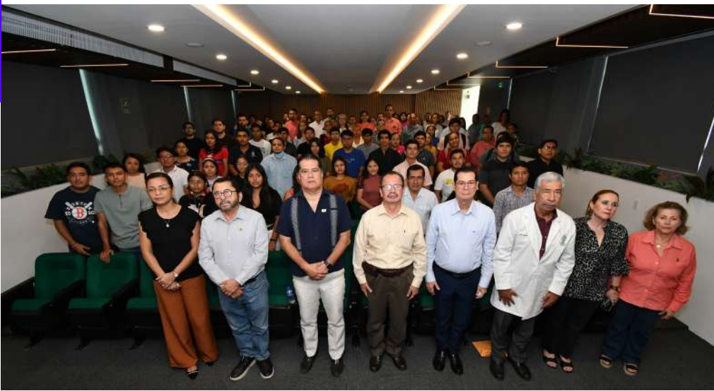
La Sala "Jorge Membreño Juárez" fungió como escenario de las primeras actividades de la Jornada.