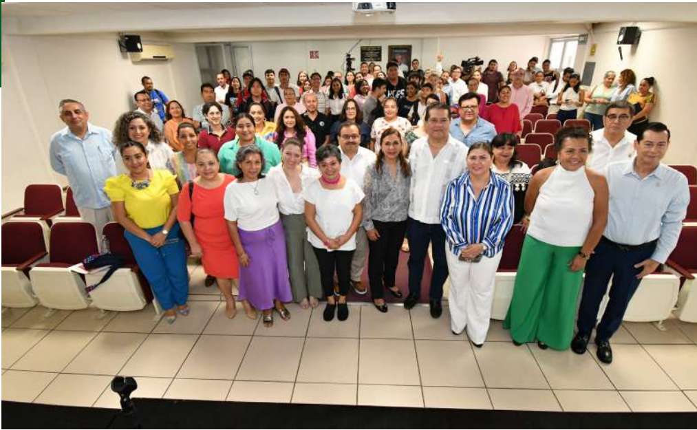
El rector presidió esta ceremonia, efectuada en las instalaciones de la DAEA