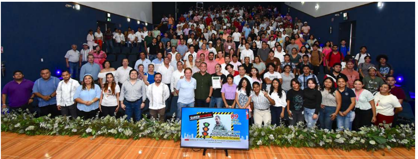
Se entregó un reconocimiento al ponente, por su participación en el auditorio del CIVE de la UJAT