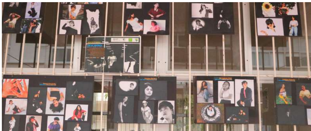
Se realizó la exposición fotográfica por estudiantes de la DAEA

>> Un total de 12 actividades se programaron en el marco de este festejo