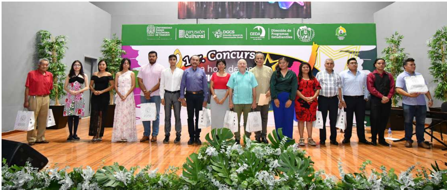
Serán seis sesiones, que se realizarán en el auditorio del Centro Internacional de Vinculación y Enseñanza.

>> Los dos seleccionados se presentarán en la gran final, el próximo 12 de julio