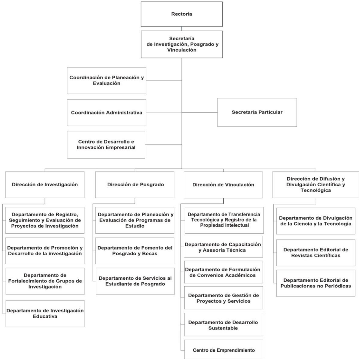
Organigrama de la Secretaría de Investigación, Posgrado y Vinculación

QUINTO. Se reforma el organigrama del Órgano 18 Secretaría de Investigación, Posgrado y Vinculación, para quedar de la siguiente manera: