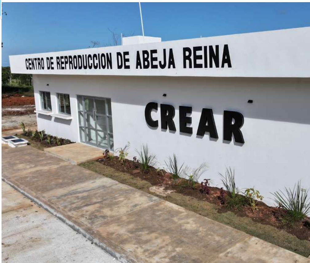
Este espacio ahora se encuentra en la fase de equipamiento para dar inicio a sus actividades

La infraestructura universitaria cuenta actualmente con más de tres mil 100 espacios físicos.