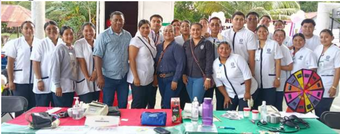
Estudiantes realizaron diversas acciones de servicio social comunitario, así como brigadas que vinculan a la UJAT con la sociedad.

Se puso en operación la Casa Universitaria del Agua como recito que promueve el uso responsable de este recurso hídrico.