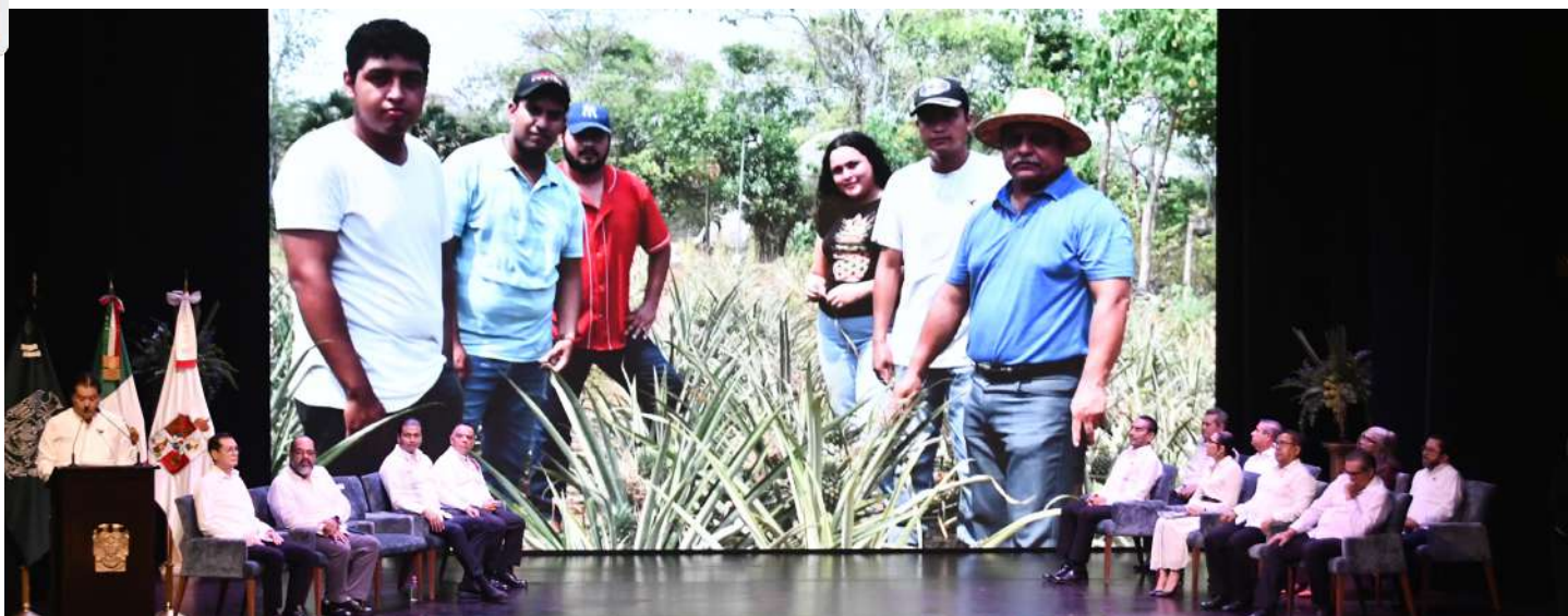
Ante el pleno del H. Consejo Universitario, el rector destacó los logros en materia de investigación

Se fortaleció la productividad en materia de investigación y se consolidó la presencia de profesores en los sistemas estatal y nacional de investigadores.