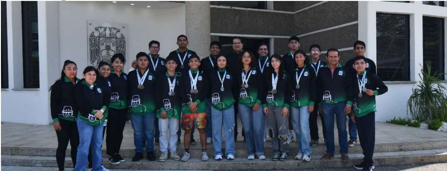
De manera histórica, atletas universitarios obtuvieron 26 medallas en diversas disciplinas de la Competencia Nacional Universiada

A través de su comunidad, esta casa de estudios se ha proyectado a nivel internacional.