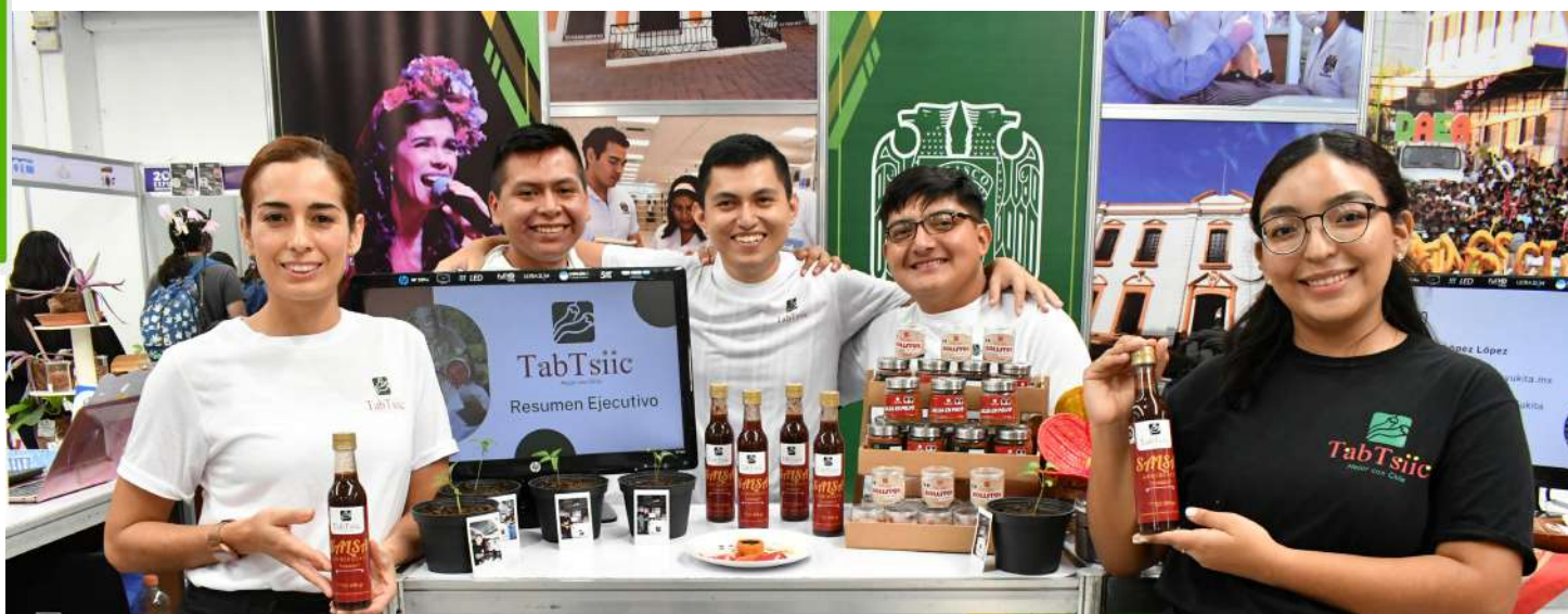
Estudiantes dejaron en alto el nombre de la UJAT, al ganar distinciones en diversos eventos de talla estatal, nacional e internacional.