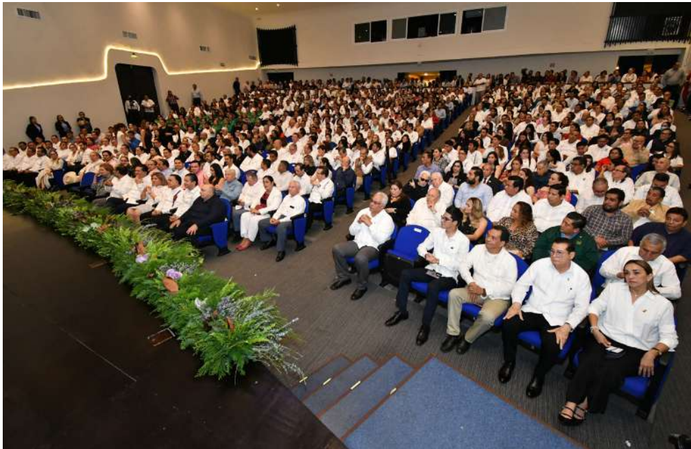
El Teatro Universitario congregó a comunidad universitaria y representantes de diversos sectores de la entidad y el país.

A las 17:00 horas, con el cielo despejado como un lienzo limpio sobre Villahermosa, el Teatro Universitario comenzó a llenarse. La luz del atardecer, todavía firme, parecía concederle a la jornada una tregua: ni sombras largas ni nubes densas, solo claridad. Era un buen presagio para una Universidad que se preparaba para mirarse a sí misma.